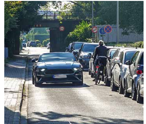
Hier wird es eng: Wiesbadener Straße in Kriftel mit Begegnungsverkehr