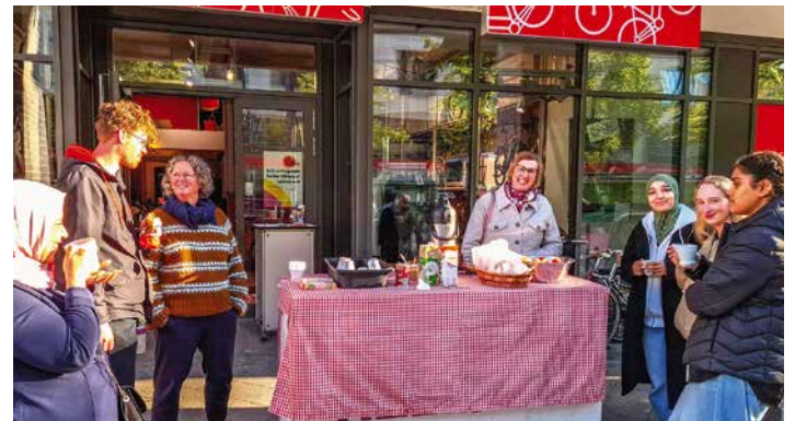
„Pendlerfrühstück“ vor den Räumen des artefakt-Laden / Fahrradparkhaus in der Berliner Straße