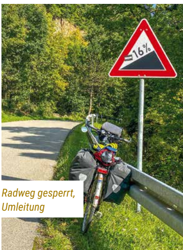
Radweg gesperrt, Umleitung

Auch Oberndorfs Altstadt liegt hoch oben über dem Tal, sodass wir einen schweißtreibenden Anstieg hinter uns haben, als wir vor einer Bäckerei Platz nehmen. Wieder hinunter ins Tal rollen wir zurück zu rheinmetall defense und zum Neckarradweg, der hinter der Stadt sehr schön