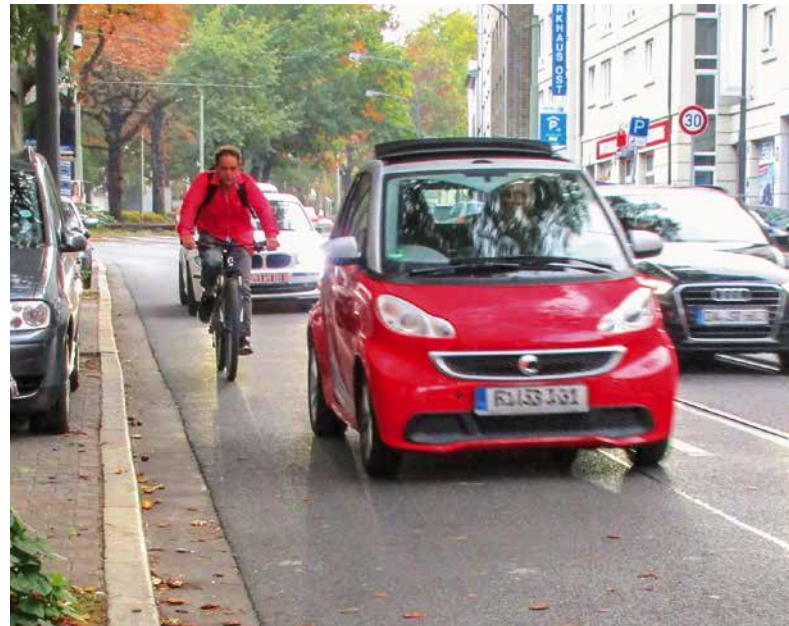
Morgendlicher Berufsverkehr auf der Wittelsbacherallee stadteinwärts – Radverkehr ist hier weder sicher noch vergnüglich