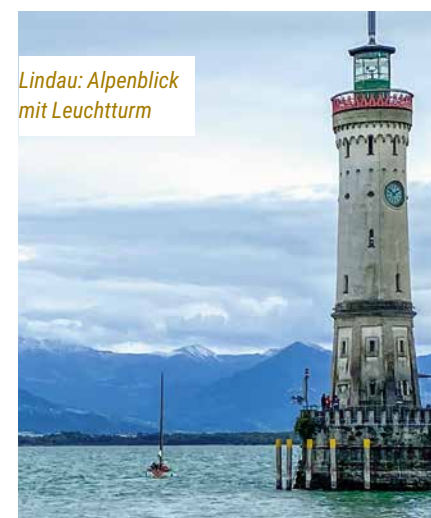
Lindau: Alpenblick mit Leuchtturm