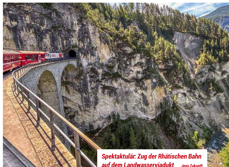
Spektakulär: Zug der Rhätischen Bahn auf dem Landwasserviadukt Jens Zukunft

in München war noch Zeit für eine kleine Rundfahrt durch die Stadt, auf der Jens uns zum Englischen Garten führte, wo wir das angenehme Sommerwetter genießen konnten. Anschließend ging es zurück zum Bahnhof und mit dem ICE nach Frankfurt, der die Mainmetropole gegen 22 Uhr erreichte.