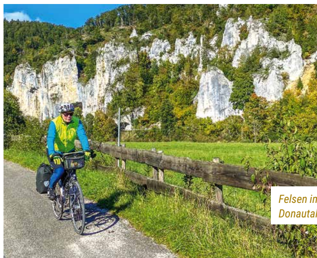
Felsen im Donautal