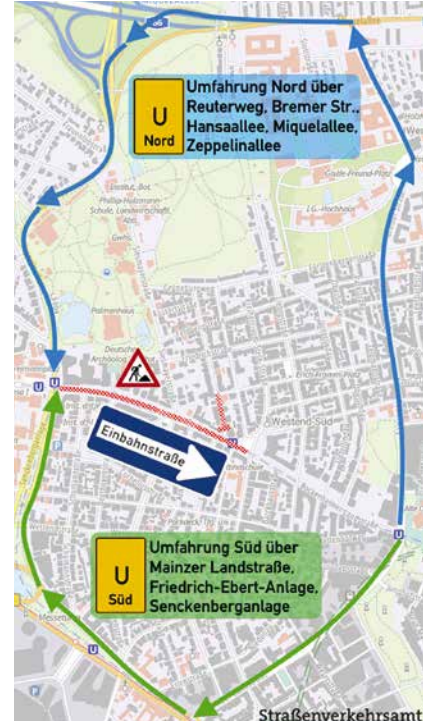
Straßenverkehrsamt der Stadt Frankfurt

Kaum war der Reuterweg nach langer Baustelle wieder offen, starteten die Bauarbeiten auf der benachbarten Bockenheimer Landstraße. Die von der Autolobby prophezeiten Autostaus blieben, wie schon beim Reuterweg, auch dieses Mal aus. Für uns sehr positiv: Die Straße wird kernsaniert, dabei werden direkt breite und baulich getrennte Radwege eingerichtet. Die Baustelle ist dabei ein wunderbarer Testlauf, um die von manchen prophezeiten dramatischen Auswirkungen praktisch zu untersuchen. Bisher läuft es an der Baustelle erstaunlich friedlich ab. Das dürfte auch damit zusammenhängen, dass die Stadt Frankfurt wieder die Navigationsdienste vorab über die Sperrung informierte. Dadurch bekommen die meisten Autofahrerinnen und Autofahrer gar nichts von der Baustelle mit.