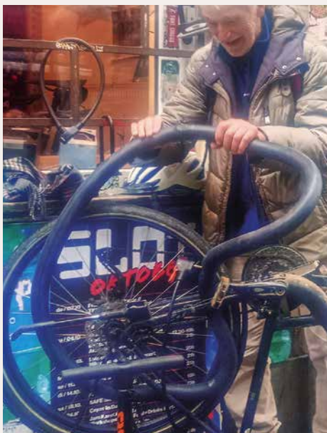
Kein indischer Seiltrick, sondern der Versuch eines Rentners, seinen Reifen zu flicken

Dem hinter der Theke stehenden mittelalterlichen Mann, er war, wie sich schnell herausstellte, der Inhaber, schilderte ich mein Problem. Seine Reaktion: „In drei Monaten kannst du einen Termin haben“. Als ich ihn ungläubig anschauete, drückt er mir eine Luftpumpe, Werkzeug und Flickzeug in die Hand: „Die Reparatur machst du aber draußen auf der Straße! Hier drinnen ist kein Platz!“