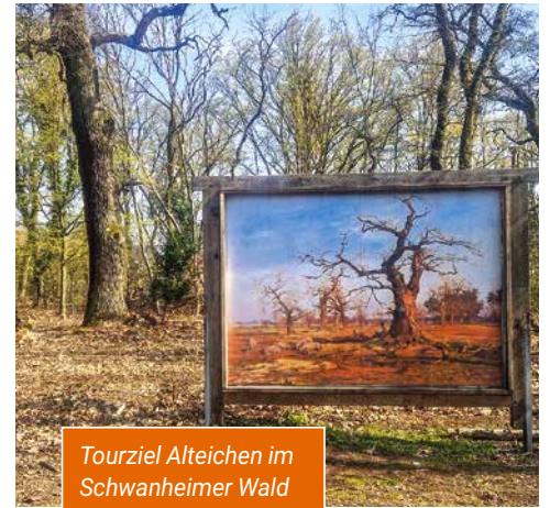
Tourziel Alteichen im Schwanheimer Wald