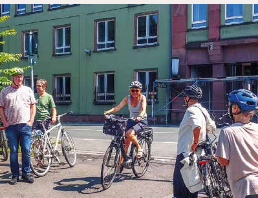
Tourenziele: Oehlersche Fabrik (oben), Darmstadt Rosenhöhe (unten)