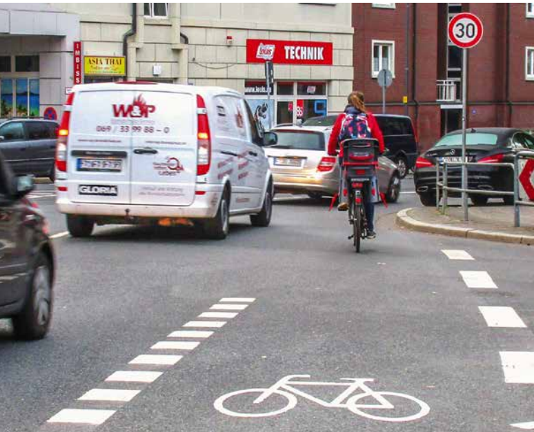
Auf der Wittelsbacherallee endet der Radstreifen vor der Wingertstraße, hier wird es eng beim Einfädeln in den fließenden Kfz-Verkehr