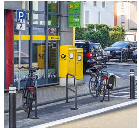
Vor der Hofheimer Post wurden nun Fahrradparker geschaffen Holger Küst (3)