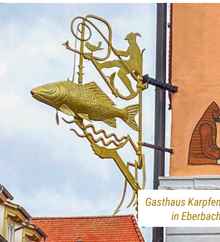
Gasthaus Karpfen in Eberbach