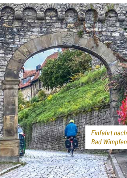
Einfahrt nach Bad Wimpfen

Kurz darauf, wir haben Regenschirme des Hotels entliehen, spazieren wir zur Schillerhöhe, auf der das Deutsche Literaturarchiv zwar geschlossen, das Café aber geöffnet hat. Der sonst wohl weite Blick von der Terrasse des Literaturarchivs reicht heute gerade hinunter bis zum Neckar oder hinüber zum Schlot des Kraftwerks. Auch Schiller steht im Regen, unbeschützt im Zentrum der