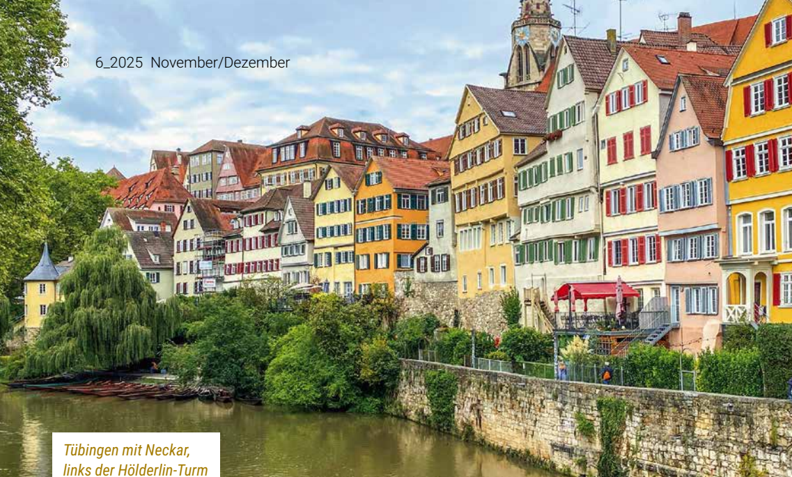
Tübingen mit Neckar, links der Höllderlin-Turm

» Dichter Hölderlin viele Jahre seines Lebens verbracht hat. Heute beherbergt der Turm ein hübsches kleines Museum, in dem uns Hölderlin und seine Zeit erklärt werden. Die großen Besuchergruppen verzichten glücklicherweise auf den Museumsbesuch, und so teilen wir uns den Turm mit wenigen anderen und können uns in Ruhe der Zeit vor rund 200 Jahren widmen. Durch einen Film, in dem auf der Terrasse des Literaturarchivs in Marbach aus Hölderlins Werken vorgelesen wird, erfahren wir, wie weit dort der Blick übers Land reichen kann, wenn das Wetter gut ist (siehe oben).