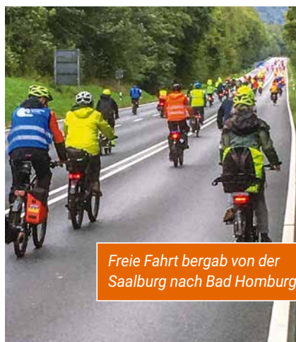
Freie Fahrt bergab von der Saalburg nach Bad Homburg