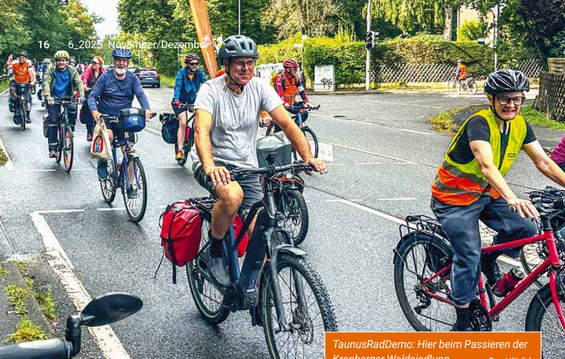
TaunusRadDemo: Hier beim Passieren der Kronberger Waldsiedlung