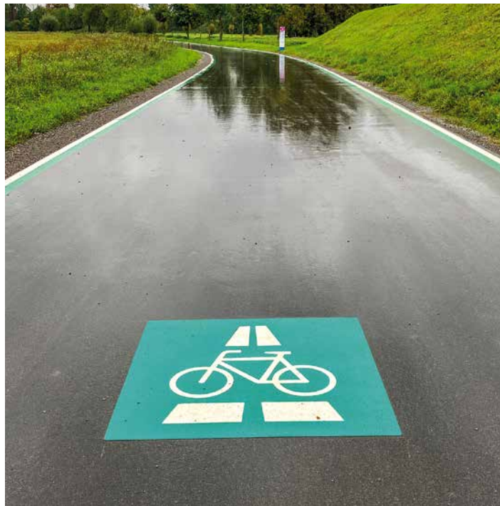
Radschnellverbindung, markiert mit Zeichen 350.1 laut StVO – hier ein Beispiel in der Nähe von Heilbronn

Ein zentraler Punkt für Radfahrende und Expert:innen ist die Frage der Wertschätzung von Fachkompetenz: Die Empfehlungen des unabhängigen Planungsbüros und zahlreicher Bürger und Bürgerinnen sollten bei der Umsetzung weiterhin Gewicht haben. Die politischen Entscheider:innen sind eingeladen, auf das Wissen und die Erfahrungen aus der Praxis zu setzen und wissenschaftliche Erkenntnisse ernst zu nehmen und zu berücksichtigen.