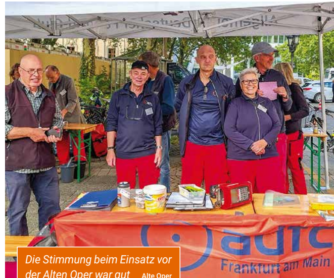
Die Stimmung beim Einsatz vor der Alten Oper war gut Alte Oper

nen in der Alten Oper die Vorstellungen der 5 Konzerte des „grünen Abos“ (am 14. 09. z. B. den Auftritt der Münchner Philharmoniker) und holen nach dem Schlussapplaus ihr Velo wieder ab.