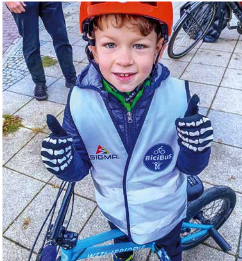
Er findet den gemeinsamen Schulweg mit dem BiciBus super!

Das Projekt bringt das erfolgreiche Konzept des sogenannten BiciBus erstmals in größerem Rahmen an Frankfurter Schulen. Diese nehmen hierbei eine zentrale „Brückenfunktion“ ein: Mit Einbindung der schulischen Strukturen kann sichergestellt werden, dass alle Kinder, unabhängig von Herkunft, Bildungszugang oder familiärem Hintergrund, die Chance auf einen gemeinschaftlichen Schulweg mit dem BiciBus erhalten. Die Initiative BiciBus bringt dabei ihre Expertise und ihr ehrenamtliches Engagement