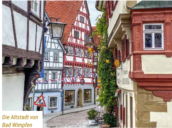
Die Altstadt von Bad Wimpfen