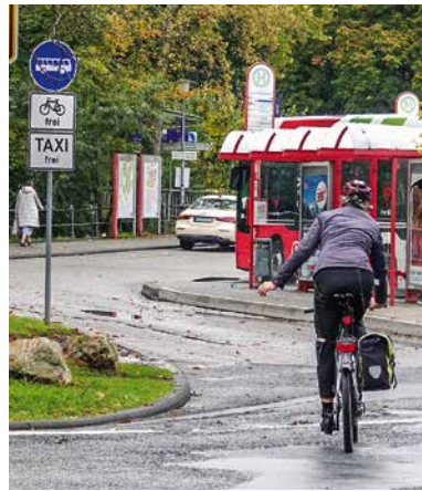
Der Busbahnhof in Hofheim darf jetzt wieder legal befahren werden

Mit der Gotenstraße und der Cheruskerstraße wurden jetzt zwei Einbahnstraßen in Marxheim für den Radverkehr in Gegenrichtung geöffnet. Holger Küst