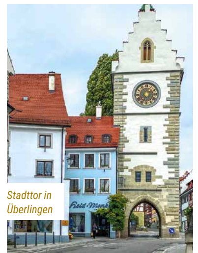
Stadttor in Überlingen