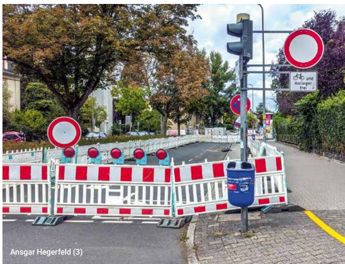
Ansgar Hegerfeld (3)

Zusätzlich zur gesperrten Bockenheimer Landstraße kam es auch auf der Eschersheimer Landstraße zu Behinderungen durch eine Baustelle. Vorbildlich wurde dabei ein Notweg für den Radverkehr wegen der Privatbaustelle eingerichtet. Wie schon in der Vergangenheit für andere Baustellen wurde auch dieses Mal auf dieser Straße ein Fahrstreifen Richtung Norden eingezogen – das automobile Chaos blieb wie immer aus, aus unserer Sicht kann so eine ähnliche Lösung gerne dauerhaft den schmalen Hochbordradweg ablösen.