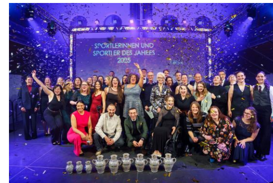
Alle Preisträger:innen feiern gemeinsam im Konfettiregen