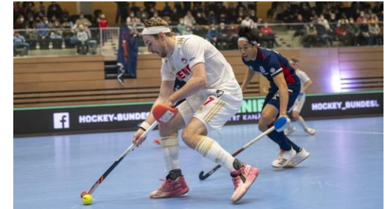
Volvo E.R.B. Final Four: Hallenhockey in der Süwag Energie ARENA