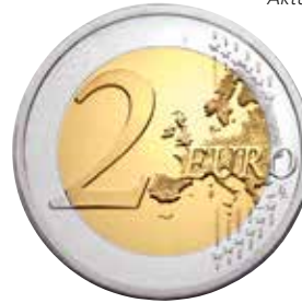
Aktuelle europäische Seite

Die europäische Seite aller acht Euro-Münzwerte (1 Cent bis 2 Euro) ging aus einem Gestaltungswettbewerb unter Federführung der EU-Kommission hervor. Der Sieger, Luc Luycx aus Belgien, wird auf den Münzen durch seine Initialen „LL“ gewürdigt.