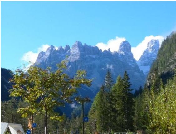
Landschaftlich bot die Vereinsfahrt einmal mehr wunderbare Ausblicke

Der 3. Reisetag führte nach einem ausgiebigen und kräftigen Frühstück nach Meran. Die wunderschöne Stadt liegt inmitten eines Tal-