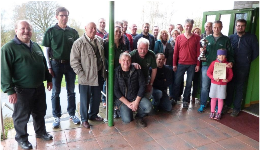
Sieger und Teilnehmer des diesjährigen Ortspokalschießens nach der Siegerehrung