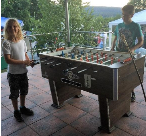
Der Tischkicker kam bei den Jugendlichen gut an

Am Samstag den 27. August 2016 fand im Ernsthäuser Schützenhaus der diesjährige Familientag mit Königsschießen statt. Der Jugendtag startet mit einem Festzug durch ganz Ernsthausen der hoch zum Schützenhaus führte. Es war ein sehr warmer, sonniger Tag. Nach dem Schützenumzug, der vom Musikzug Bottendorf begleitet wurde, kamen alle