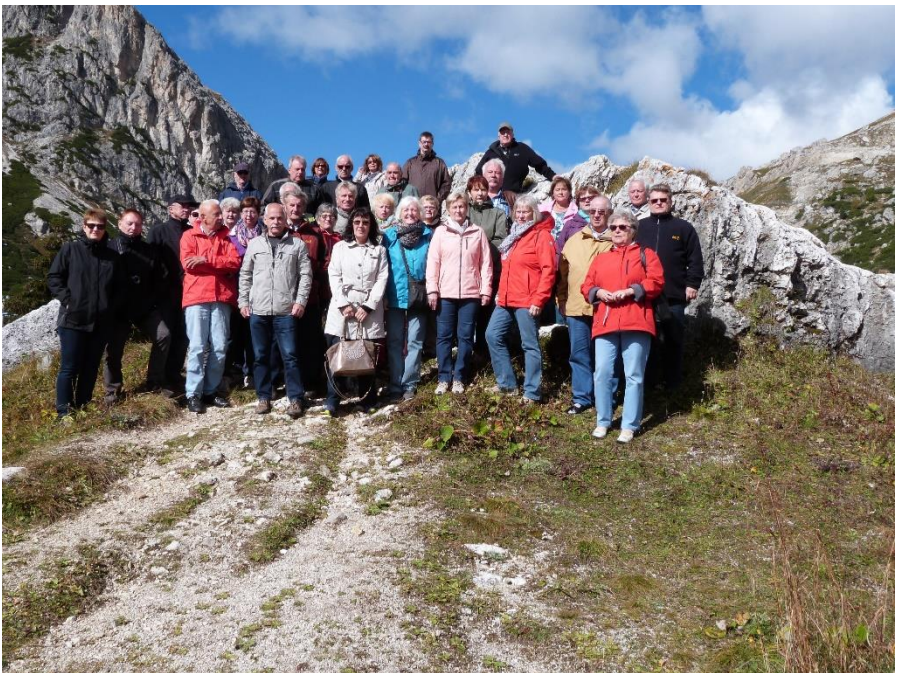
Die Reisegruppe bei einem Halt am höchsten Punkt der Dolomitenrundfahrt

Der 5. Reisetag war schon das Ende der diesjährigen Vereinsfahrt und endete nach einer staufreien Rückfahrt, und nach einem gemütlichen, gemeinsamen Abendessen in Alsfeld-Eutorf, auf dem Heimatparkplatz.