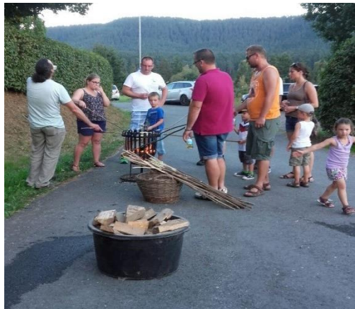
Jung und Alt erfreuten sich am Stockbrot

Das Besondere am diesjährigen Jugendtag war allerdings, dass die Freiwillige Feuerwehr vor Ort war und den Jugendlichen viel über Erste-Hilfe beigebracht hat,