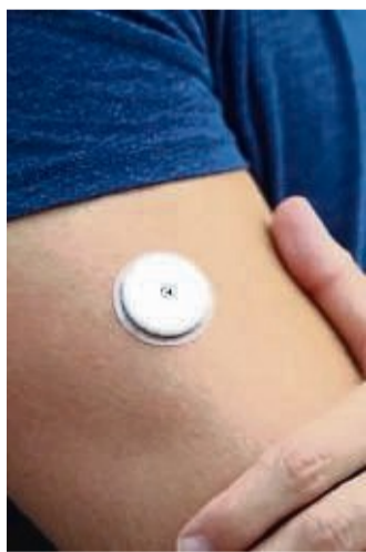
Weltdiabetestag 2021: Bis 2045 wird sich die Zahl der Zuckerkranken fast verdoppeln.

W eltweit gab es 2019 rund 469 Millionen an Diabetes erkrankte Erwachsene. Und die Zahl der Betroffenen wird sich bis 2045 fast verdoppeln. Man sollte die umgangssprachliche „Zuckerkrankheit“ also in jedem Fall ernst nehmen. Allerdings zeigt eine bevölkerungsrepräsentative Studie des digitalen Versicherungsmanagers Clark, dass nicht einmal jeder zehnte Deutsche (8 Prozent) Vorsorgeuntersuchungen zur Diabetes-Früherkennung durchführt. Anlässlich des Weltdiabetestags am 14. November informiert Clark über die beunruhigende Zunahme betroffener Jugendlicher und zeigt auf, wie man das persönliche Risiko einer Erkrankung mindern kann.