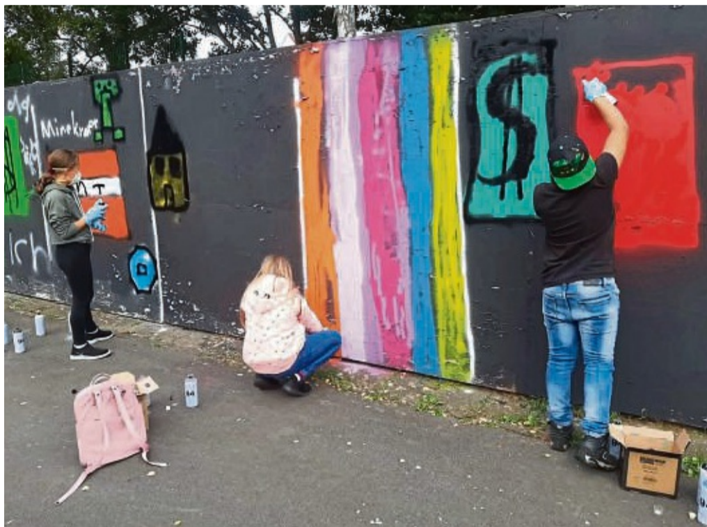
Legale Sprühfläche: Die Stadt hofft, dadurch illegale Graffiti auf privaten oder öffentlichen Gebäuden noch weiter reduzieren zu können.