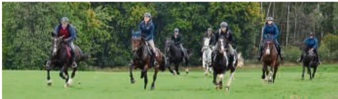
Gelungener Herbstausritt mit den heidereitern in Waldeck.

Waldeck - Die Waldecker Heidereiter hatten zu einem Ausritt geladen und weil die Hubertusjagden des Reitervereins Waldeck nicht mehr stattfanden, schloss sich der Verein an. Mehr als 20 Reiter kamen zusammen. Eine Galoppgruppe und eine Schrittgruppe waren dabei unterwegs. Die galoppierende Gruppe wurde dabei von den Waldecker Jagdhornbläsern