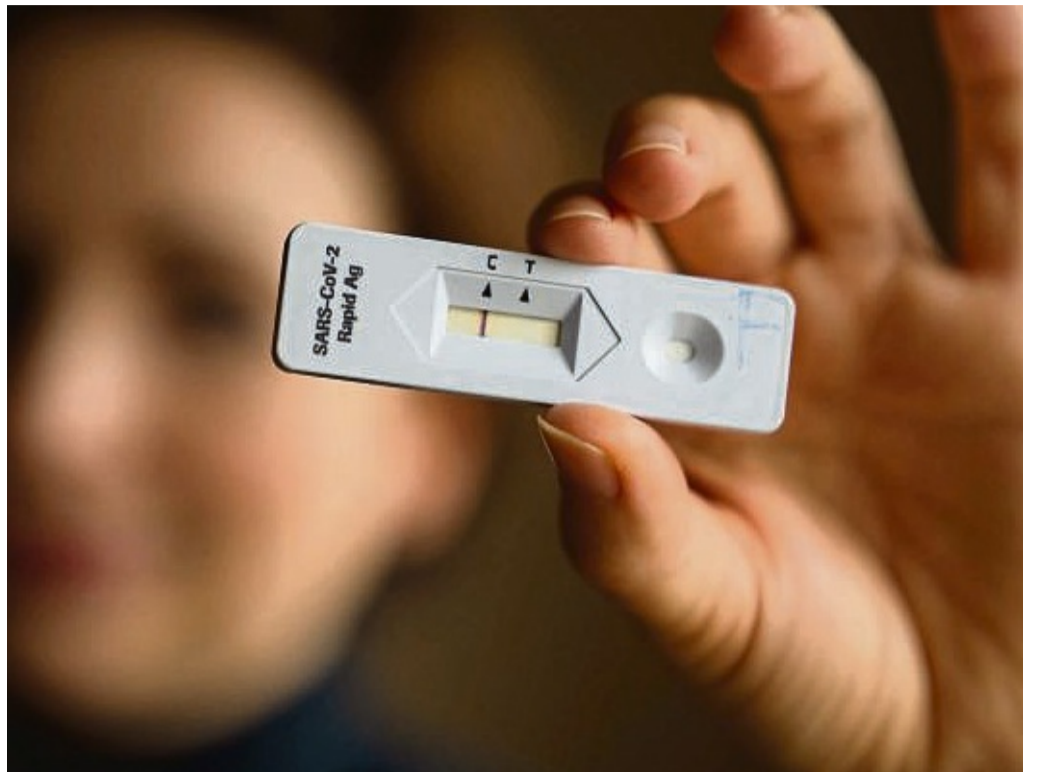
Corona-Testzertifikate akzeptiert das Korbacher Goldbad nur von offiziellen Teststellen. Dokumente aus dem Internet werden abgelehnt.

Die zuständige Hamburger Sozialbehörde stellte allerdings klar, dass die Nachweise der Firma nicht im Rahmen der 3G-Regel genutzt werden können. Wer sich nicht ordnungsgemäß an einer Teststelle testen lässt und nicht geimpft oder genesen