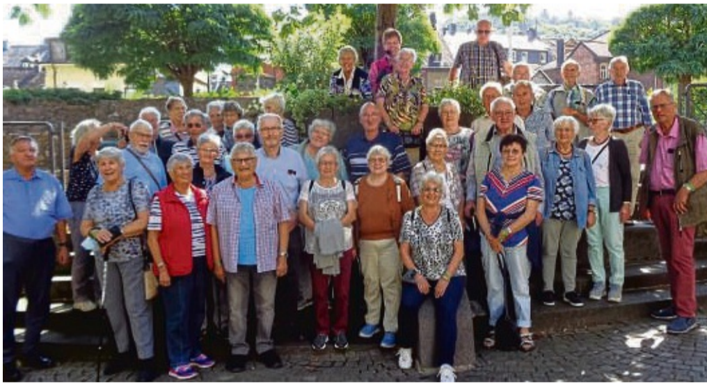
Die Waldecker Landsenioren unternahmen eine abwechslungsreiche, mehrtägige Herbstfahrt an die Mosel.