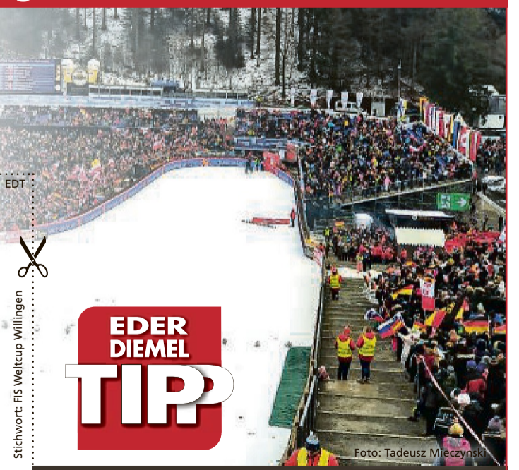
Stichwort: FIS Weltcup Willingen