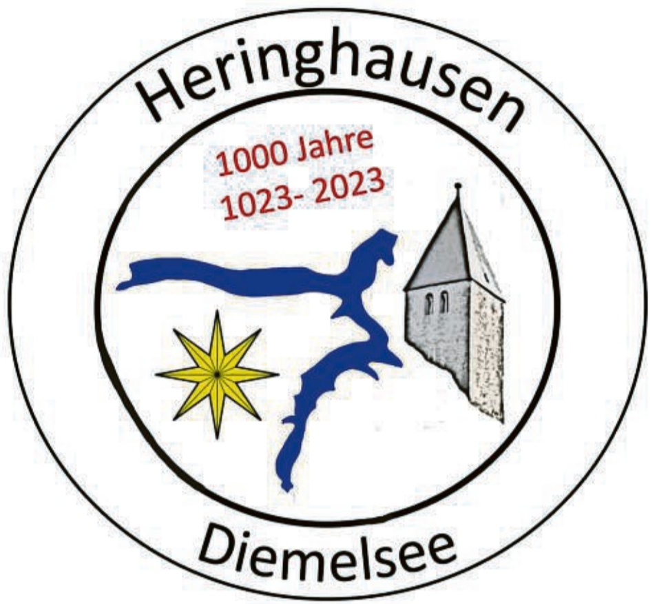
Vorbereitungen aufs Dorfjubiläum: das Logo für die 1000-Jahr-Feier in Heringhausen im Mai 2023.

Auch ein Logo fürs Dorfjubiläum liegt schon vor, es zeigt den abgewandelten Waldecker Stern, den Diemelsee und den Turm der romanischen Barbara-Kirche.