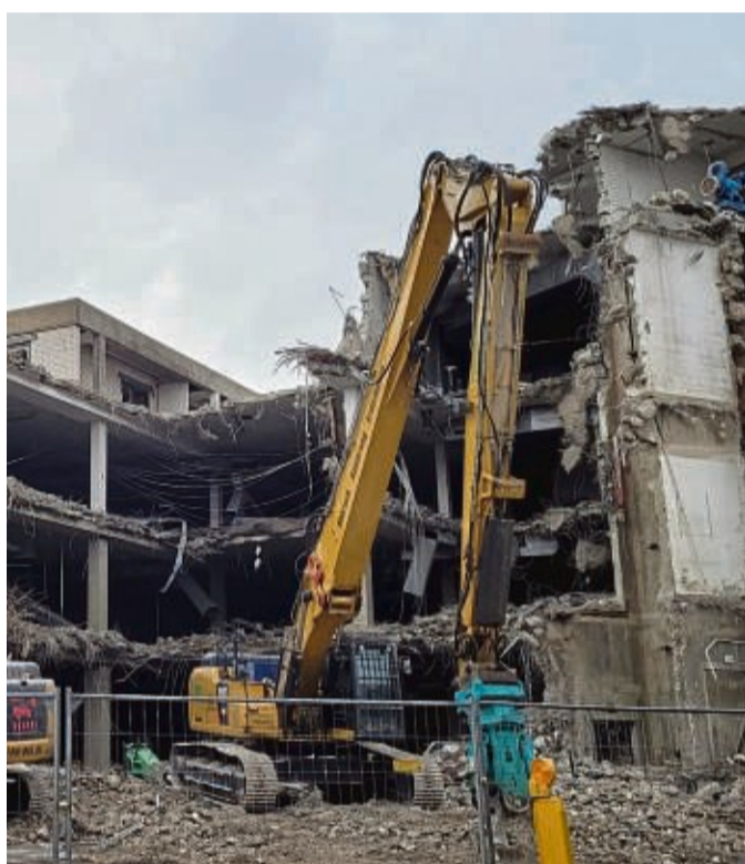
Rund 50 Jahre nach dem Bau wird der Woolworth-Komplex wieder abgerissen. Hier ein Blick aus Richtung Arolser Landstraße.

Korbach – Gleich mehrere Bagger zerlegen nach und nach den alten Woolworth-Komplex und reißen die Mauern und Wände des Gebäudes in der Innenstadt ab. Ein stetes Hämmern und Pressen dröhnt bis in die umliegenden Straßen. Das Kaufhaus war in den Jahren 1968 und 1975 auf dem Grundstück in der Bahnhofstraße errichtet worden. Der Architekt Herbert Kuhaupt erinnert sich an die Anfänge dieses stadtbildprägenden Gebäudes und die Bedeutung des Woolworth-Kaufhauses.