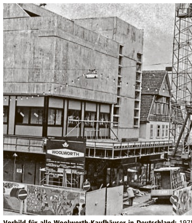
Vorbild für alle Woolworth-Kaufhäuser in Deutschland: 1975 wird die Filiale in der Korbacher Bahnhofstraße umgebaut und vergrößert. Ein Jahr später öffnet das erste Kaufhaus mit Rolltreppe in Korbach.

Vor 53 stand auf dem Grundstück in der Bahnhofstraße das Tabakwarengeschäft der Geschwister Reinhard und Anna Becker. Direkte Nachbarn in Richtung Hauptbahnhof waren das Textilhaus Wenzel, das früher der angesehenen jüdischen Familie Stahl gehörte, und der Lebensmittelgroßhandel Neuhaus; gegenüberliegend war die Werkstatt von Opel Schmalz ansässig.