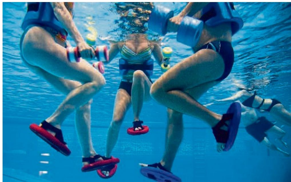
Entlastung dank Auftrieb: Im Wasser trainiert man nur mit einem Bruchteil des eigenen Körpergewichts.