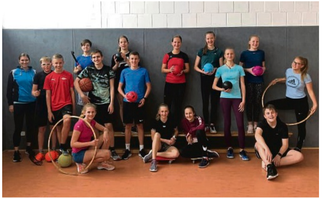
Schul- und Vereinssport bereichern sollen die Uplandschüler nach der Sporthelferausbildung.

Mitzubringen sind die Versicherungskarte und der Impfausweis. Für die Erst- und Zweitimpfungen sind zudem die Einwilligungserklärung, der Anamnesebogen und das Aufklärungsmerkblatt ausgefüllt mitzubringen.