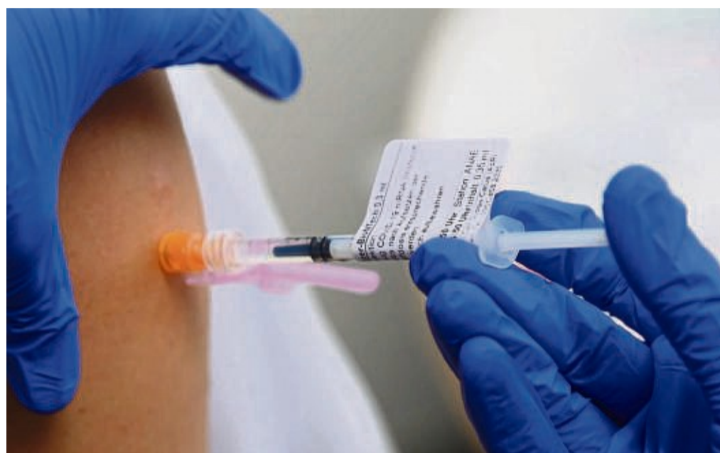
An fünf Impfstützpunkten gibt es Erst-, Zweit- und Booster-Impfungen.

Angesichts der sich weiter verschärfenden Corona-Lage in Waldeck-Frankenberg ruft der Landkreis auch dazu auf, Weihnachtsmärkte, Feiern und Versammlungen abzusagen. Die 7-Tage-Inzidenz in Waldeck-Frankenberg lag am