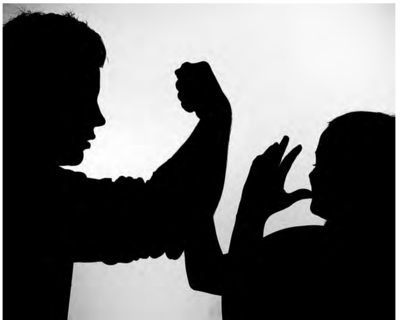
Anklage wegen versuchten Heimtückemordes: Ein 26-Jähriger muss sich vor Gericht verantworten.

Zwei Beamte begleiteten sie dann zurück in die Wohnung, wo sie Sachen für einen Klinikaufenthalt packen wollte. Als sie im Schlafzimmer packte, sprang plötzlich der Angeklagte aus dem Klei-