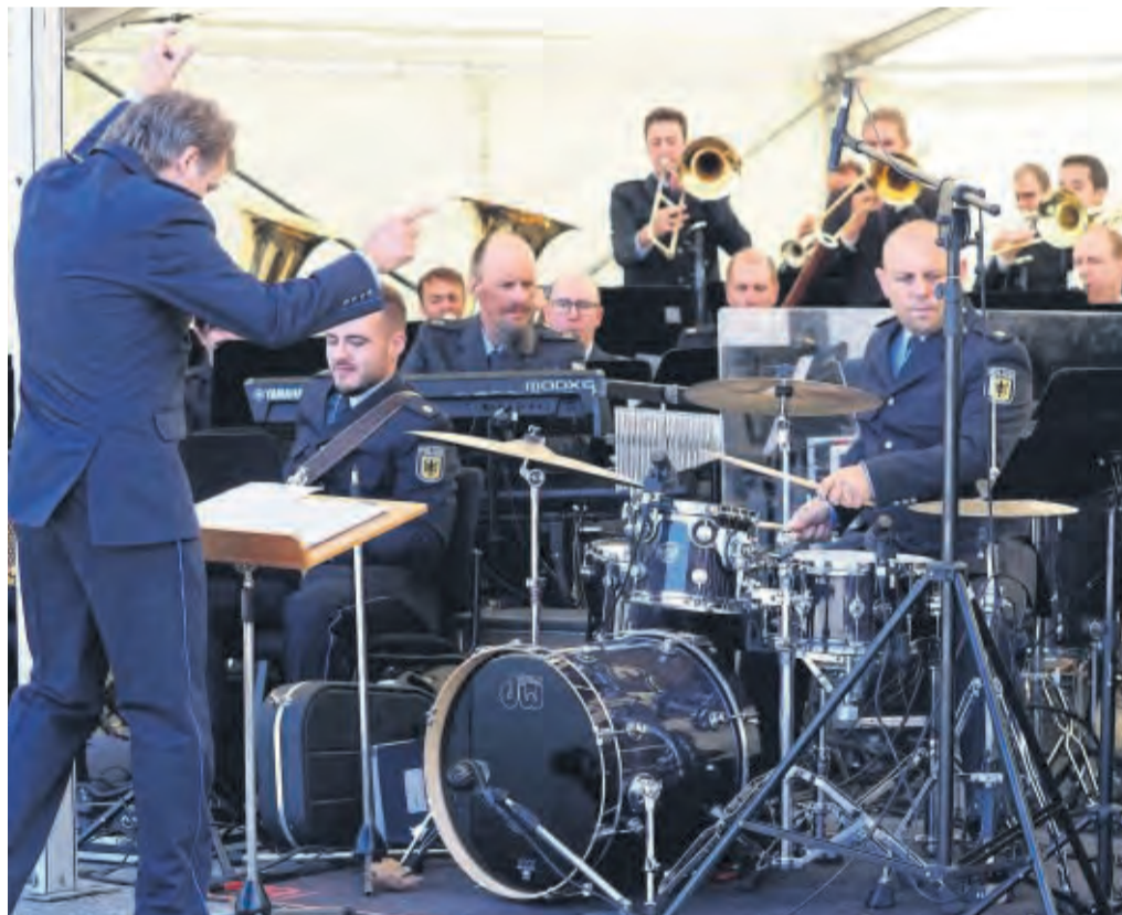
Für das musikalische Rahmenprogramm sorgte das Polizeiorchester Hannover.