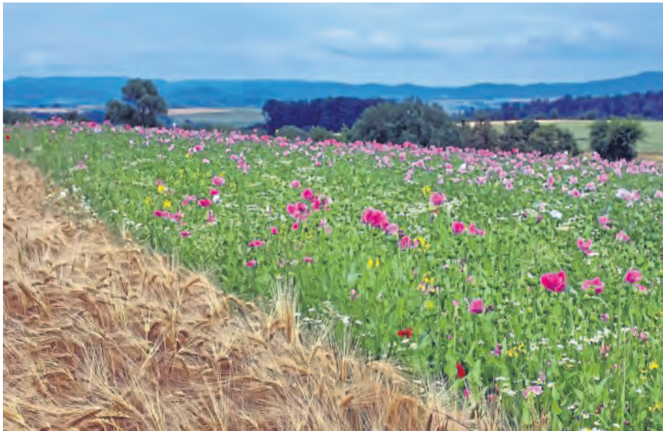
Allein die diesjährige Mohn-ernte fiel 40 Prozent geringer aus. Auch das Getreide litt unter den Wetterverhältnissen.

Das bedeutet, dass Betriebe im vergangenen Jahr Pachtleistungen erbringen mussten, die um ein Drittel höher waren als noch vor zehn Jahren, schreibt Jörg Führer vom Statistischen Landesamt. Das gleiche gilt auch für den Werra-Meißner-Kreis. Lag der Pachtpreis hier 2007 noch bei durchschnittlich 131 Euro pro Hektar, mussten Landwirte im vergangenen Jahr bereits 187 Euro zahlen. Im