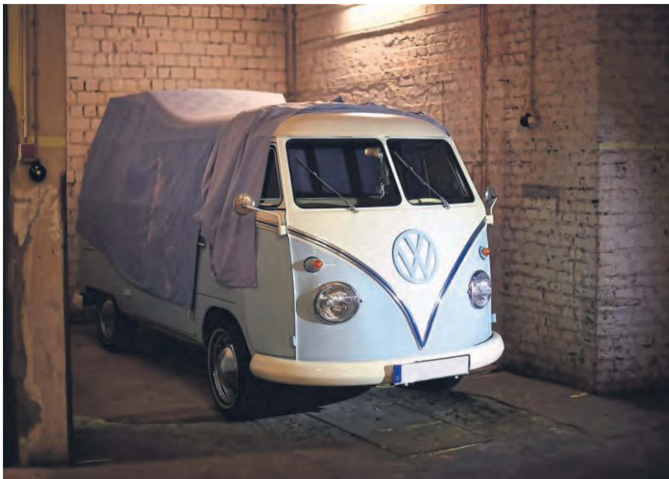
Schlaf gut: Viele Oldie-Besitzer motten ihren vierradrigen Liebling über den Winter ein - vorher beachten sie besser aber ein paar Dinge.

Vor dem Abstellen ist eine gründliche Außenreinigung mit anschließender Trocknung angesagt. Verschmutzungen könnten ansonsten bei langer Standzeit Lackschäden verursachen. Stein- und Schlagschäden dringend be-