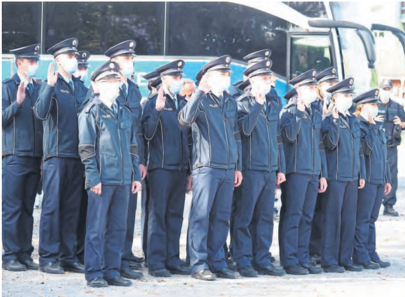
Amtseid auf dem Werdchen: 256 junge Menschen beginnen ihre Laufbahn beim Bundespolizei- und Fortbildungszentrum in Eschwege ab.

„Lockerheit passt zur Bundespolizei“, sagte Aigner, der sich sorgte, dass seinen Schützlingen der Kreislauf versage. Allerdings, zu locker soll es auch nicht zugehen im Dienst als Polizist und Polizistin, machte er klar. Die angehenden Beamten stellten sich in den Dienst des Landes – „mit Haut und Haar“ – und schützten alle Menschen, die darin leben, das habe mit Haltung zu tun.