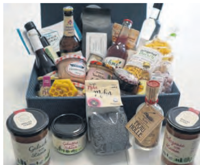
Regionale Vielfalt in einer Box: Dieses Jahr kann erstmals die lokale Weihnachtsbox unter dem Tannenbaum liegen.