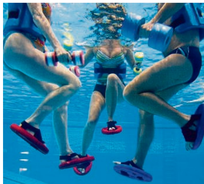
Entlastung dank Auftrieb: Im Wasser trainiert man nur mit einem Bruchteil des eigenen Körpergewichts.

Gleichzeitig bietet Aquajogging ein extrem vielseitiges Training, das Kraft und Ausdauer fördert und nicht nur die Beine, sondern auch Arme, Schultern und Rücken