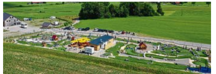
Die Freizeitanlage ist ein beliebtes Ausflugsziel für die ganze Familie.

Wer den Spaß beim Minigolf mit dem sportlichen Anreiz des klassischen Golfspiels kombinieren will, findet beim Adventure-Golf spannende Herausforderungen. Die Trendsportart lockt Fans aller Altersklassen auf die fantasievoll gestalteten Naturbahnen. Im Adventure-Golfpark in Ottobeuren sorgen beispielsweise 18 Bahnen auf 3000 Quadratmetern für großen Spaß. In Sichtweite der berühmten Barock-Basilika stellen Bäche, Brücken, Tunnel und Sandbunker die Spieler vor knifflige Aufga-