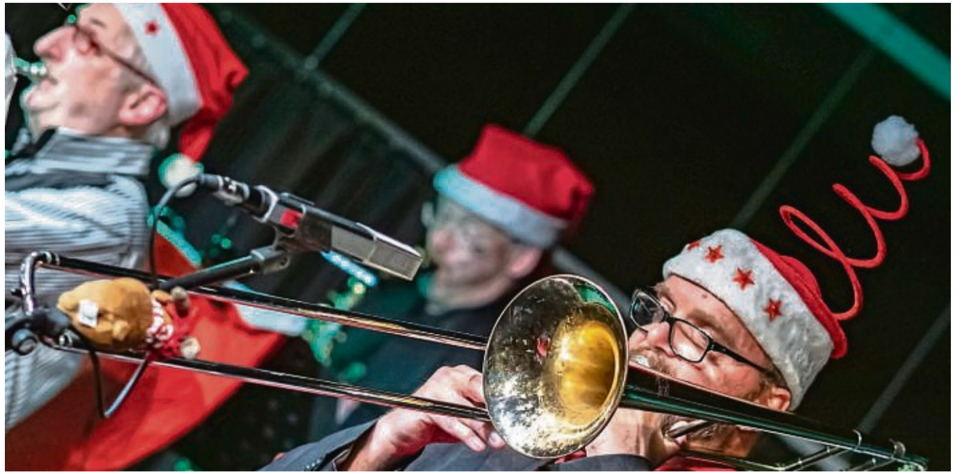
Das „United Brass & Rock Ensemble“ kommt nach Eschwege: Der Jazz-Club hat die Band aus dem Raum Hersfeld/Fulda zum Weihnachtsmarkt eingeladen. Sie wollen mit neuen Interpretationen auf's Fest einstimmen.

Für die Konzerte gilt: Beginn: 20 Uhr im E-Werk Eschwege, Einlass: 19.30 Uhr. Tickets kosten 17 Euro im Vorverkauf, 18 Euro an der Abendkasse, Club-Mitglieder und Studenten zahlen 12 Euro, Jugendliche unter 18: freier Eintritt. Die beiden Sonderkonzerte kosten 24 Euro im Vorverkauf, 25 Euro an der Abendkasse und 15 Euro ermäßigt.