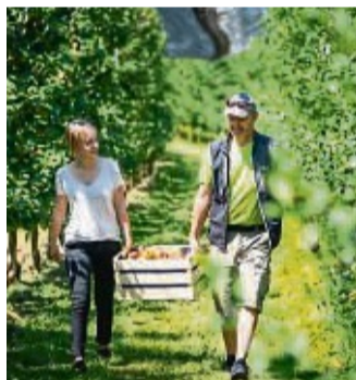
Im Herbst bricht in Obst- und Weingegenden eine besonders genussvolle (Urlaubs-) Zeit an.

In sonnenverwöhnten Gegenden wie der Region rund um den Bodensee beginnt im Herbst die Hochsaison der Genießer. Das fast mediterrane Klima an Deutschlands größtem Binnensee bietet nicht nur beste Bedingungen für den Obst- und Weinbau, sondern auch für Outdoor-Sportler.