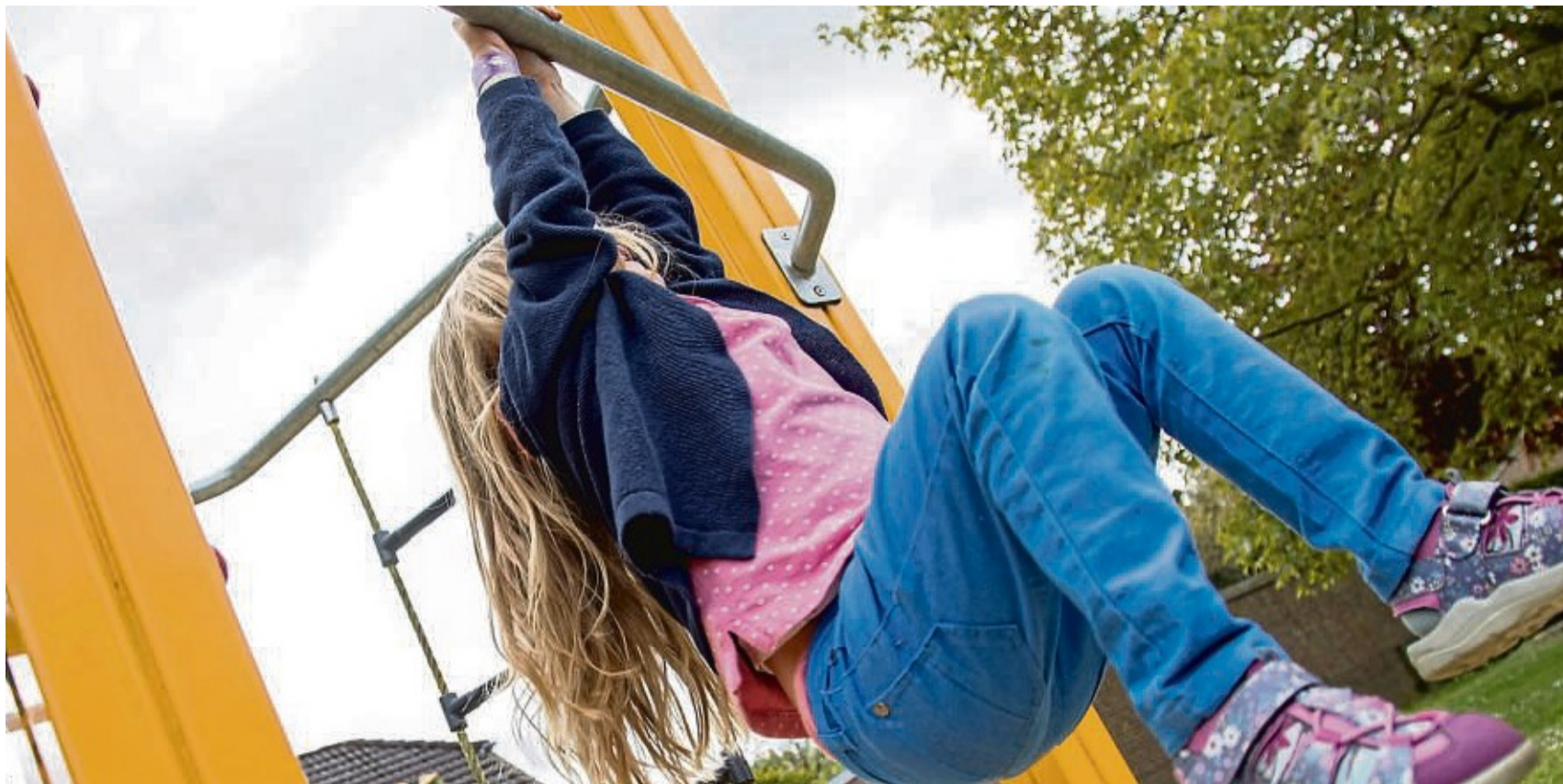
Ab auf den Spielplatz! Kindergartenkinder sollten sich drei Stunden am Tag bewegen.

Und nie vergessen: Kinder freuen sich vor allem über Lob und Anerkennung und