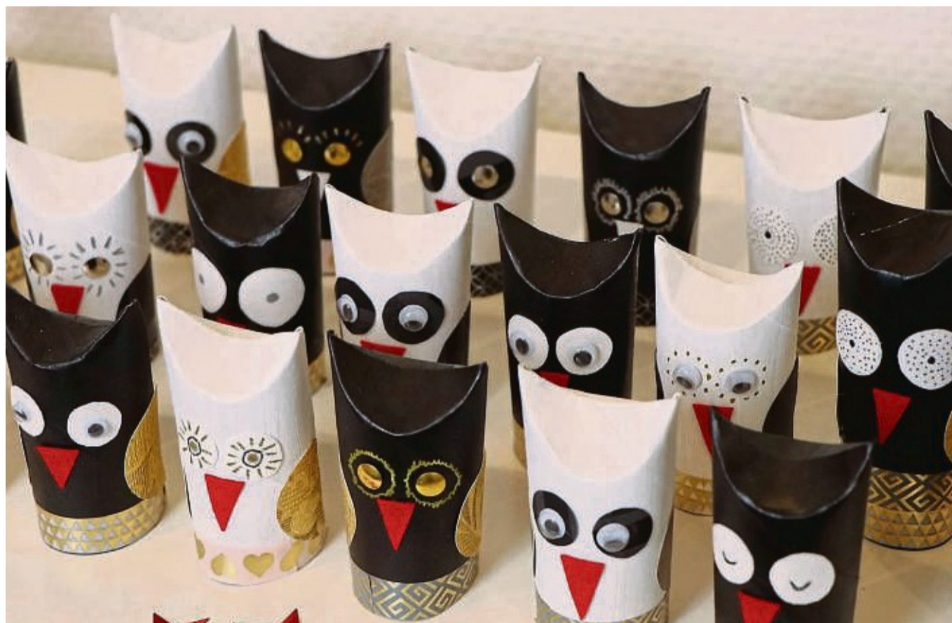
Leere Klopapier- oder halbierte Küchenpapierrollen sind ebenfalls ideal für selbst gebastelte Adventskalender. Wer nicht genug hat, lässt Freunde und Kollegen mitsammeln.

Gar nicht groß rumstehen müssen schwebende Adventskalender aus alten Pappbechern. „Sie schweben als Mobile an Wollfäden von der Decke oder Lampe, werden bunt beklebt und von 1