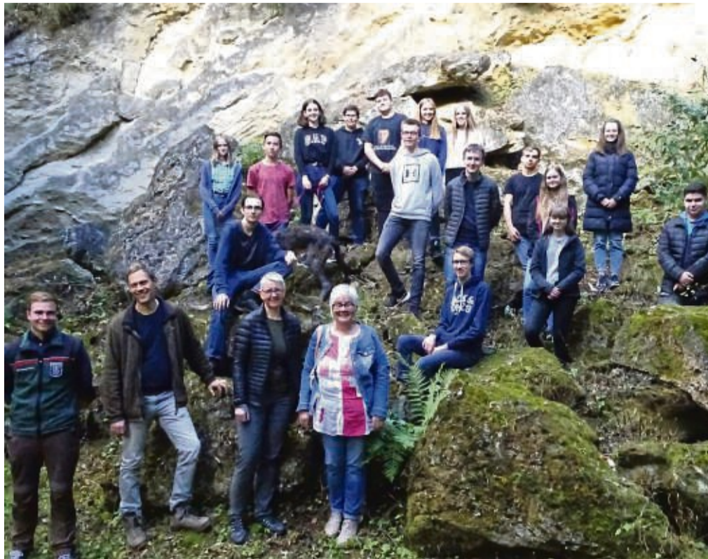
Klippenpfad: Schüler der Adam-von-Trott-Schule haben ein zugewachsenes Gelände in Sontra umgestaltet.