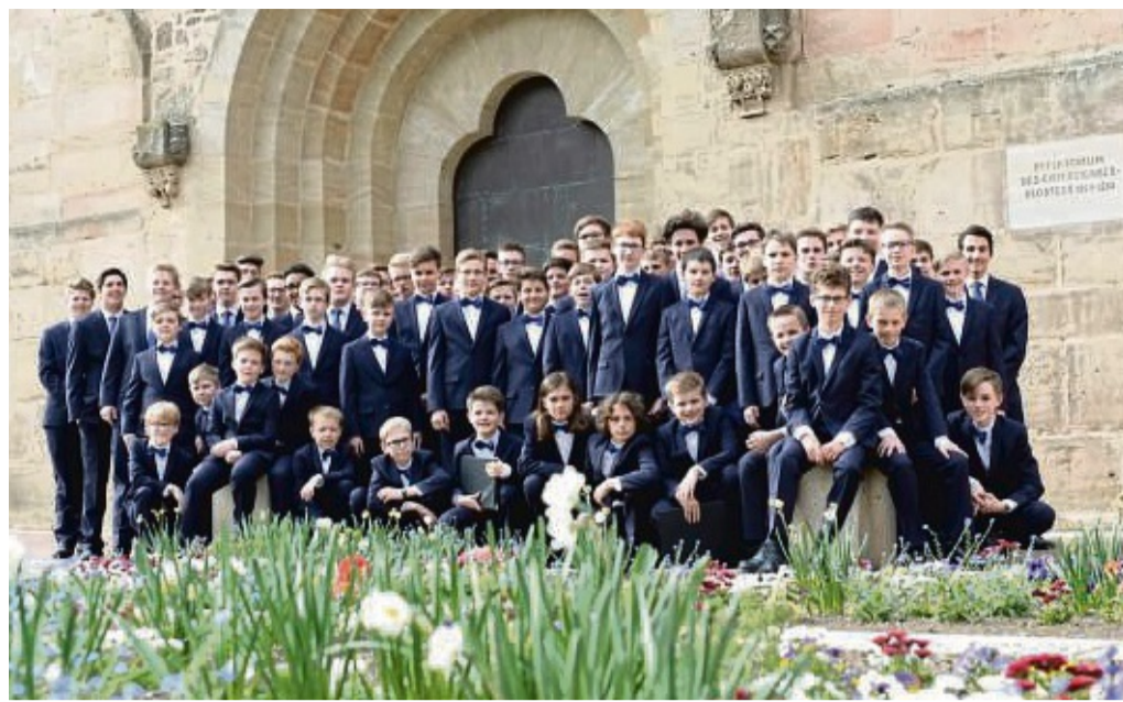
Zählt zur Spitze der deutschen Knabenchöre: Der Windsbacher Knabenchor gibt am Samstag, 27. November, ein Konzert in der Bad Sooden-Allendorfer St.-Crucis-Kirche.

Nur ein Drittel hätte die Tests zahlen müssen, zwei Drittel seien – etwa für Schüler – weiter kostenfrei gewesen. fst/hbk/jes