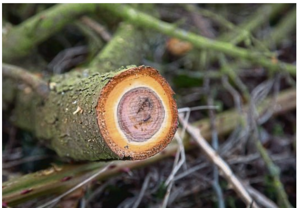
Wann eine Pflanze zurückgeschnitten wird, hat Einfluss auf ihre Entwicklung.