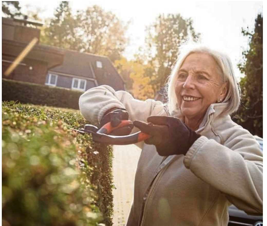
Nach dem Bundesnaturschutzgesetz ist es von Anfang Oktober bis Ende Februar erlaubt, Hecken, lebende Zäune und andere Gehölze stärker zu schneiden.