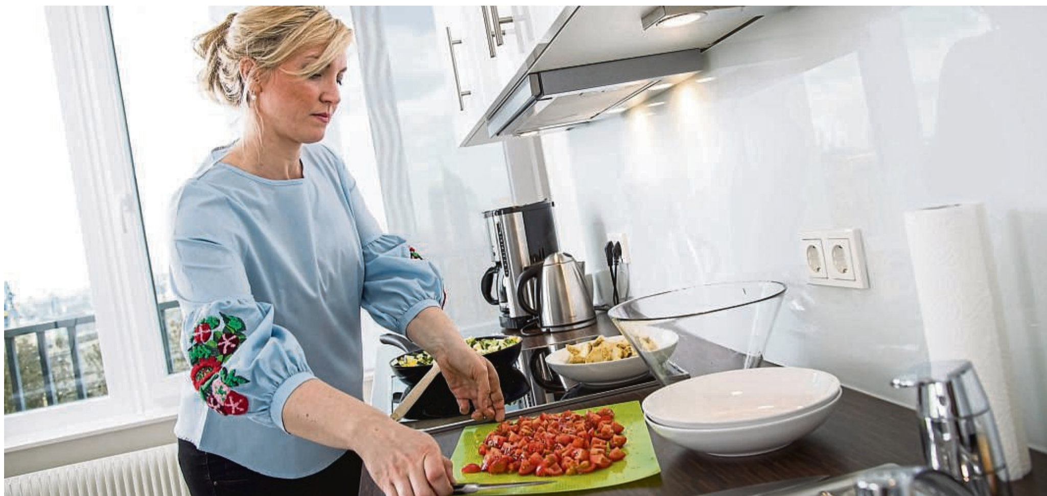
Was bekommt mir wann am besten? Ernährungspläne auf der Basis von DNA-Analysen sollen Antworten liefern.