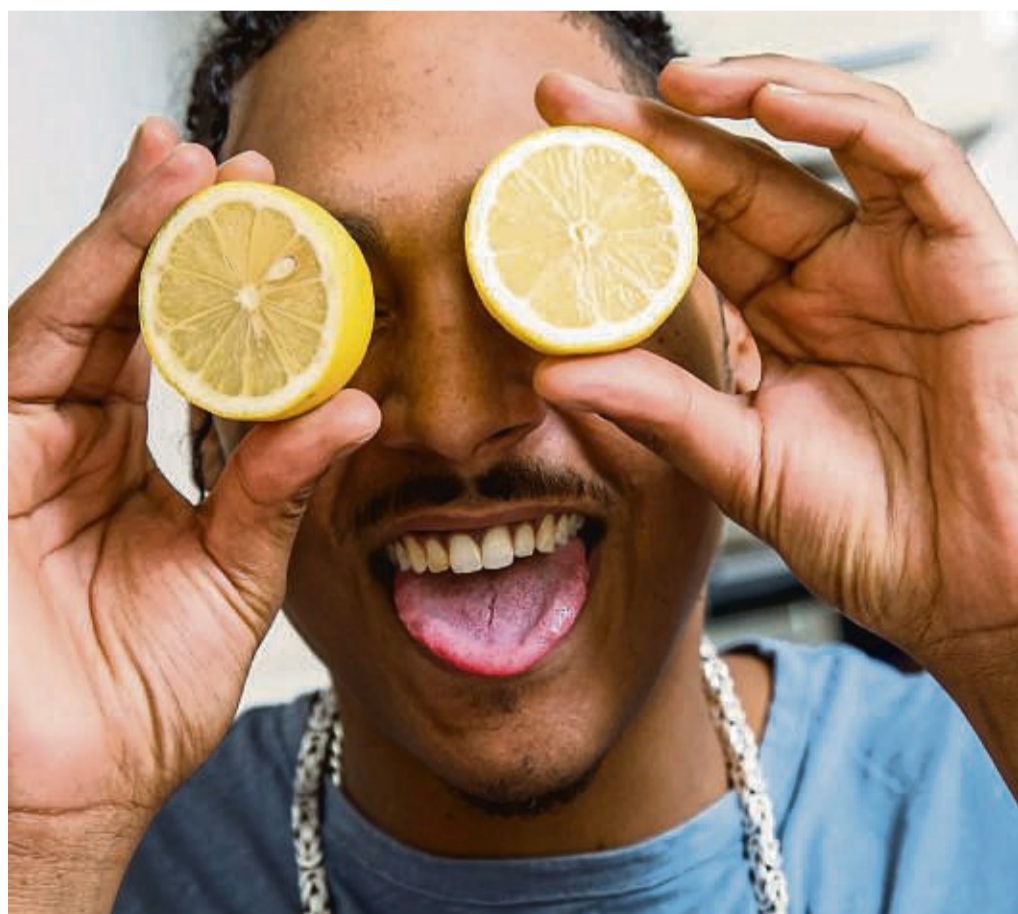
Gut geht's mir! Stoffwechselanalysen sollen einem verraten, aus welcher Kombination von Lebensmitteln der Körper am meisten für sich herauszieht.