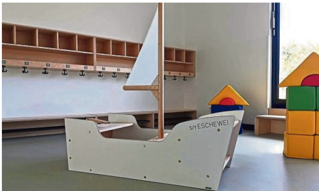
Kostenexplosion: Aufwendungen für Kinderbetreuung haben sich in zehn Jahren vervierfacht.