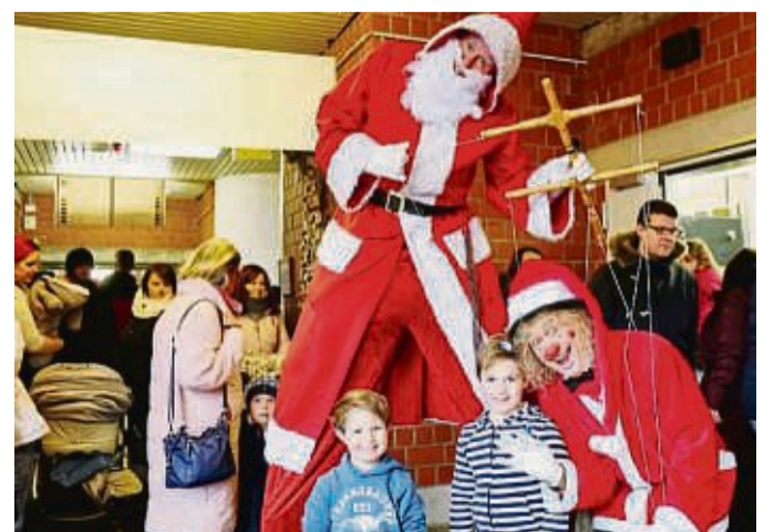
Kinderlachen, Attraktionen, Zusammenkommen: Das wünscht sich die Werraland-Familie fürs nächste Jahr wieder.