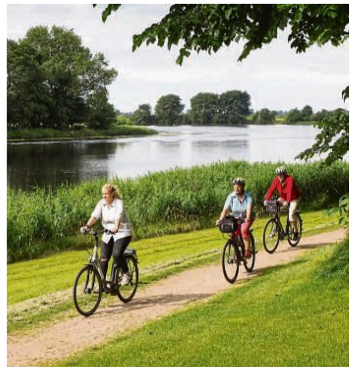
Entlang der Eider können Naturliebhaber abseits des Straßenverkehrs die Ruhe des Geest- und Marschlandes genießen.

Herrlicher Naturgenuss, authentische Land- und Kultur-erlebnisse und abwechslungsreiche Landschaft: Im Binnenland Schleswig-Holstein kommen Familien, Entspannungssuchende, Fahrradfans und Kulturliebhaber auf ihre Kosten. Entdecker dürfen sich auf Unterkünfte, die auf ihre Bedürfnisse spezialisiert sind, in unmittelbarer Nähe aufregender Ausflugsziele freuen. Infos zu den Angeboten gibt es unter binnenland.sh . In den neun Mini-Radreise-regionen übernachten Gäste in einer fahrradfreundlichen Unterkunft, um von dort aus die Kultur- und Naturschätze zu entdecken. Quartiere der zwei „binn' natürlich“-Natur-Entdeckerregionen liegen in der Nähe von reizvollen Naturparks, Naturerlebnisräumen und haben ihr Angebot auf Naturliebhaber ausgerichtet.