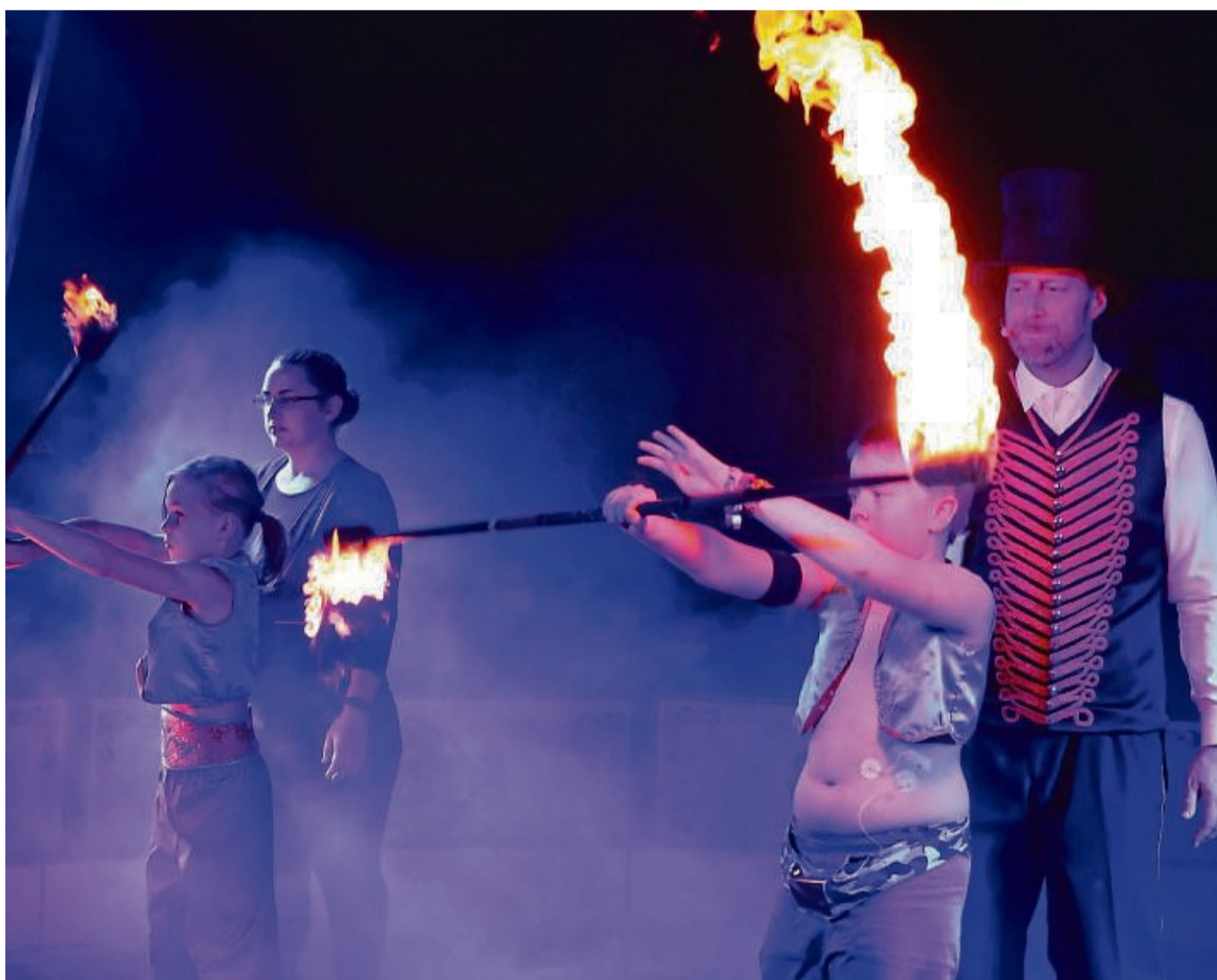
Selbst Feuer hatten die Grundschüler unter fachkundiger Anleitung im Griff.

Nach dem Aufbau des Zirkuszeltens am Sonntag, an dem sich fast 70 Eltern beteiligten, übten die Kinder am Montag und Dienstag ihre Darbietungen ein, hatten je nach Gruppe am Mittwoch