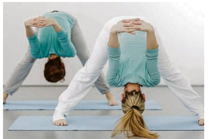
Ganz schön beweglich: Yoga kann körperlich fordernd sein.