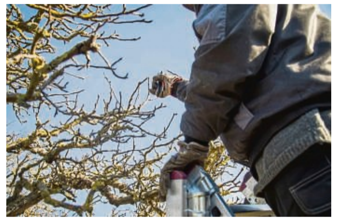
Die einen tun es noch im Herbst, die anderen im Winter. Mancher schwört auch auf das Frühjahr für den Gehölzschnitt.

Aber: „Doch dass Gehölze überhaupt geschnitten werden müssen, ist ein riesiger Irrglaube. In der Natur gibt es niemanden, der das tut, und trotzdem geht es ihnen gut“, so Sandt. „Mit Zierkirsche, Magnolie, Ahorn und vielen anderen gibt es eine große