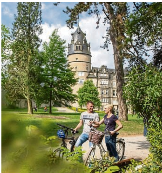
Das Fürstliche Residenzschloss ist ein Juwel im Stil der Weserrenaissance und liegt im Herzen der Kulturstadt Detmold.

Raus in die Natur? Gemütlich entlang von Flüssen oder hoch hinauf auf die Bergkämme? Ebenso vielfältig wie die Landschaften und Kulturschätze der Radregion Teutoburger Wald sind auch die Tourenmöglichkeiten. Jede Menge Spaß versprechen etwa die acht neuen Bielefelder Themenrouten wie die City-Tour „Um'n Pudding“ oder die „Engelroute“, die Radler an 20 Bauernhöfen mit Engeltorbögen vorbeiführt. Grüne Oasen und klösterliche Spiritualität stehen wiederum im Mittelpunkt der Kloster-Garten-Route im Kulturland Kreis Höxter. Auf der Fürstenroute Lippe im Land des Hermann gibt es prächtige Adelsitze zu entdecken, beispielsweise das Fürstliche Residenzschloss im Herzen Detmolds. Informationen und Routentipps finden unter teutoburgerwald.de/radregion