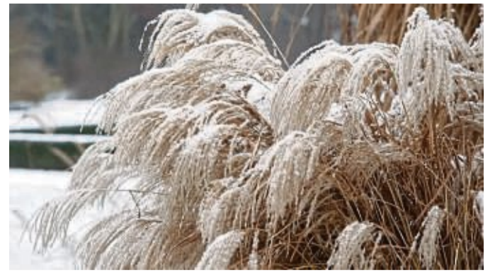
Gräser wie das Chinaschilf sind mit Schnee bedeckt ein schöner Hingucker im Garten.