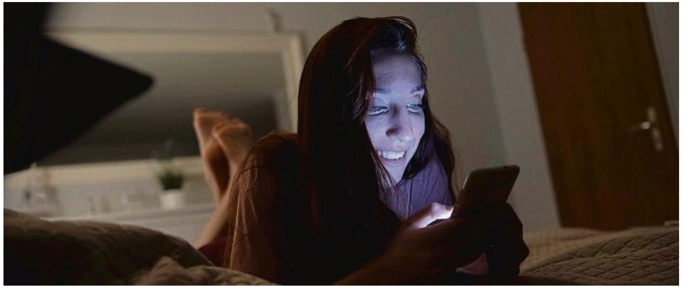
Hängengeblieben am Smartphone: Ihre freie Zeit am Abend verbringen viele vor dem Bildschirm.

Denn Schlafaufschieberitis münde rasch in einem Schlafmangel, mit dem nicht zu spaßen sei, sagt Wiater. Dass zu wenig Schlaf der Konzentrations- und Leistungsfähigkeit einen ordentlichen Knick verpasst, wissen die meisten aus eigener Erfahrung. „Auch das Risiko für