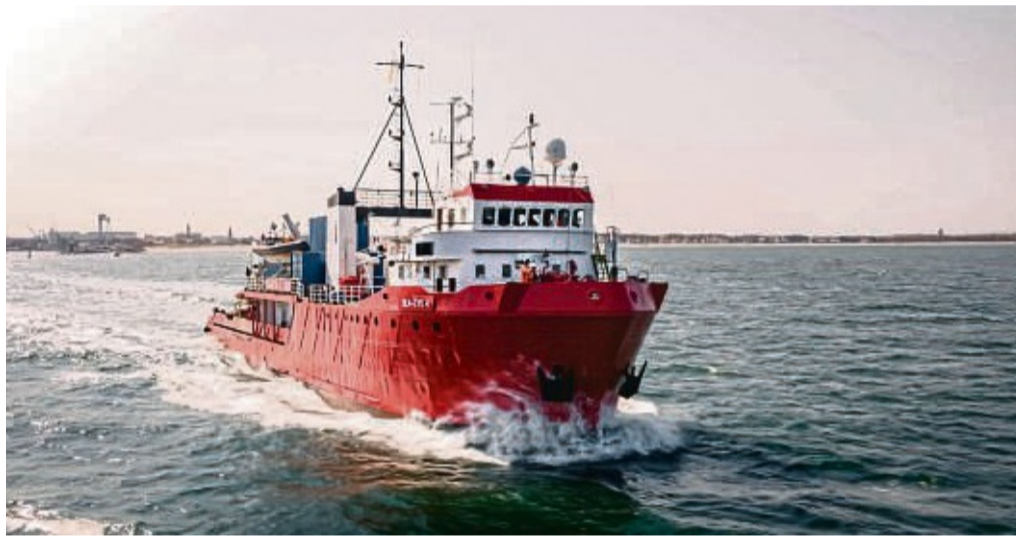
Das Rettungsschiff Sea-Eye 4 wird in den kommenden zwei Jahren vom Werra-Meißner-Kreis finanziell unterstützt.