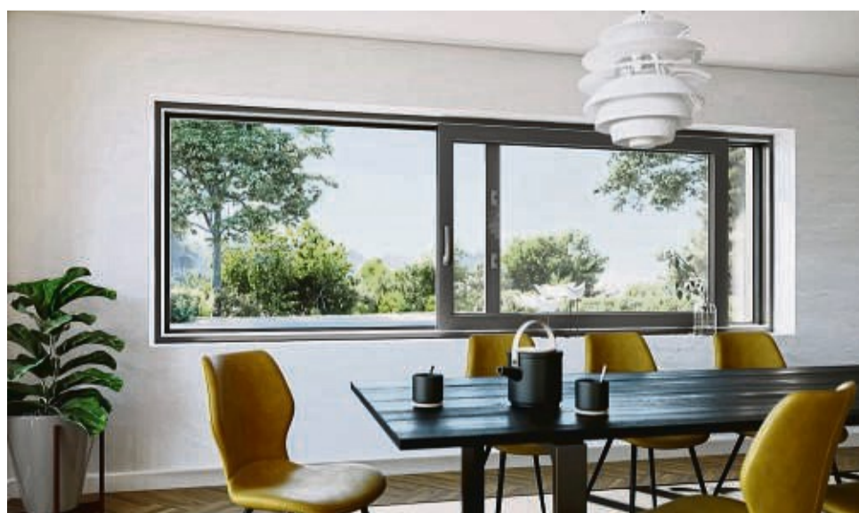
Optisch ansprechend und praktisch: Bei Schiebefenstern kann sich niemand an einem in den Wohnraum hineinragenden Flügel den Kopf stoßen.