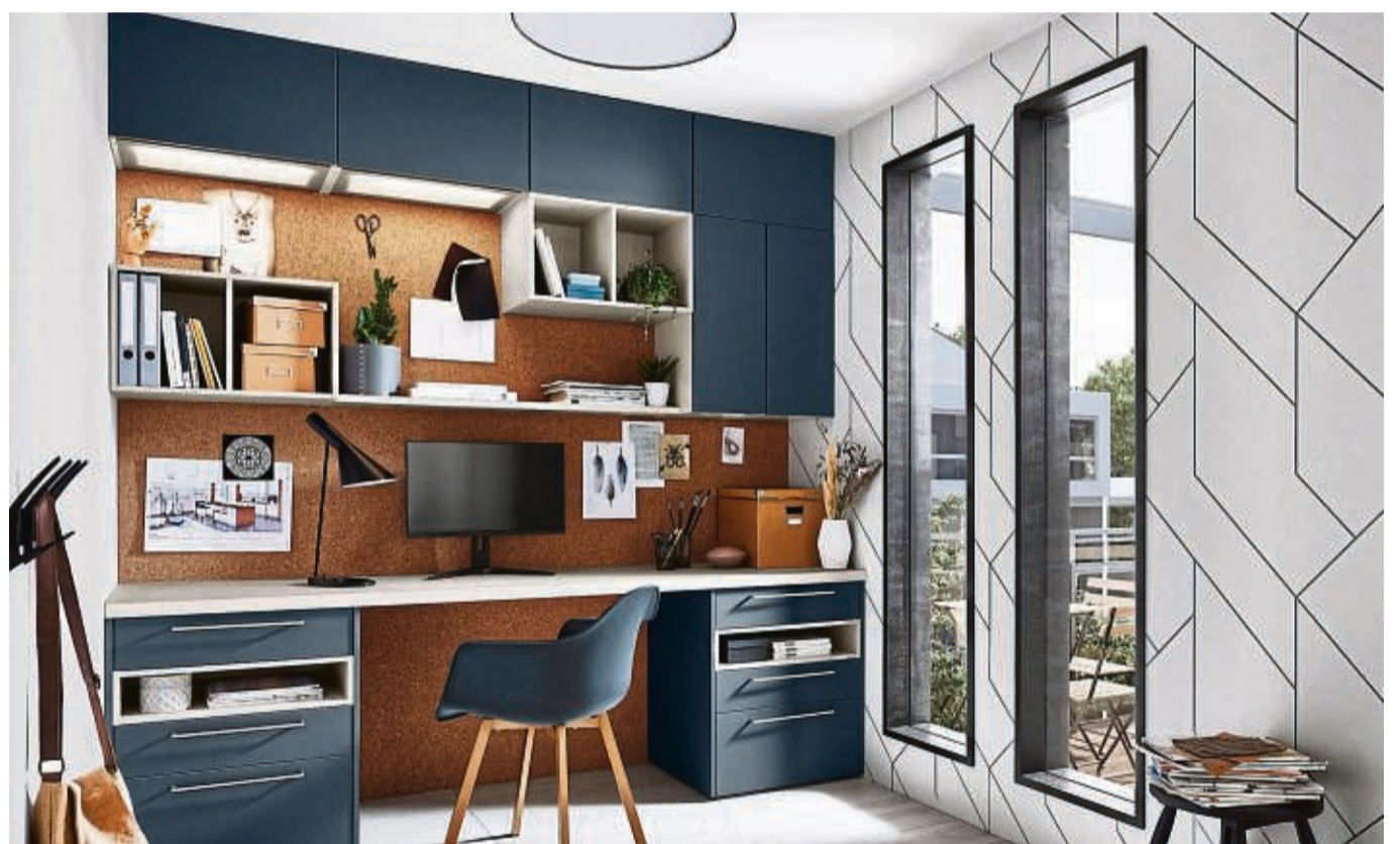
Mit Küchenmöbeln lässt sich auch eine Arbeitsnische mit viel Stauraum einrichten.

Diese Ideen der Branche sind recht neu, lassen sich aber meist mit den bestehenden Küchenelementen im Handel umsetzen. Ein paar Beispiele: Man kann die Arbeitsplatte einer Küchenzeile seitlich über die Unterschränke hinaus verlängern und schafft so eine integrierte Schreibtischplatte. Wer eine große Küche neu plant, kann auch in der Zeile selbst auf ein, zwei Unterschränke verzichten und erhält so Fußraum für einen Stuhl an der Zeile, lautet ein Tipp der AMK. Die Alternative: Man montiert auf einem Unterschrank einen sogenannten