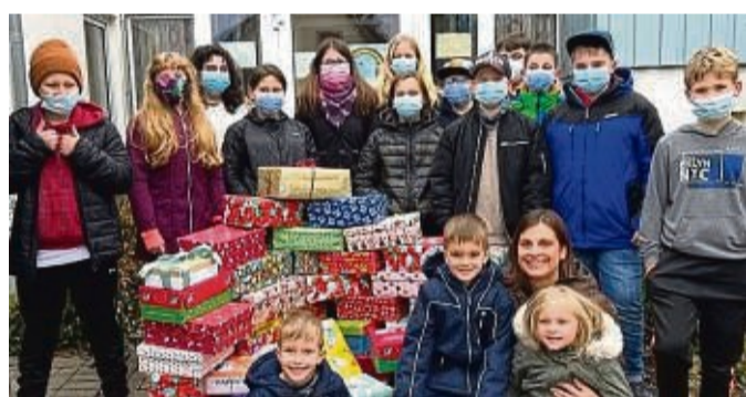
Schuhkartons in gut gefüllte Weihnachtspakete verwandelt: Die Schüler der Anne-Frank-Schule Wanfried haben sich an der Aktion in diesem Jahr wieder beteiligt.