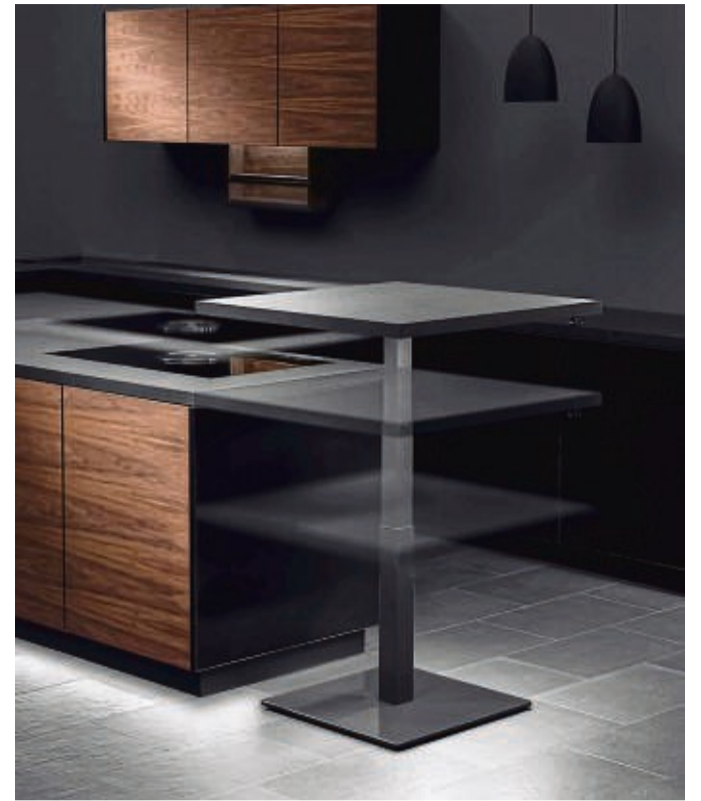
Viele Küchenmöbel-Hersteller haben zur Optik der Küche passende Wohnmöbel im Programm. Auch hier kommen nun zusätzliche Schreibtische unter.