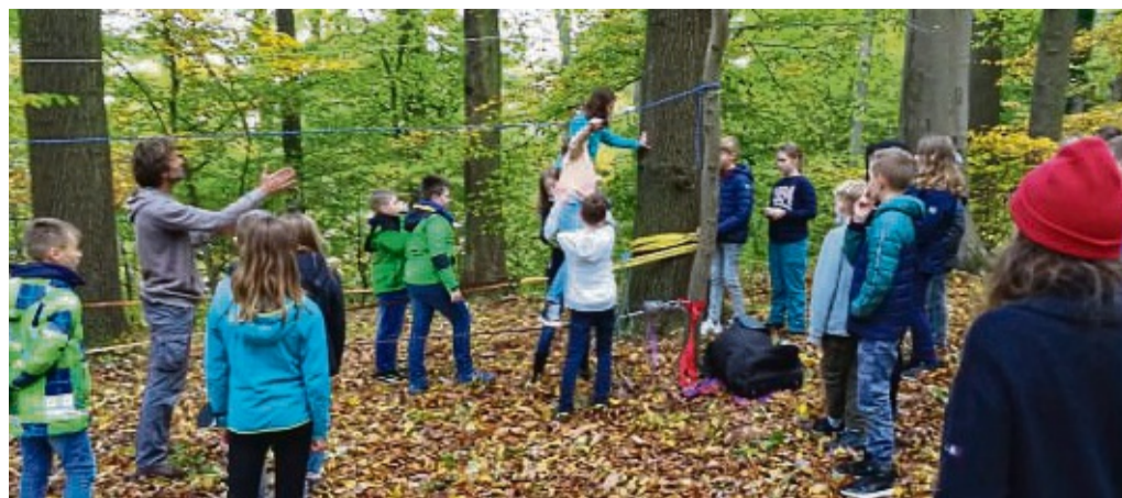
Vertrauensübungen: An der Slackline im Niedrigseilgarten ging es für die Fünftklässler auch darum, einander zu vertrauen und sich gegenseitig zu helfen.