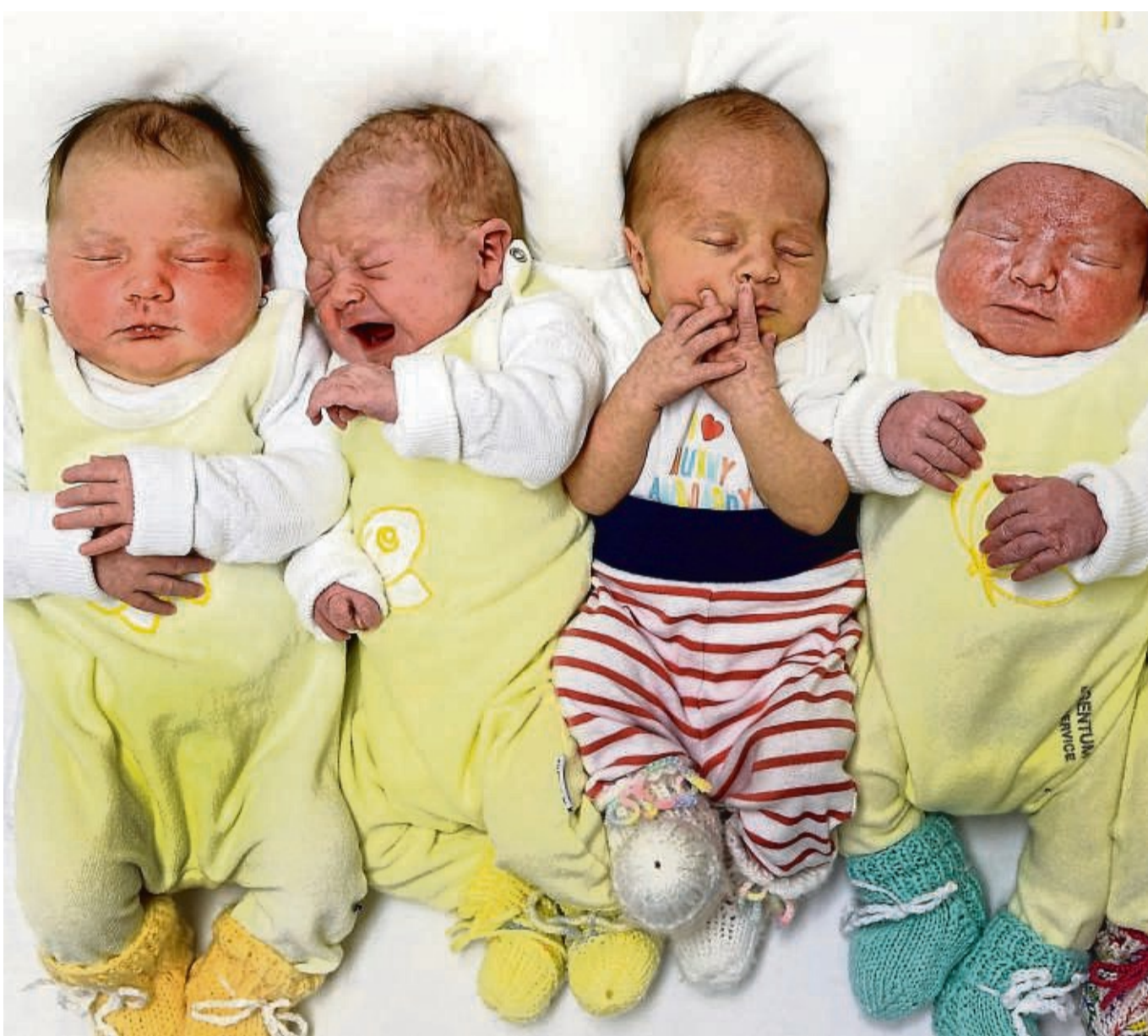
Geburten boomen weiterhin: Trotz vieler Geburten sinkt die Einwohnerzahl.

416 Kinder wurden im ersten Halbjahr geboren. Das liegt über dem Jahresschnitt der vergangenen Jahre. Ein einmaliger Höchststand wurde 2018 mit 837 Kindern pro