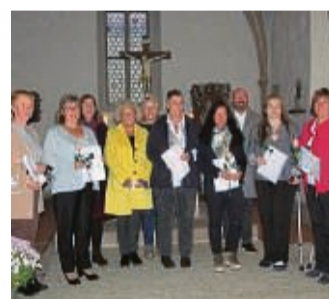
Begleiten Sterbende: Acht neue Hospizbegleiterinnen wurden in Netra ihre Zertifikate übergeben.

Bei Interesse an einer Fortbildung oder dem Wunsch nach Begleitung für einen Angehörigen ist der Hospizdienst des FFD in Datterode unter der Telefonnummer 0 56 58/ 9 22 85 20 zu erreichen.