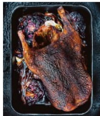
Eine Ente mit Portwein-Kohl und Räucherspeck.

Zum Hauptdarsteller werden Rot- und Spitzkohl, wenn sie in Scheiben geschnitten mit Räucherspeck, Portwein, Honig, Cranberries, Chiliflocken, Salz und Pfeffer im Grill bei indirekter Hitze 40-50 Minuten lang schmoren. Auch Fisch und Meeres-