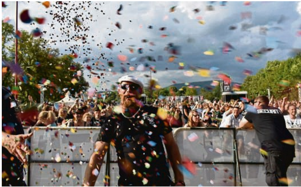
In 2022 soll es wieder bunt und laut werden: Die Organisatoren haben bereits viele Bands verpflichtet und gehen momentan vom Idealfall aus.