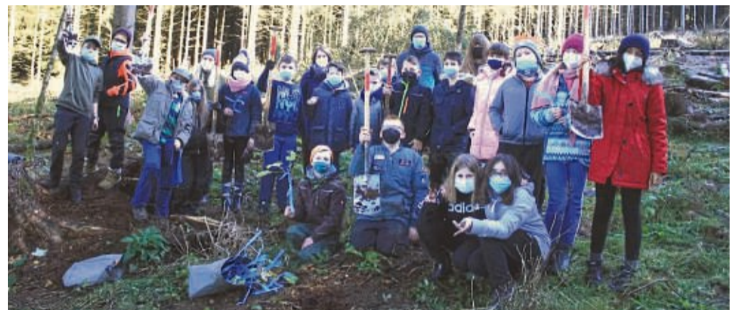
Hatten viel Spaß bei der Baumpflanzaktion auf dem Meißner: Schüler der Anne-Frank-Schule, die mit Schaufeln Platz für neue Bäume schafften.