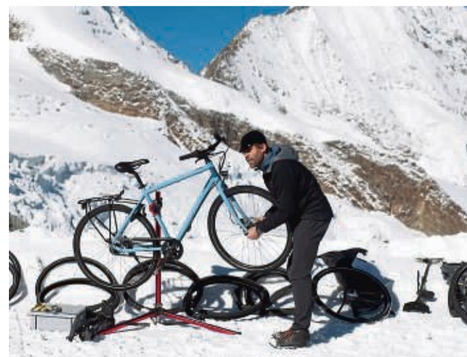
Wechsel gefällig? Wer in der kalten Jahreszeit Fahrrad fährt, ist mit Winterbereifung besser bedient.

Grundsätzlich empfiehlt der ADAC, den Reifendruck der Fahrradreifen im Winter auf zwei bis drei bar zu reduzieren. So hat durch die breitere Auflagefläche mehr Bodenhaftung. Die Vorderbremse wird in der kalten Jahreszeit am besten nur dosiert eingesetzt. Zudem rät der ADAC zu reflektierender Kleidung und Helm. tmn