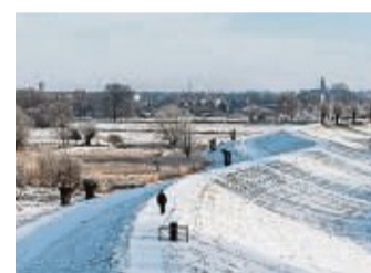
Auf dem Elbdeich schweift der Blick über die winterliche Auenlandschaft.

In der Prignitz im Nordwesten Brandenburgs lädt der Winter zu prächtigen Naturschauspielen ein: Raureif überzuckert die vereiste Auenlandschaft, Schnee glitzert in der Sonne und mit etwas Glück schaukelt das wunderbare Pfannkucheneis auf der Elbe. Die alte Kulturlandschaft zwischen Elbe und Mütznitz lädt mit reizvollen Wanderwegen und komfortablen Wellnesshotels zu erholsamen Winterferien ein. Das Unesco-Biosphärenreservat ist ein Vogelparadies, das im Winter von Kranichen und Wildgänsen bevölkert wird. Nach dem Fußmarsch ist Zeit für entspannte Wellness, etwa im Loft-Spa des Elbe Re-