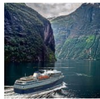
Der Geirangerfjord ist das Juwel der norwegischen Fjorde.

Eine Fahrt mit dem Postschiff entlang der norwegischen Westküste mit ihren unzähligen Buchten und Fjorden dürfte zu den schönsten Seereisen der Welt gehören. Auf der offiziell „Kystruten“ genannten Strecke erlebt man atemberaubende Landschaften, spannende Städte und Sehenswürdigkeiten sowie eine faszinierende Natur und Vogelwelt. Seit 1893 befördern Schiffe Fracht und Passagiere zwischen 34 Städten und Siedlungen. Täglich legt ein Schiff in Bergen ab und folgt der Küste bis Kirkenes. Die Hin- und Rückfahrt dauert zwölf Tage. Es sind Postschiffe von zwei Reedereien unterwegs: Hurtigruten und Havila.