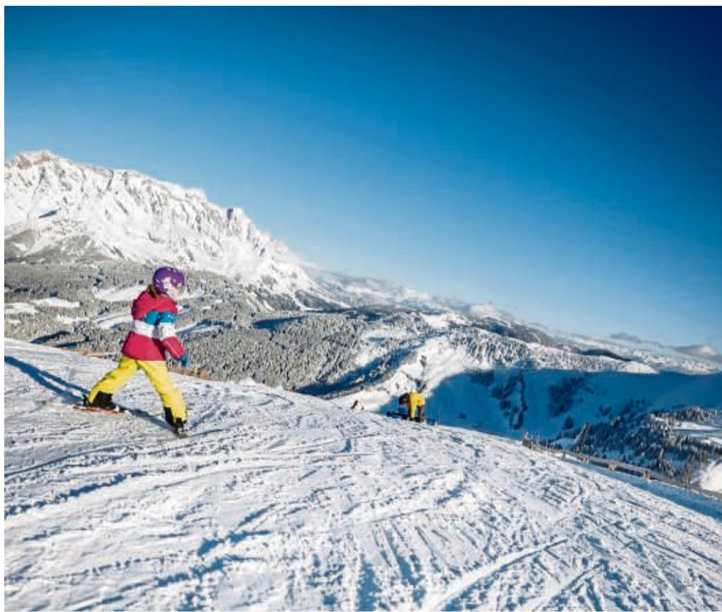
Abwärts im Schneepflug: Kinder können schon früh mit dem Skifahren anfangen.

Welche Ausrüstung braucht ein Kind? Zentral sind Skier, Skischuhe und Helm. All diese Utensilien müssen zur Körpergröße und zum Alter passen, erklärt Braun. Auch Skibrille, Skianzug und gute Handschuhe gehören zur Kinder-Ausrüstung. Eine neue Ski-Ausrüstung ist teuer und hält nicht lange. Besser ist das Mieten bei einem Skiverleih. „Manche Sporthändler bieten auch mitwachsende Ski oder Tauschsysteme“, sagt Braun. Dabei kann die zu klein gewordene Ausrüstung gegen eine größere getauscht werden.