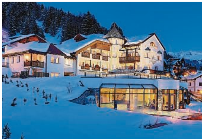
Schenken Sie zu Weihnachten Glücksmomente mit hohem Erinnerungswert – oder gönnen Sie sich selbst eine erholsame Wellness-Auszeit zu zweit.

ein hochwertiges Gutschein-Booklet in einer edlen Metall-Geschenkbox mit Banderole. Perfekt zum Selbst-Verreisen oder auch als Geschenk!