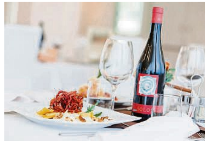
Der Gutschein beinhaltet eine Auswahl aus rund 140 Hotels, die Entspannung mit gehobenem kulinarischen Genuss verbinden.