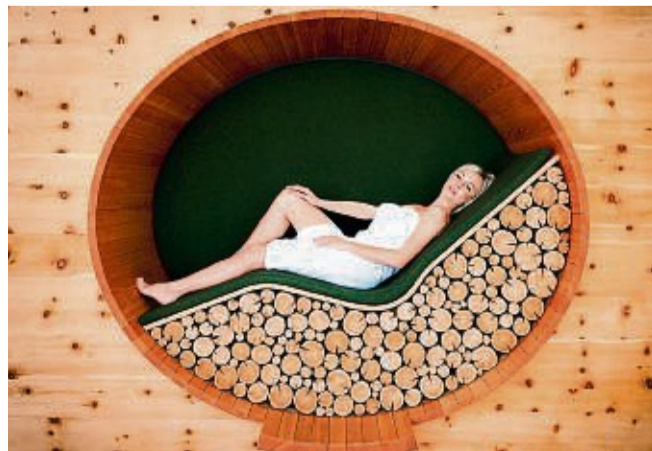
Wer die exklusive Geschenkbox erwirbt, hat 36 Monate Zeit, um den attraktiven Kurzurlaubsgutschein einzulösen.