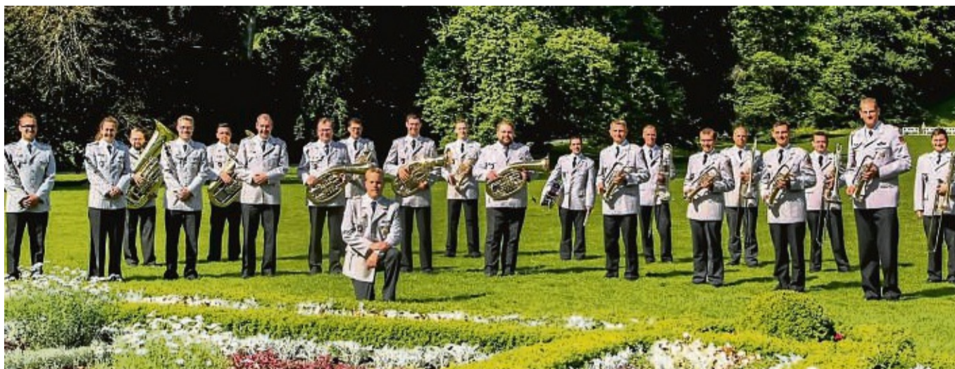
Heeresmusikkorps Kassel. Das Egerländer-Ensemble spielt am 16. November in Rosenthal. Der Erlös kommt der Aktion für behinderte Menschen zugute.

Die Egerländer-Besetzung ist nach dem sinfonischen Blasorchester mit etwa 20 Musikern das größte Ensemble innerhalb des Heeresmusikkorps Kassel. Mit ihrer Interpretation traditioneller böhmischer, mährischer und tschechischer Werke und neueren Arrangements zieht das Ensemble das Publikum in seinen Bann und begeistert auch junges Publikum, heißt es in der Ankündigung.