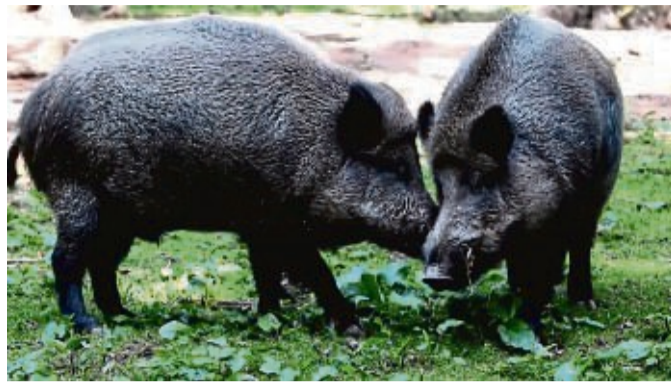
Wildschweine wie diese brechen derzeit bei der Nahrungssuche Wiesen auf und richten dabei erhebliche Schäden in der Landwirtschaft an.