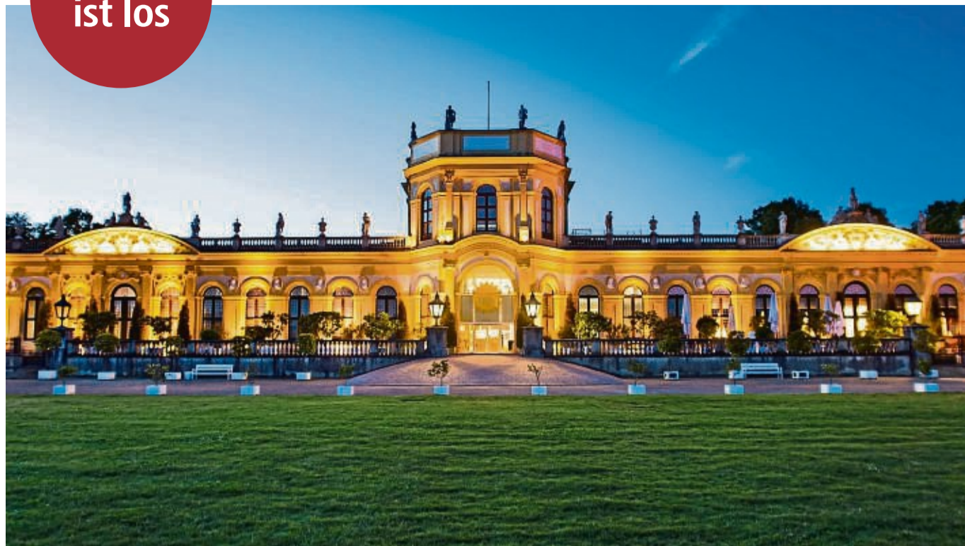
Premiere: Erstmals findet der Winterzauber an der Orangerie in Kassel statt.