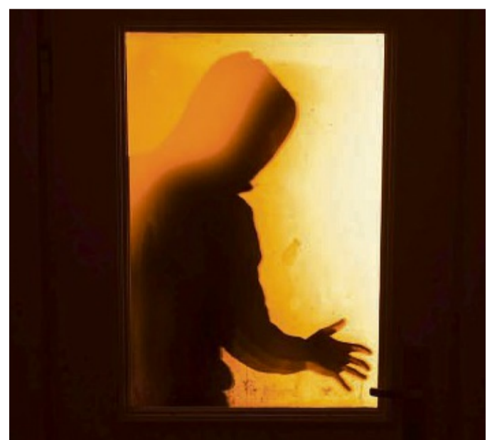
Fenster und Türen sollten mechanisch vor Einbrechern gesichert sein.