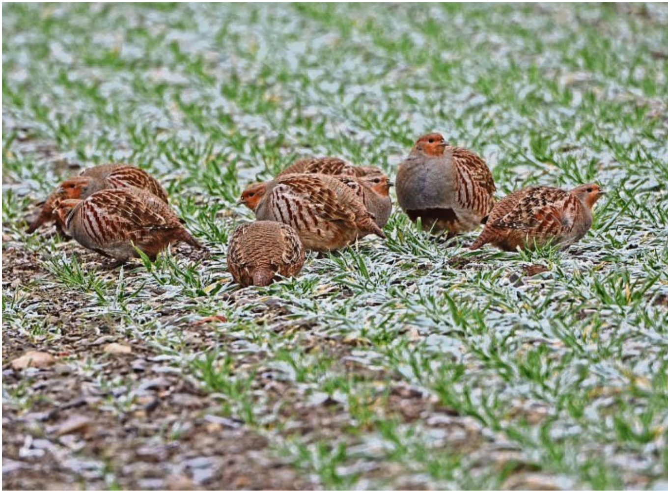
Brauchen Schutz: Rebhühner in der Feldflur.