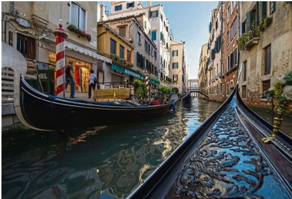
Venedig wird schon lange der baldige Untergang nachgesagt – doch bis heute lockt die Stadt der Kanäle fröhlich Touristen an.

Denn das Authentische hat – wie die Reliquie – immer mit Vervielfältigung zu tun. Et was muss kopiert werden können, damit es überhaupt als authentisch bezeichnet werden kann. Niemand bezeichnet den Mont Blanc als authentisch, dafür ist der zu groß. Authentisch sind die Bilder davon und das Erlebnis. Das Authentische handelt immer vom Besucher, von der Betrachterin, nicht von der Sache selbst.