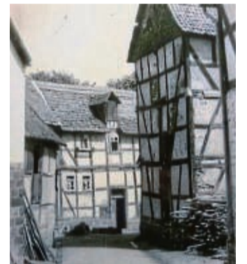
Der Gemündener Kalender für 2022 zeigt Aufnahmen von 1944.

Gemünden – Der Kalender 2022 des Museumsvereins Gemünden ist ab sofort erhältlich. Er zeigt teilweise bisher unveröffentlichte Stadtansichten Gemündens aus dem Jahr 1944. Der Kalender kann für 10 Euro bei Firma Helmut Engelland, Optik Hemmen, Modetreff Arnhold Borufka und Rosen-Apotheke gekauft werden. Auch eine telefonische Bestellung ist möglich bei Marlene Wagner, 064 53/64 82 50, oder Brunhilde Michel, 0 64 53/70 68. nh/jpa