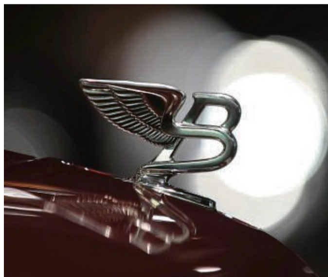
B wie Britannien? B wie Barock? Ach kommen Sie, sicher wissen Sie, für was das B auf dieser Motorhaube steht.