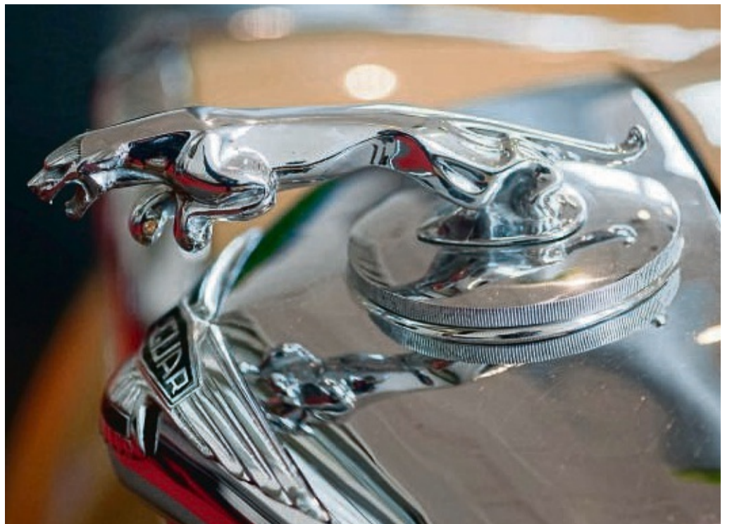
Katze auf Kühler: Richtige Figuren an der Fahrzeugfront sind heute selten, auf klassischen Autos wie diesem Jaguar aus den 1950er Jahren sieht man sie häufiger.

Das Markenlogo von Bugatti im Grill des Chiron wird laut Hersteller bei einem Jewelier in Süddeutschland aus massivem Sterling-Silber gegossen und so aufwendig emailliert, dass die Produktion mehrere Tage dauert und pro Teil schon im Einkauf allein 500 Euro kostet. tmn