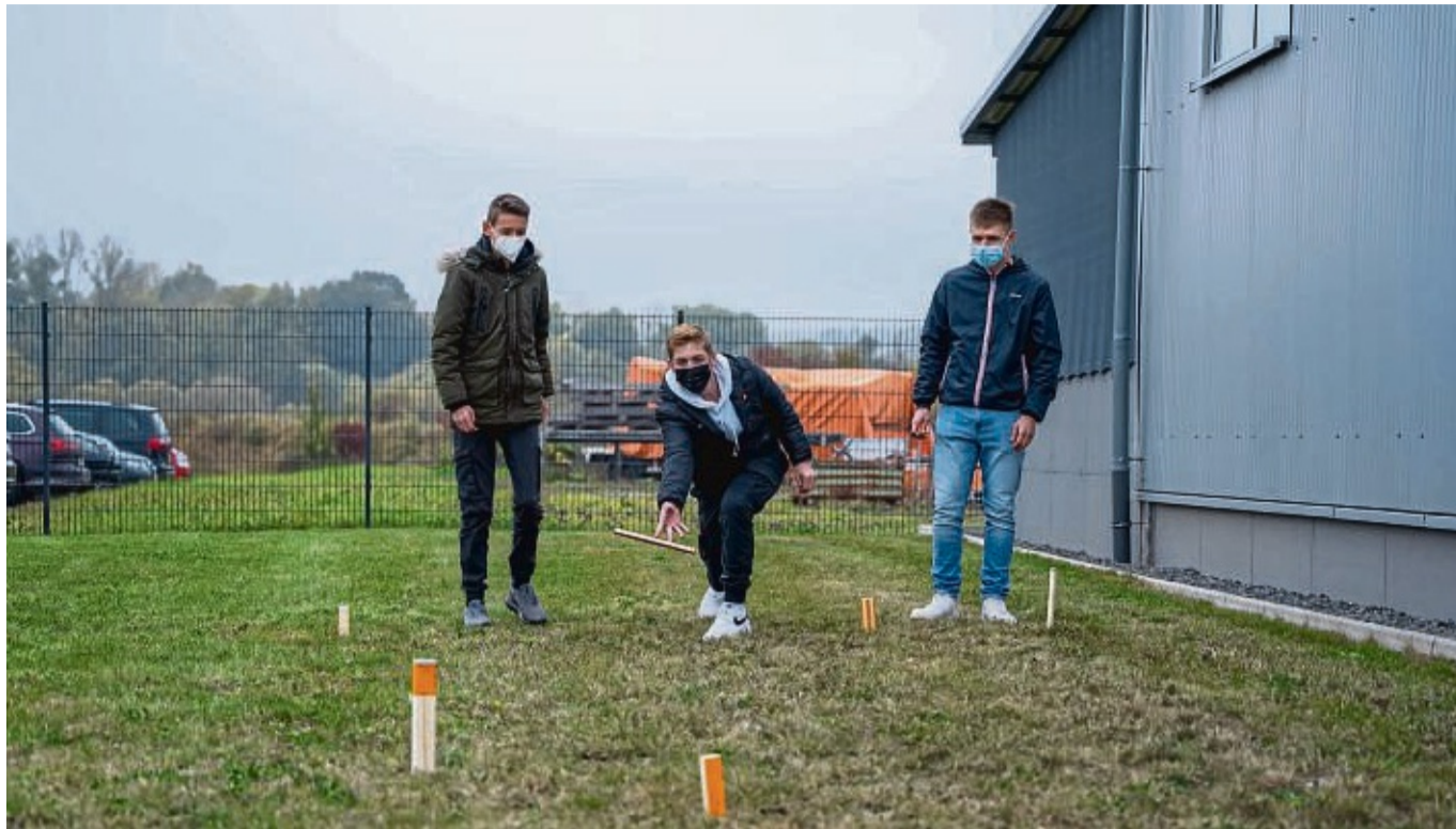
Beim „Projekttag Zukunft“ bei Finger-Haus bauten die Teilnehmer ein Wikingerschach-Spiel.

„Projekttag Zukunft“ bei der Firma Finger-Haus in Frankenberg