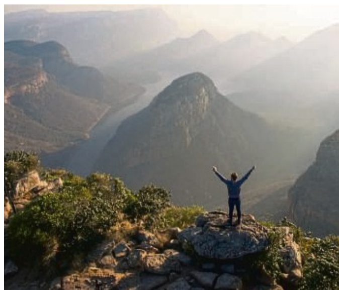
Der Blyde River Canyon ist eine der bekanntesten Sehenswürdigkeiten Südafrikas.

Südafrikas berühmter Blyde River Canyon bekommt einen Skywalk mit Glasboden. Die lange geplante Attraktion am Aussichtspunkt God's Windows („Gottes Fenster“) soll nach Angaben der Mpu-malanga Tourism and Parks Agency im Jahr 2023 fertiggestellt werden. Der fünf Meter breite Skywalk wird zwölf Meter über die 900 Meter tiefe Schlucht hinausragen und 360-Grad-Blicke ermöglichen. Der Blyde River Canyon liegt nordöstlich von Johannesburg.