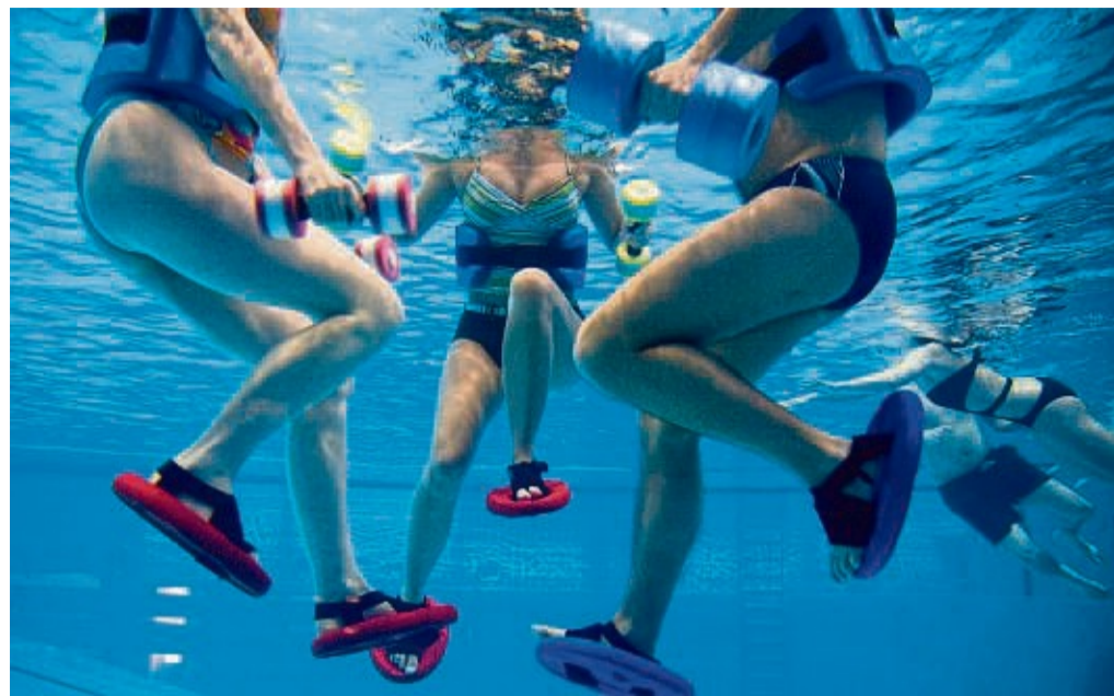
Entlastung dank Auftrieb: Im Wasser trainiert man nur mit einem Bruchteil des eigenen Körpergewichts.