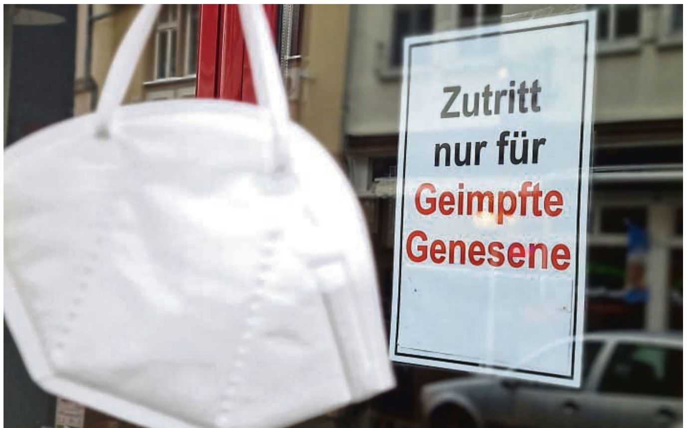
Zutritt nur für Geimpfte und Genesene: Das gilt, wie hier auf dem Symbolbild, ab Montag auch für Besucher in den Akut-Krankenhäusern im Kreis.

Der Verkaufspreis pro Kalender beträgt 7,50 Euro. Verkaufsstellen sind die Gemeindeverwaltung und die Postagentur, die Sparkasse und die Frankenberger Bank in Allendorf.