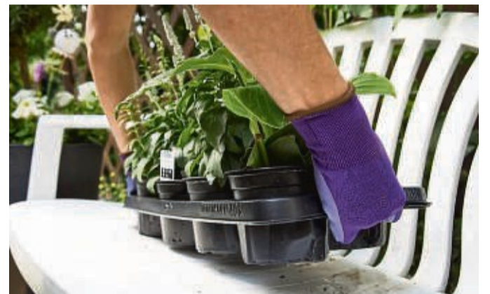
Transporttrays für Blumentöpfe können nach der Verwendung in der Gelben Tonne landen.

FISCHE 20.2.-20.3. Ihnen geht es eindeutig zu langsam voran. Zügeln Sie Ihre Ungeduld und lassen Sie den Dingen einfach ihre Zeit: Sonst läuft die Sache aus dem Ruder.