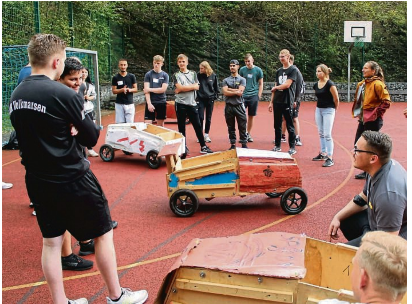
Nach der Testfahrt durch den Seifenkisten-Parcours im Sport- und Erlebniscamp Edersee im Breitenbachtal bei Harbshausen.

In der Vergangenheit wurden Geschenkpäckchen, verbunden mit Gutscheinen für Bäume an die Hauberner Kinder verteilt. Die damit verbundene Pflanzaktion wurde auf das kommende Frühjahr verschoben. Zum Schluss einigten sich die Hauberner Sänger darauf, ihre 14-tägige Singstunde bis Ende des Jahres abzuhalten.