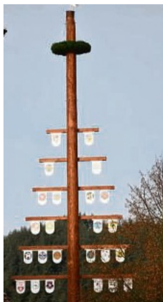
In neuem Glanz: der erneuerte Löhlbacher Ständebaum.

Nach dem Richten gab es eine kleine Feier im Bürgerhaus. Der Erlös, dessen Höhe noch nicht genau feststehe, werde dem Ort zur Verfügung gestellt. Der Ortsbeirat werde in seiner nächsten Sitzung am Freitag, 26. November, ab 19 Uhr im DGH entscheiden, wer das Geld erhalten soll. mab