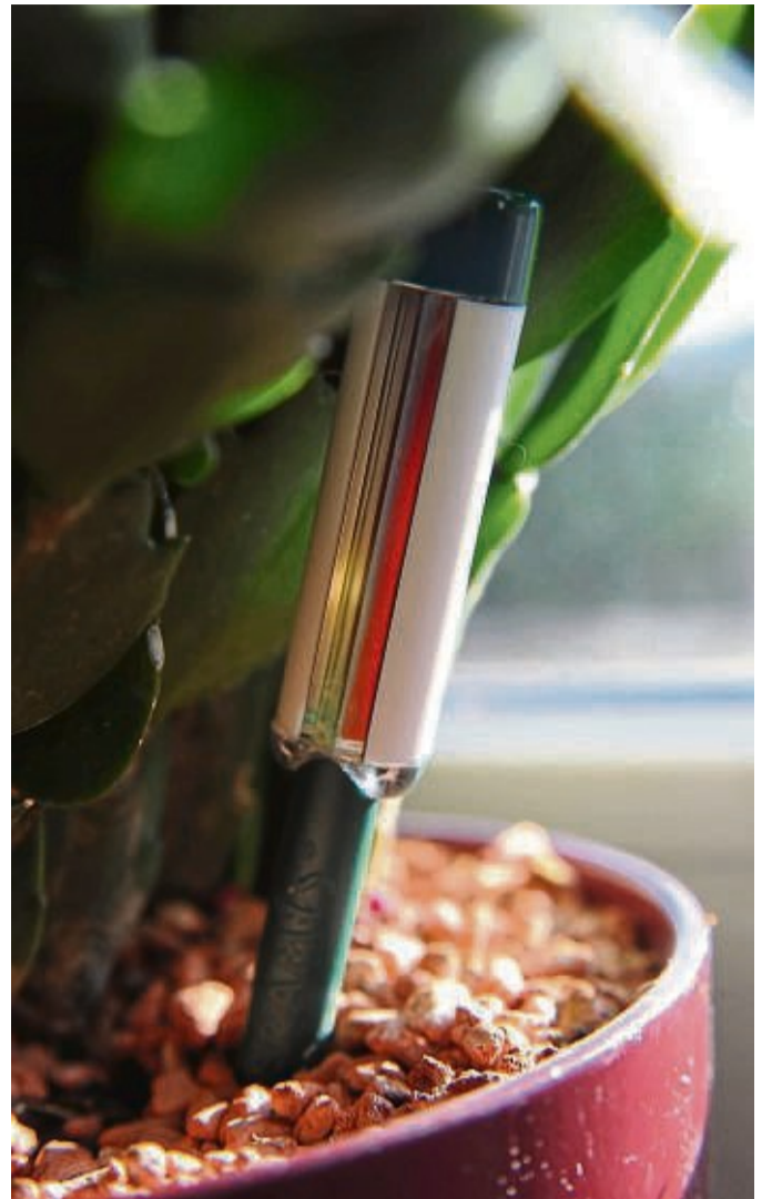
Mit einem Bewässerungssystem kann auch im Winter gut im Blick gehalten, wann eine Zimmerpflanzen Nachschub braucht.

Das Lüften an kalten Wintertagen ist auch nicht immer gut für die Zimmerpflanzen. „Wenn sich der Mensch im Zug unwohl fühlt, tut es die Pflanze auch“, sagt Jürgen Herrmannsdörfer. Gefährlich werden kann Zugluft mit Temperaturen von unter zehn Grad für Pflanzen mit kleinen und weichen Blättern, etwa das Einblatt. Stellen Sie die Pflanze während des Stoßlüftens einfach kurz woanders hin. tmn