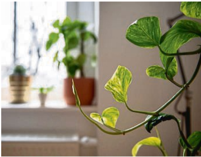
Es ist besser für Pflanzen, wenn sie nicht unmittelbar der Heizungswärme ausgesetzt sind.

Ihr Grün ist nicht dabei? Der Fachverband Raumbegrünung und Hydrokultur hat eine Liste an Daten für beliebte Zimmerpflanzen online zusammengestellt. Messen kann man die Beleuchtungsstärke in einem Wohnraum mit einem sogenannten Luxmeter oder einer Lichtmesser-App für das