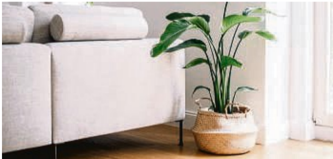
Vor allem im Winter brauchen viele Zimmerpflanzen einen Standort nah am Fenster.