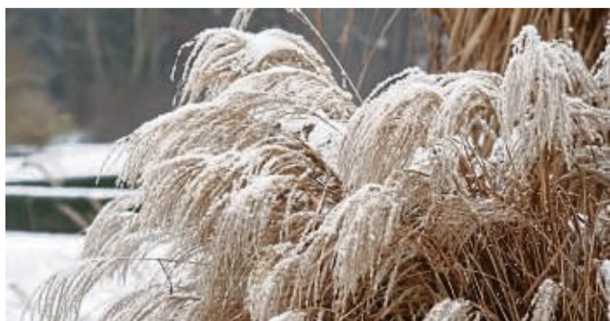
Gräser wie das Chinaschilf sind mit Schnee bedeckt ein schöner Hingucker im Garten.

Es gibt winter- und sommergrüne Grassorten. Wintergrüne bleiben auch die kalte Jahreszeit hindurch so, wie man sie im Sommer kennt: grün und saftig. Sie behalten auch ihre Gestalt. Hier ist also keine Arbeit des Hobbygärtners nötig. Sommergrüne Gräser sterben hingegen im Winter ab, jedoch nur die oberirdischen Teile. Diese werden braun und erschlaffen zum Teil. Die Wurzeln im Erdreich bilden im Frühjahr neue Triebe. Für diese Gruppe raten Experten dann zu einem Schnitt einmal im Jahr – im Frühling. tmn