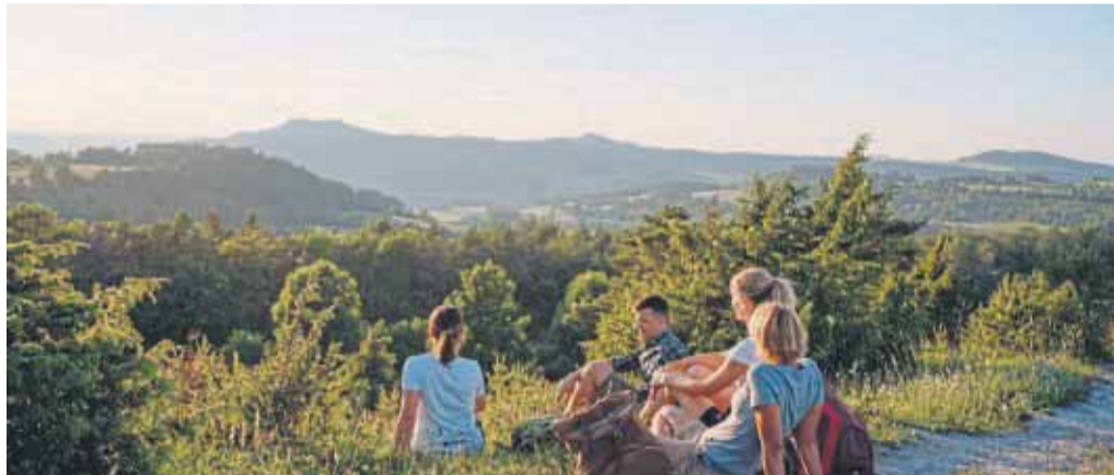
Unterwegs auf einem der acht Keltenwege: Rast mit Blick auf den Staffelberg.