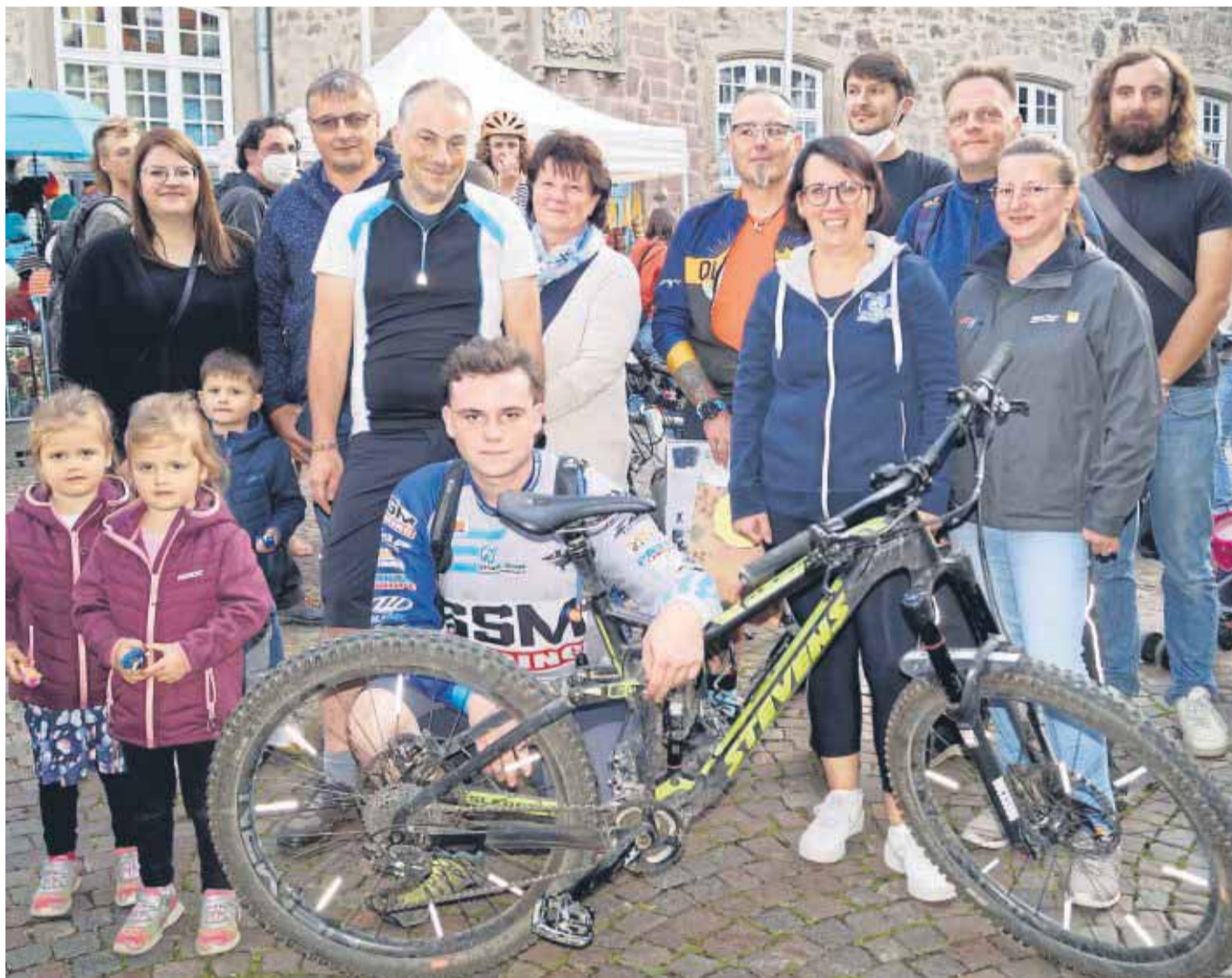
In der Kategorie Ortsteile fuhr das Team Radkombinat Hubenrode allen anderen davon: Die 17 Mitglieder schafften in drei Wochen 5053 Kilometer.

Auch Gruppen wurden für ihre Leistungen belohnt, hier schaffte es das Team IG Wagenleben in der Kategorie Bürgerengagement auf den ersten Platz, die Mitglieder radelten 5494 Kilometer und haben damit 808 Kilogramm CO 2 eingespart. Das Radkombinat Hubenrode fuhr mit 5053 Kilometer an der Spitze der Kategorie Ortsteile und bei den Familien war das Team Keine Gnade für die Wade mit 372 Kilometern am