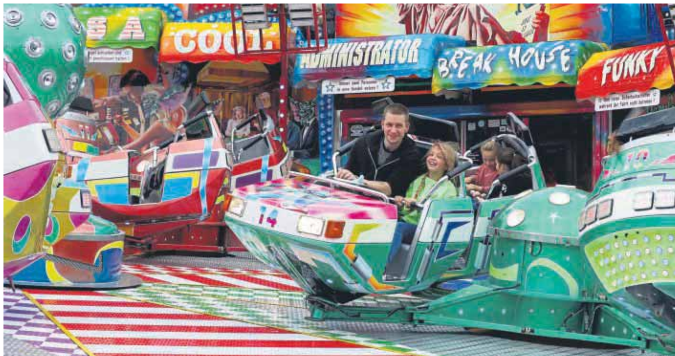
Bei Besuchern beliebt: Im Break Dance ist Adrenalin garantiert.

Ein Einkauf in Hann. Mündens historischer Altstadt ist immer auch zugleich ein Flanieren und Staunen - abseits vom Großstadtrubel macht Shopping hier richtig Spaß.