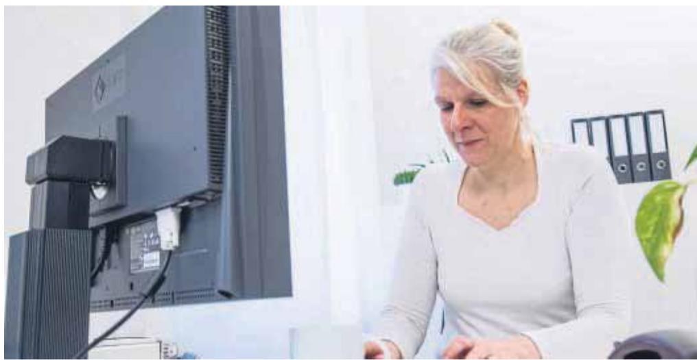
Immer anspruchsvollere Programme: Die können den Rechner irgendwann in die Knie zwingen, wenn man nichts unternimmt.

Oft sind daran auch vergessene Programme schuld, die nie deinstalliert wurden. Diese beanspruchen Speicherplatz und damit Rechenleistung, erklärt Jörg Hähnle. Der Windows-Sachbuchautor und Betreiber von „Paules-PC-Forum.de“ weist auf ein weiteres Problem hin: „Viele Anwendungen nisten sich im