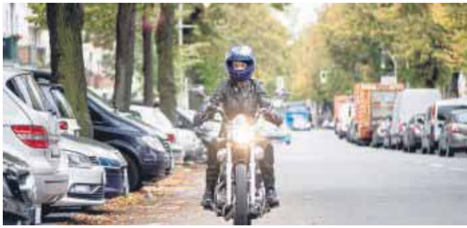
Motorradfahren in der kalten Jahreszeit ist aufgrund verschiedener Einflussfaktoren besonders gefährlich.