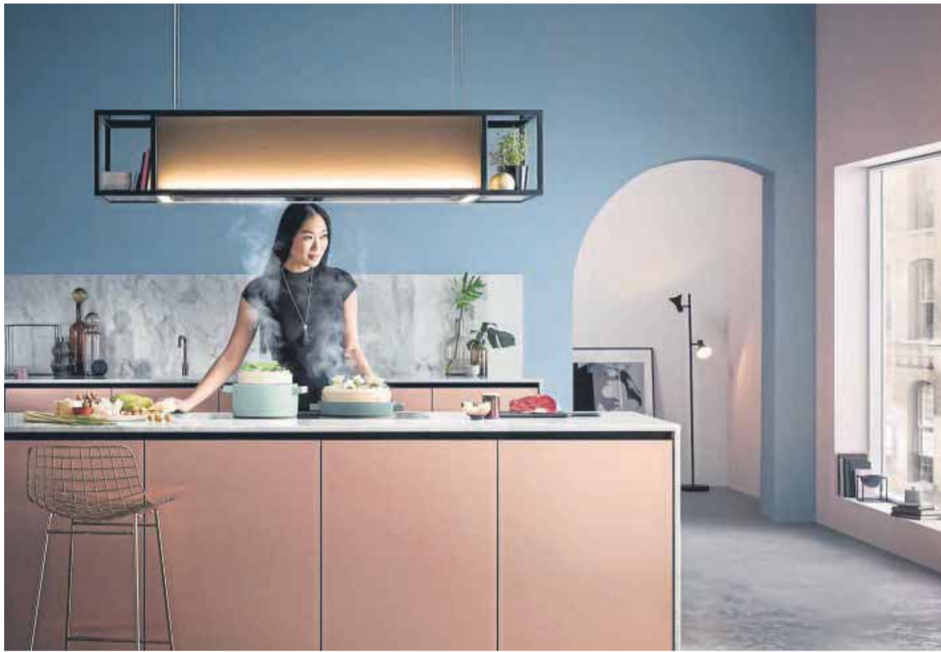
Kochinseln sind nicht nur zum Vorbereiten und Kochen gut, mit Sitzplätzen versehen bieten sie Raum für Geselligkeit.

Denn so eine offene Küche braucht Platz: 15 Quadratmeter sollten es mindestens sein, eher mehr. Ist genügend Raum vorhanden, sollte man sich überlegen, wie die Insel