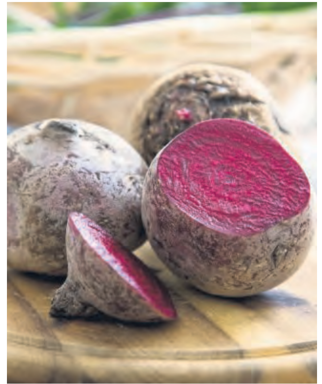
Sollen Rote Bete gekocht werden , werden sie nur abgeschrubbt und kommen ungeschält ins Wasser. Sonst bluten sie aus und verlieren Aroma.

Jetzt erst einmal nur einen Probeknödel formen. Er kommt ins kochende Salzwasser. Danach Hitze reduzieren und den Knödel 10 Minuten gar ziehen lassen. „Zerfällt er, nachwürzen. Wird er zu weich, noch Mehl unter