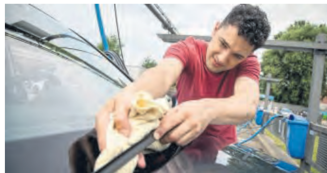
Sorgsam säubern: Die Wischerlippen von Scheibenwischern sind empfindlich.

Schlieren auf der Auto-scheibe nerven. Die Sicht ist beeinträchtigt, besonders stark bei Nässe und im Dunklen. Das kann richtig gefährlich werden. Deshalb hilft nur eins: ran an Scheiben und Wischer.