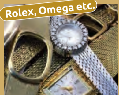
Rolex, Omega etc.