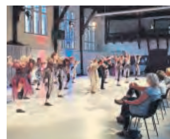
Abschluss des Programms: Die Tänzerinnen zeigten eine Kurzfassung des Musicals „Tanz der Vampire“.