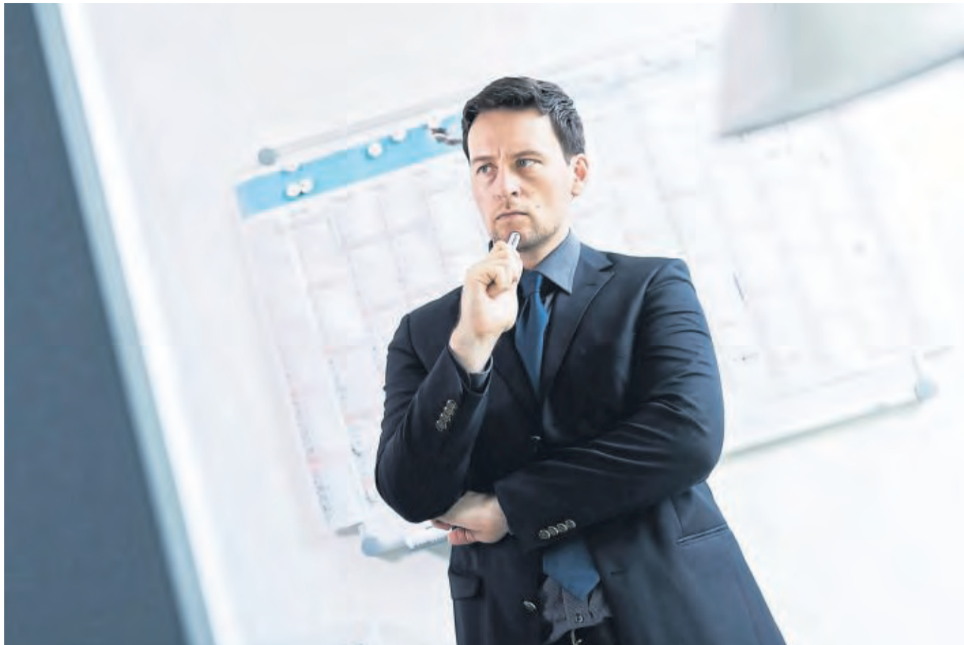
Wie tickt die Führungskraft? Wer sich das genau ansieht, kann mit eigenen Ideen eher punkten.