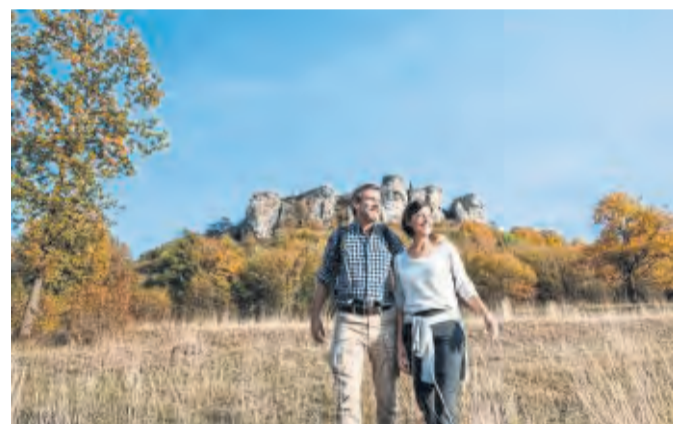
Die Landschaft rund um Bad Staffelstein verlockt zu Entdeckungstouren.