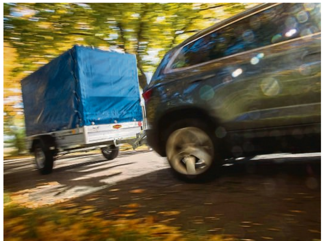
Flexible Raumerweiterung: Wer Sperriges transportieren will, kann über den Kauf eines Anhängers nachdenken.