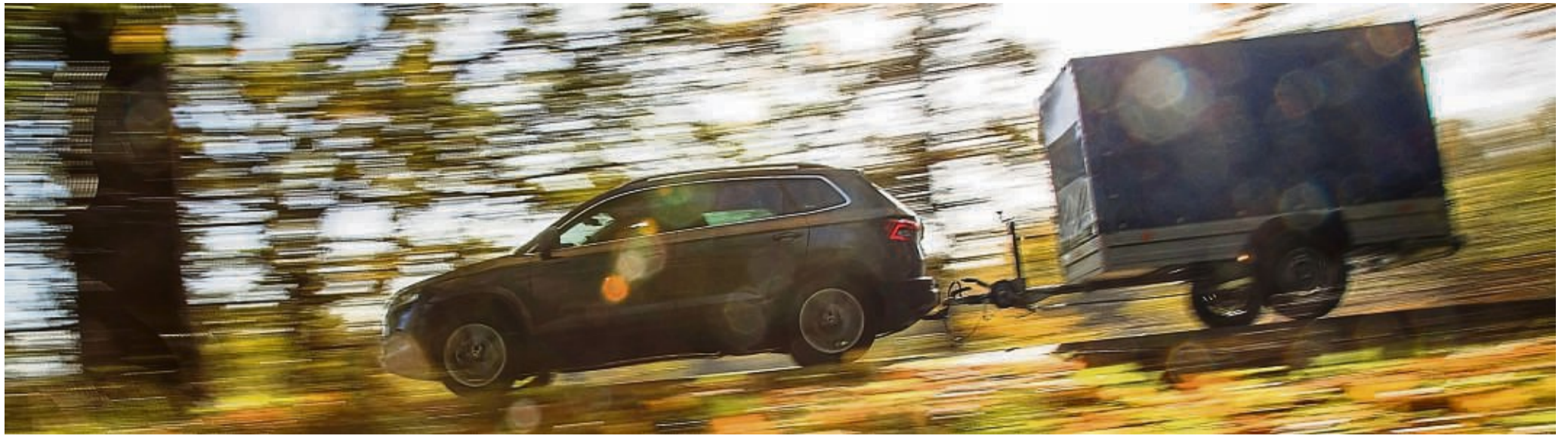
Bewegter Helfer am Haken: Ein Anhänger kann bei Umzug, Gartenpflege oder Großeinkauf ein nützliches Zubehör sein.