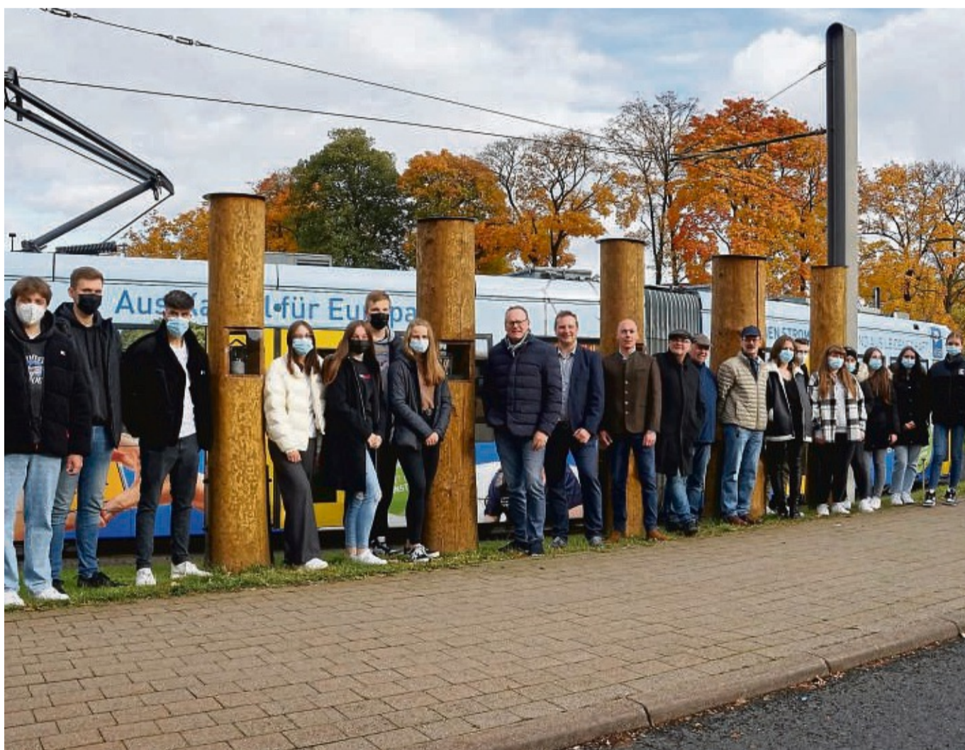
Präsentation der Kunstwerke: Oberstufenschüler der beiden Kunstkurse an der Freiherr-vom-Stein-Schule präsentieren ihre Kunstwerke Vertretern der Stadt, des Kunstpfades Ars Natura und des Tourismusvereins.

Öffnungen – anders als bei den letzten Stelen mit Mittelwand – definieren die Schüler als Sichtachse über den Festplatz Kreuzrasen bis hin zum Frau-Holle-Park, wo in etwa 100 Metern Entfernung auch der tonnenschwere Torbogen aus Beton den Eingang ins Reich der Märchenfigur markiert.