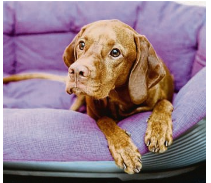
In der neuen Wohnung sollte der Hund schon beim Hereinkommen etwas Vertrautes finden, etwa eine Möbelkonstellation mit seinem Körbchen.