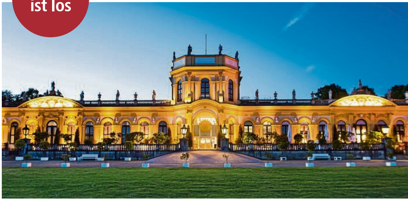
Premiere: Erstmals findet der Winterzauber an der Orangerie in Kassel statt.