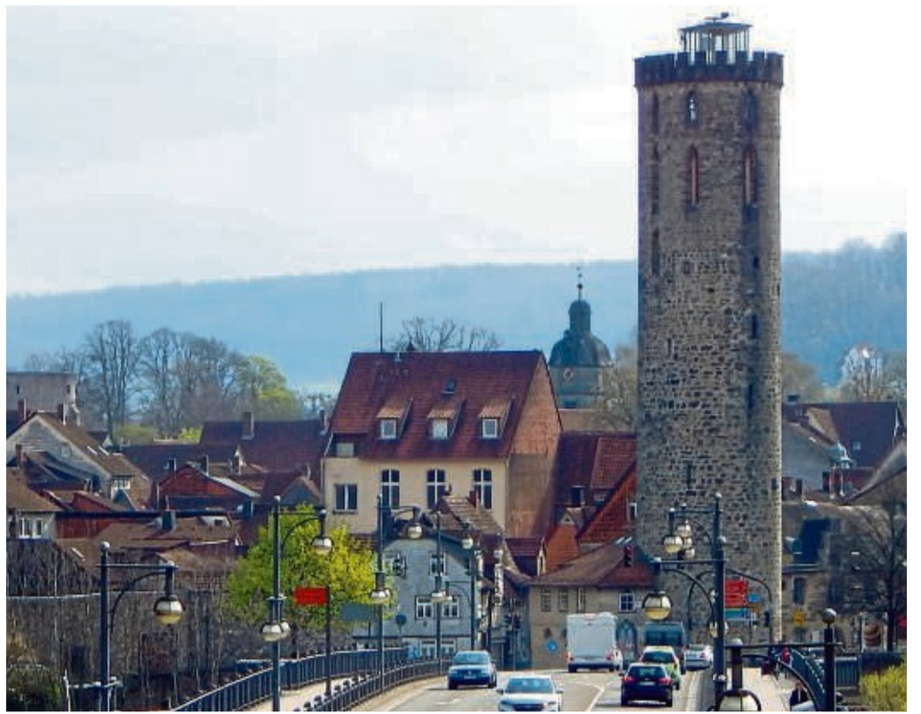
Der Fährfortenturm an der Fulda ist ein Teil der alten Stadtmauer.