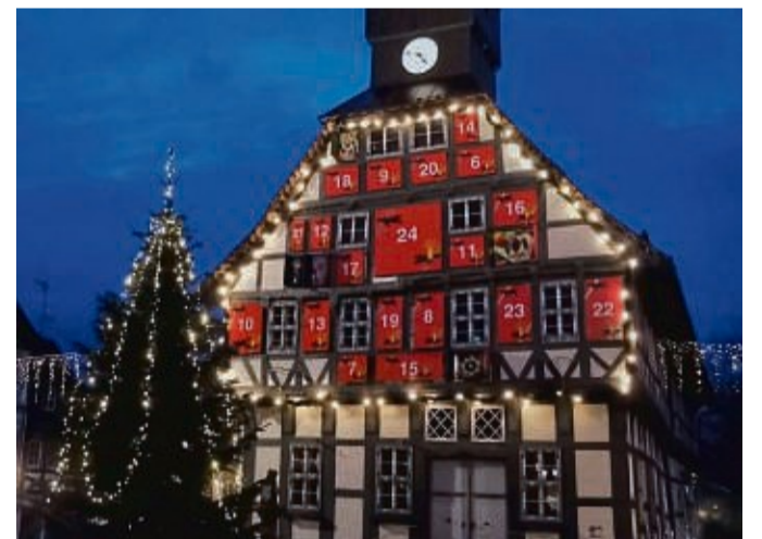
Das Rathaus in Uslar wird wieder zum Adventskalender.

der Markt, von 14 bis 20 Uhr. Freitag bis Sonntag sorgt Musik für stimmungsvolle Atmosphäre. Zudem wird das Alte Rathaus zum „Riesen-Adventskalender“. Im Museum findet die Sonderausstellung „Weihnachten im Solling“ statt. jed