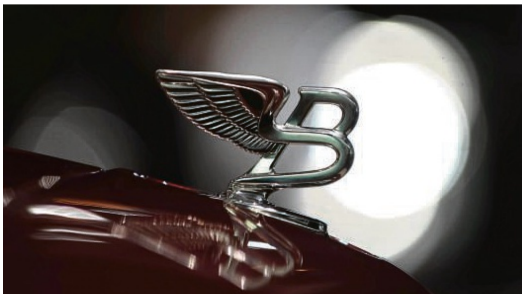
B wie Britannien? B wie Barock? Ach kommen Sie, sicher wissen Sie, für was das B auf dieser Motorhaube steht.