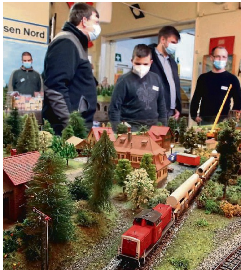
Stauende Gesichter: Der Modelleisenbahnclub Witzenhausen zeigte nach fast zwei Jahren wieder seine Märklin-Anlage.

„Weil am Wochenende sicher nicht jeder zu uns kom-