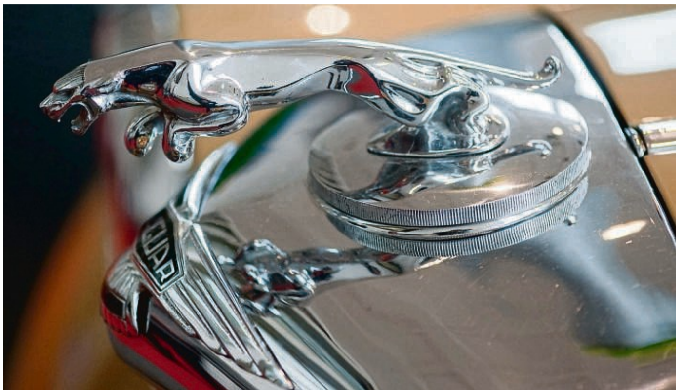
Katze auf Kühler: Richtige Figuren an der Fahrzeugfront sind heute selten, auf klassischen Autos wie diesem Jaguar aus den 1950er Jahren sieht man sie häufiger.

Nur weil sie die Kühlerfiguren ausgemustert haben, mangelt es aber auch den anderen Marken nicht gleich an der Liebe zum eigenen Label. Klar, der Opel-Blitz, der Peugeot-Löwe und selbst der berühmte Dreizack von Maserati,