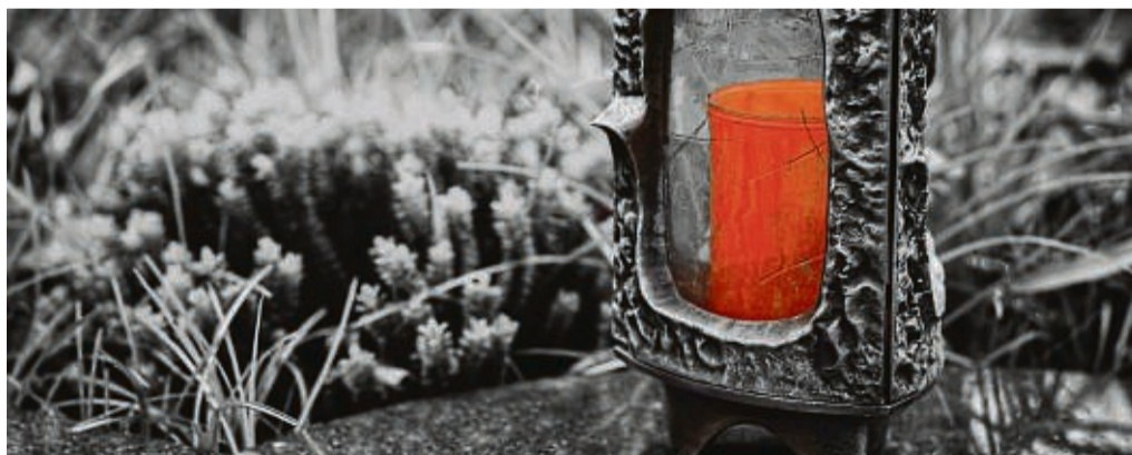
Das Grab ist ein guter Trauerort.

Manche moderne Beisetzungsförmien seien Studien zufolge dagegen nur bedingt zur Trauerbewältigung geeignet. „Gerade bei anonymen und halbanonymen Beisetzungsförmien wie Rasenfeldern, Baum- und Naturgräbern sind wichtige Handlun-