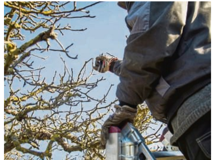
Die einen tun es noch im Herbst, die anderen im Winter. Mancher schwört auch auf das Frühjahr für den Gehölzschnitt.