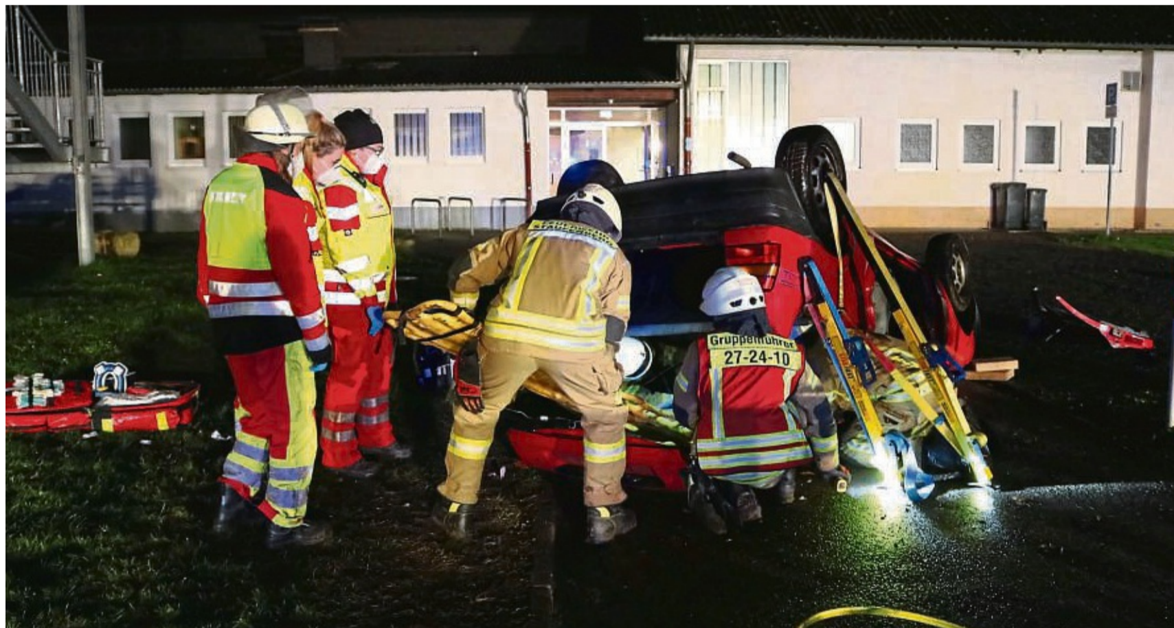
Rettungskräfte schnitten bei einer Übung in Uschlag das vermeintliche Opfer aus einem Auto. Simuliert wurde eine Gasexplosion.

Staufenberger Feuerwehr und Rettungsdienst üben Vorgehen bei Einsätzen