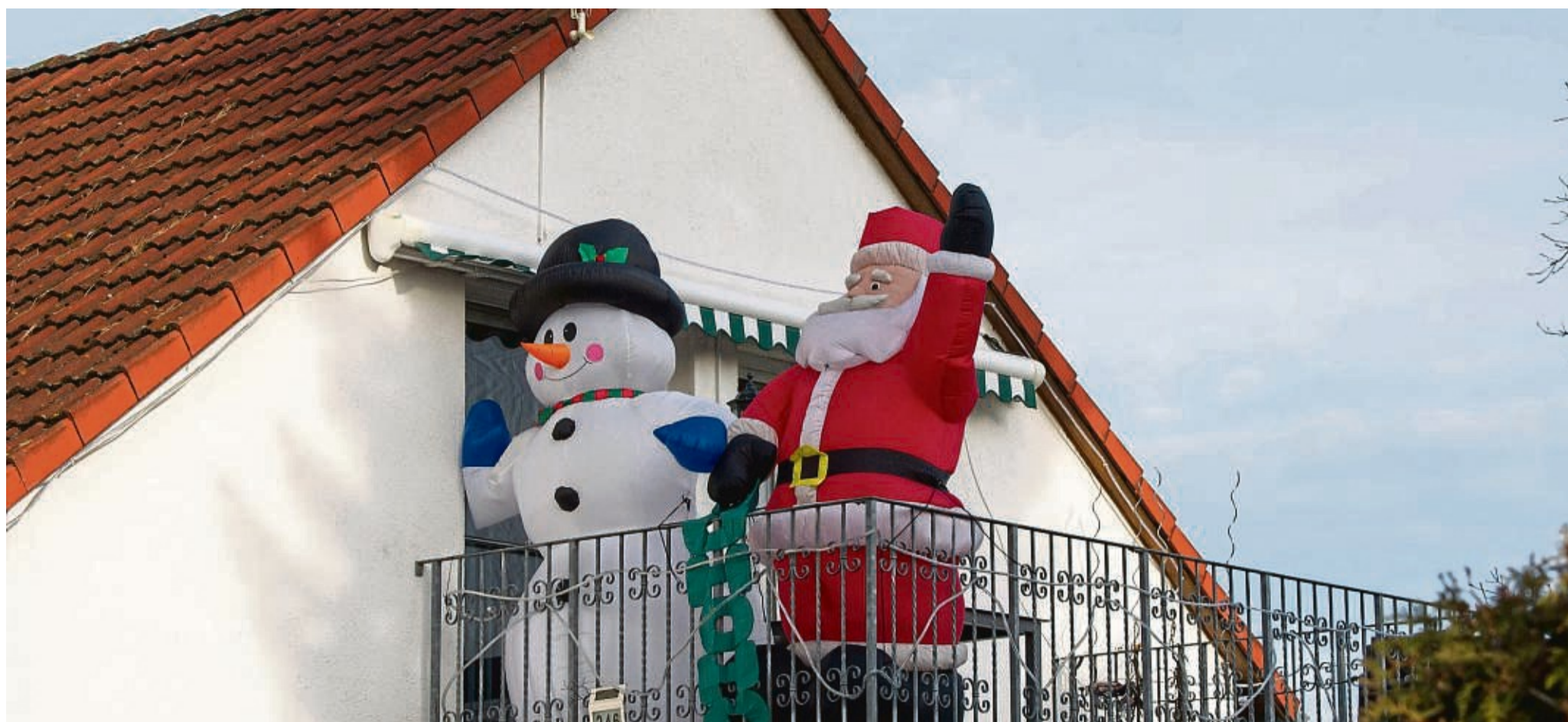
Wer riesige Deko auf dem Balkon aufstellt, muss dafür sorgen, dass sie gut gesichert ist.