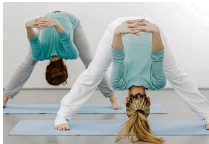
Ganz schön beweglich: Yoga kann körperlich fordernd sein.