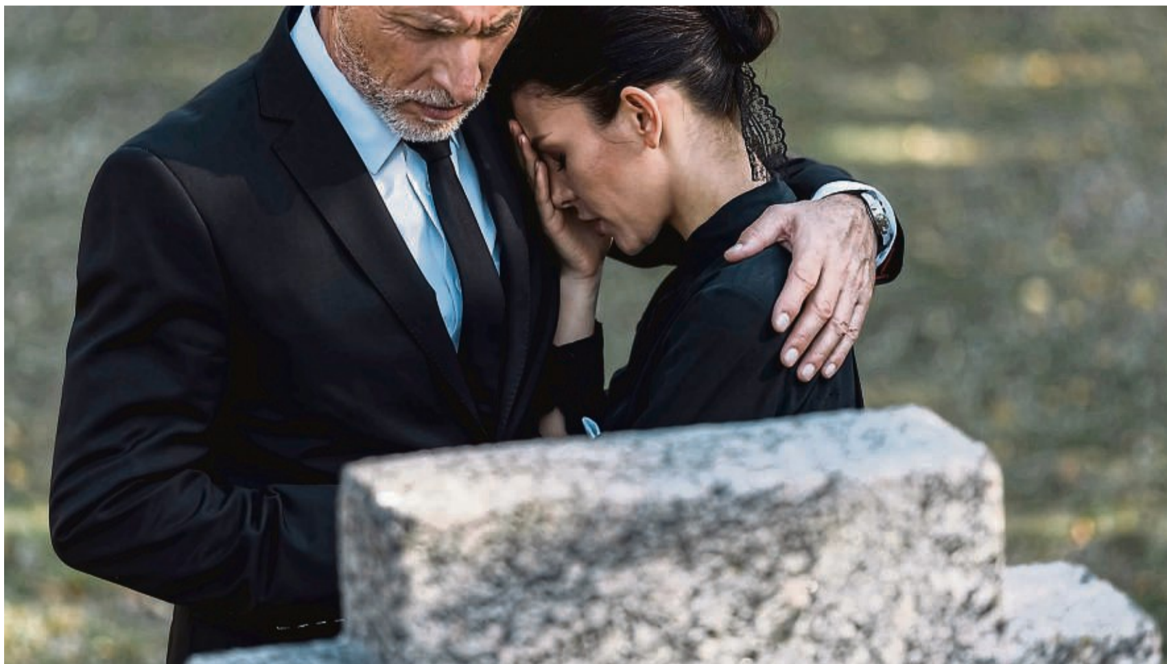
Im November gibt es einige Feiertage, an denen der Toten gedacht wird, beispielsweise am Totensonntag.

Gibt es auch evangelische Trauertage im November? Die Protestanten gedenken am