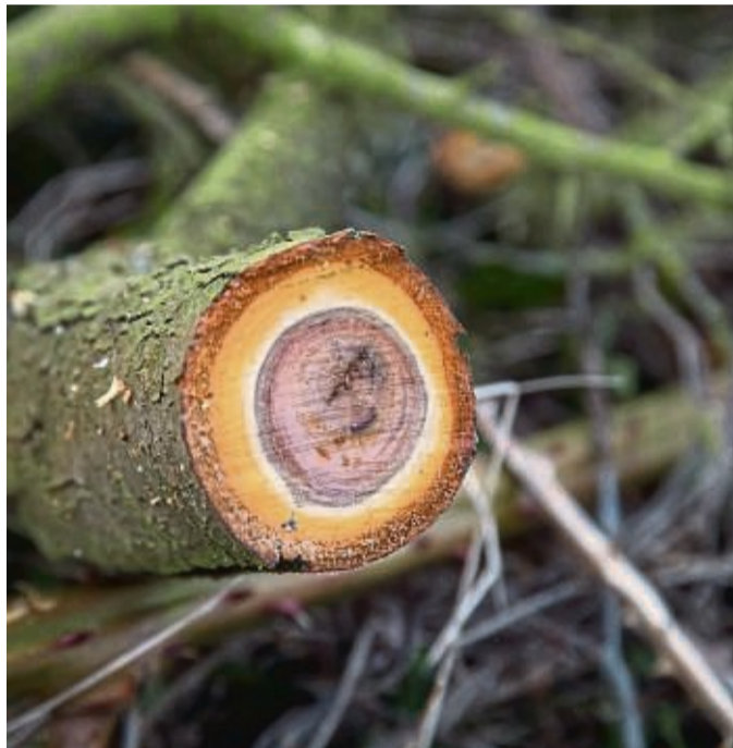
Wann eine Pflanze zurückgeschnitten wird, hat Einfluss auf ihre Entwicklung.