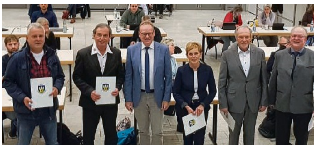
Die geehrten Mitglieder nachdem sie ihre Auszeichnungen erhalten haben.