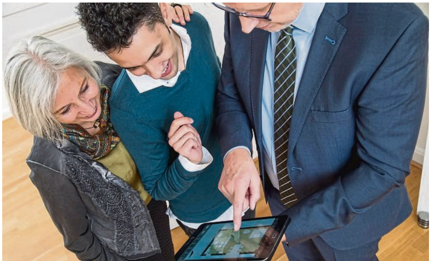
Nicht immer zeigt ein Grundriss die wirkliche Größe einer Wohnung.