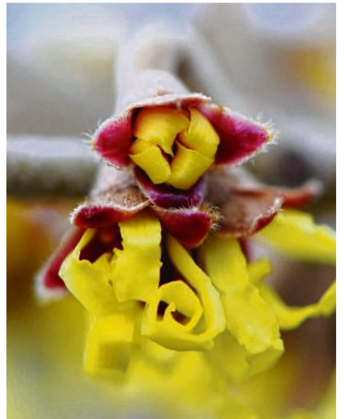
Ungewöhnliche Blüten hat die Zaubernuss.