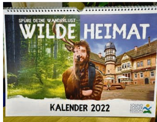
Der Kalender „Wilde Heimat“ zeigt Aufnahmen aus der Region Solling-Vogler.