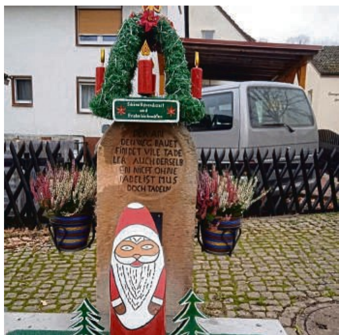
Festlich geschmückt: der Dorfbrunnen und die Begrüßungstafel in Rommerode.

Kreisfraktionen von SPD und Grünen schließen Gruppenvereinbarung