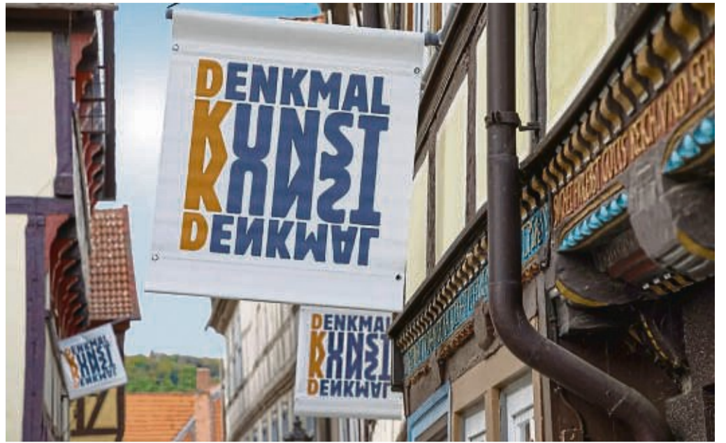
Mit „DKKD-Flaggen“ geschmückte Altstadt in Hann. Münden. Das Bild stammt aus dem Jahr 2019. 2022 ist es wieder so weit, das Kunstfestival soll im Oktober stattfinden.