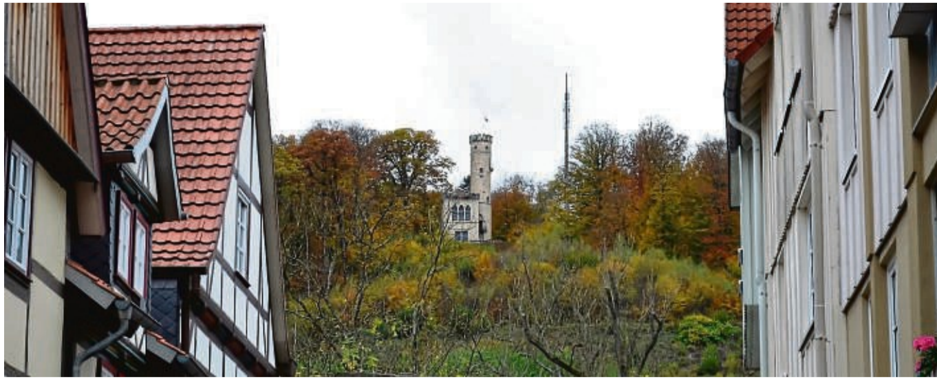
Die Tillyschanze von der Petersilienstraße aus gesehenen.