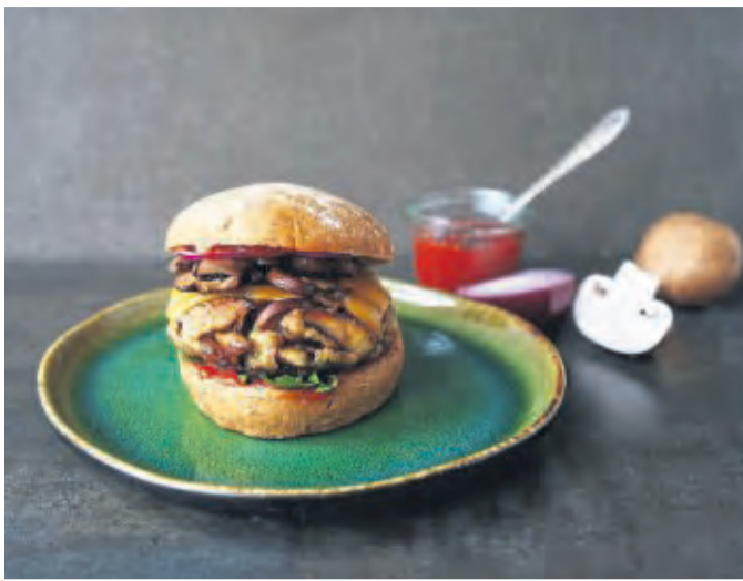
Krosse Burger aus braunen Champignons und Dinkel-Bulgur mit Cheddar und roten Zwiebelringen.

Die saftigen und krossen Pilzburger aus Dinkel-Bulgur mit in Knoblauch und Zwiebeln gebratenen Pilzscheiben, Blattpetersilie, Senf und Worcestershire-Sauce sind belegt mit würzigem Cheddar.