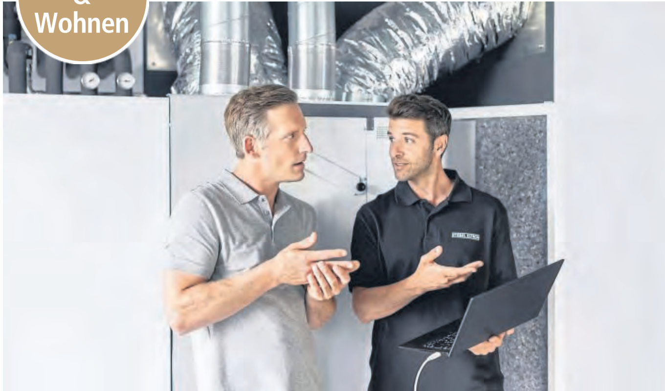
Effizient und umweltfreundlich heizen: Mit dem Umstieg auf eine Wärmepumpe können sich Hausbesitzer die seit Anfang 2021 geltende CO 2 -Abgabe sparen.