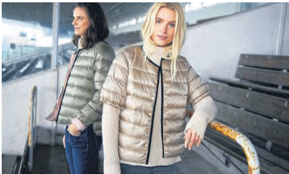
Kurze Ärmel an der Jacke haben einen Vorteil: Man sieht den Style darunter. Zu sehen etwa bei CC Heart von Coster Copenhagen.

Bekanntestes Padding-Beispiel ist die Daunenjacke - jetzt teils mit nur halblangen Armen. Aktuell angesagt sind aber auch die ärmellosen, dafür aber oft überschenkel- oder gar knielangen Steppwesten, gerne mit hohem Kragen. Mit diesen warmen Elementen „ist man auf der sicheren Seite“, beschreibt etwa H&M die eigene Westenkollektion, die natürlich auch wattierte Stücke enthält. „Aber manchmal möchte man den Look ohne die Är-