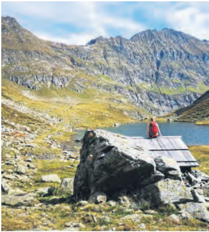
Im Unesco-Biosphärenpark Salzburger Lungau wartet echte Erholung auf aktive Entdecker.