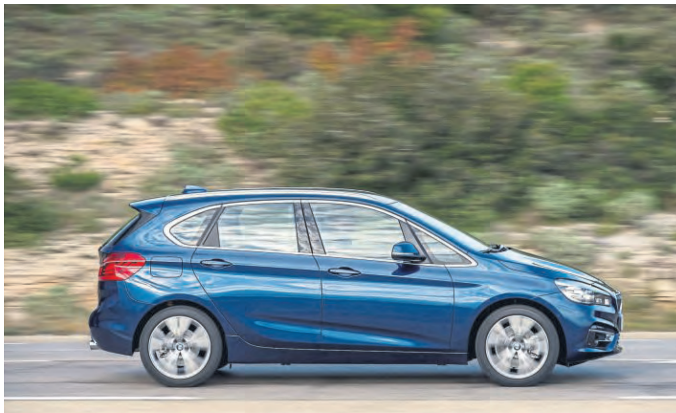
Hohes Dach, Frontantrieb und ab drei Zylinder: Für manche BMW-Fans war das Van-Konzept des 2er Active Tourers ungewohnt.

Karosserievarianten: Der BMW 2er Active Tourer ist ein fünftüriger Van. Die Version mit um elf Zentimeter