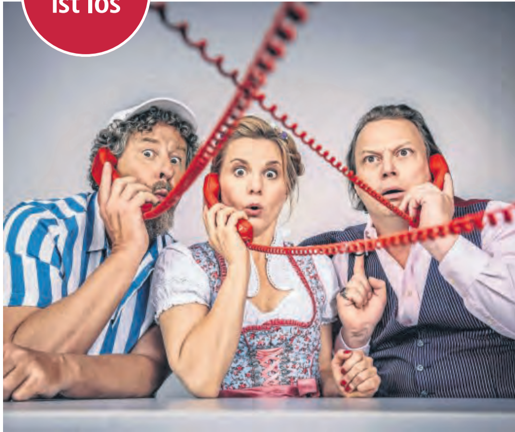
Skandal im Spreebezirk: Das Kabarett-Theater Distel stellt sein neues Programm in Gudensberg vor.