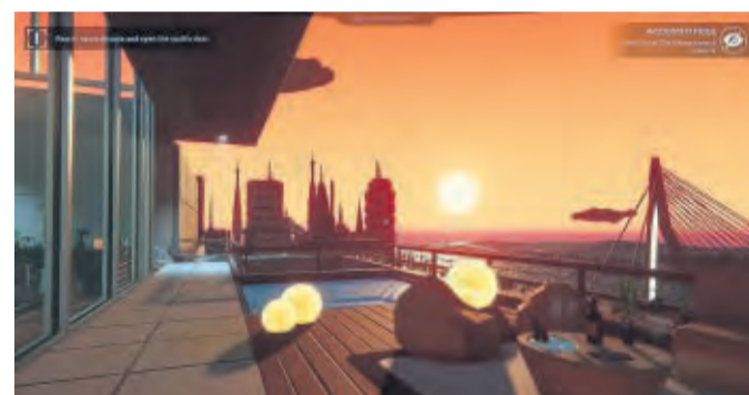
Schöne Aussicht: «Operation: Tango» ist farbenfroh und an vielen Stellen faszinierend detailliert gestaltet.

„Operation: Tango“: Escape-Room-Spaß für zwei