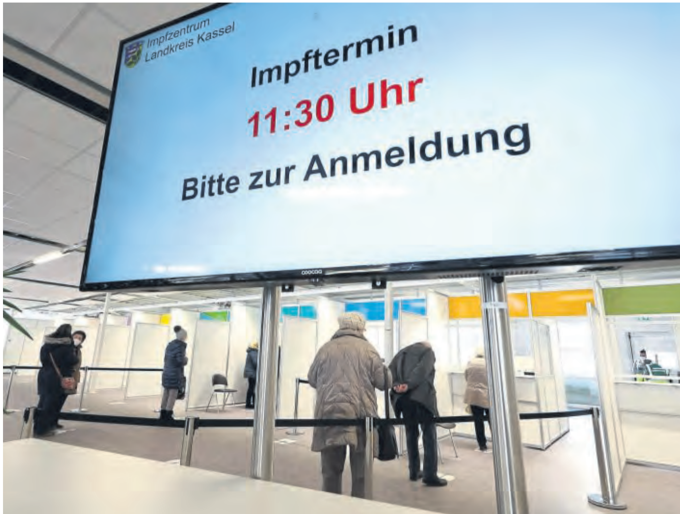
Das Caldener Impfzentrum: Ab Oktober wird dort nur noch mittwochs geimpft. Stadt und Kreis Kassel setzen vermehrt auf mobile Impfteams.

Und apropos mobile Teams: Die fahren in Stadt und Landkreis weiterhin Alten- und Pflegeheime sowie Behinderteneinrichtungen an, um dort bei den Bewohnern die ersten beiden Impfungen aufzufrischen. In Kas-