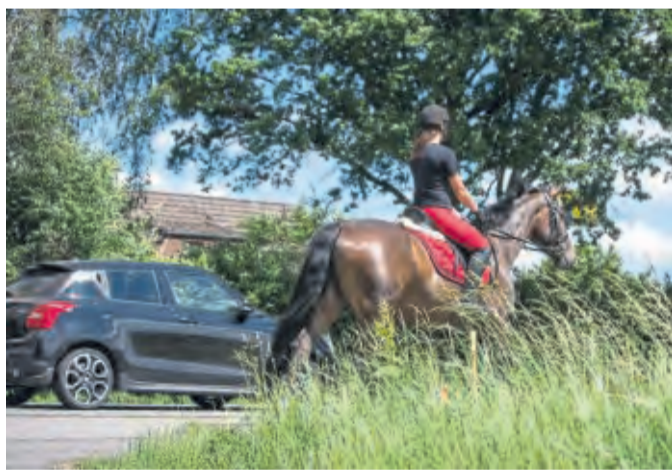
Bitte ganz vorsichtig: Mit möglichst viel Abstand und ohne Hupen geht es sicherer an Reitenden vorbei.