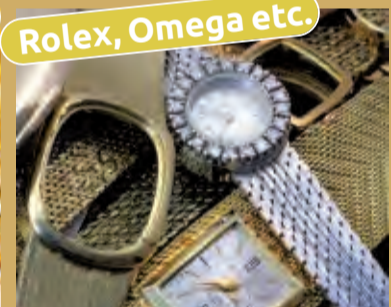
Rolex, Omega etc.