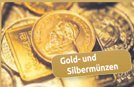
Gold- und Silbermünzen