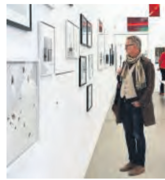
4. Kunstmesse Kassel: 80 Künstler werden dort ihre Arbeiten präsentieren.

Im letzten Jahr musste die Kunstmesse Kassel, die seit 2014 alle zwei Jahre stattfindet, coronabedingt abgesagt werden. Die Kunstmesse Kassel wird vom Kasseler Bundesverband Bil-