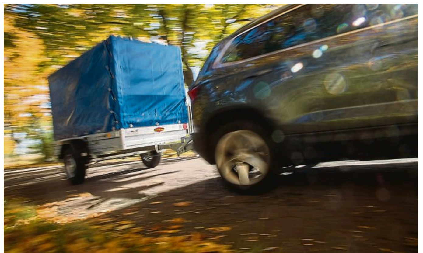
Flexible Raumerweiterung: Wer Sperriges transportieren will, kann über den Kauf eines Anhängers nachdenken.