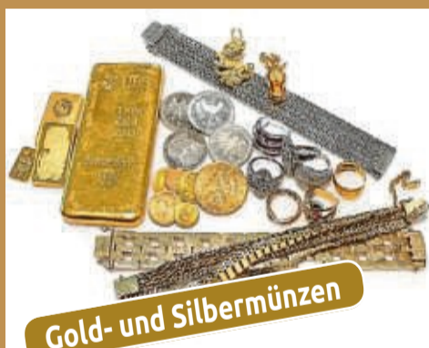
Gold- und Silbermünzen