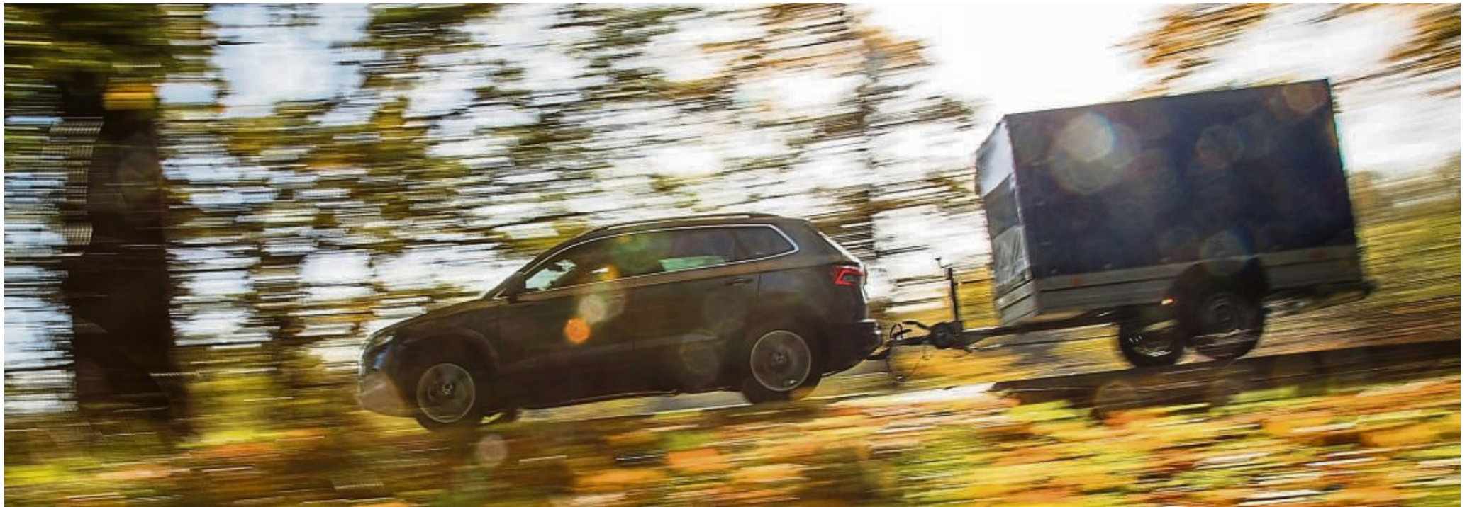
Bewegter Helfer am Haken: Ein Anhänger kann bei Umzug, Gartenpflege oder Großeinkauf ein nützliches Zubehör sein.