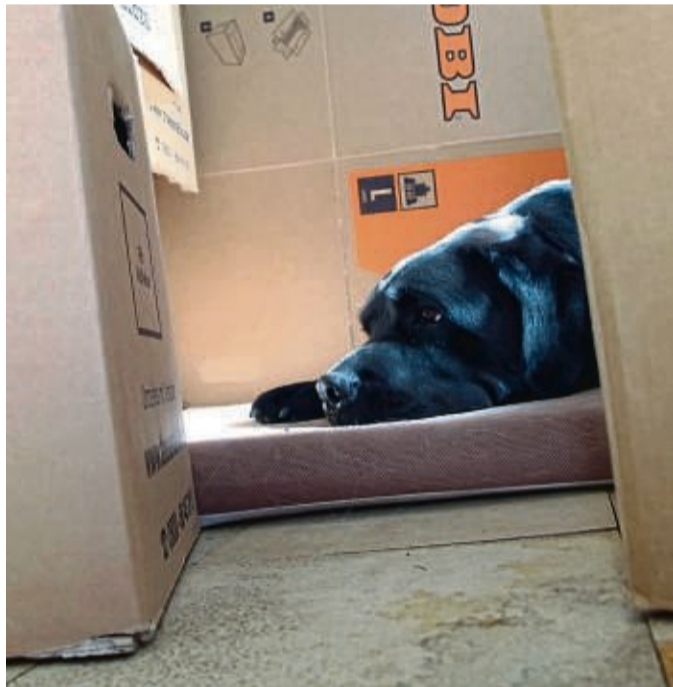
Es gibt Hunde, für die ist die Welt in Ordnung, wenn der Mensch da ist, auf den sie fixiert sind. Doch ängstliche Hunde haben Probleme, wenn sich mit dem Kisten packen die Umgebung relativ schnell verändert.