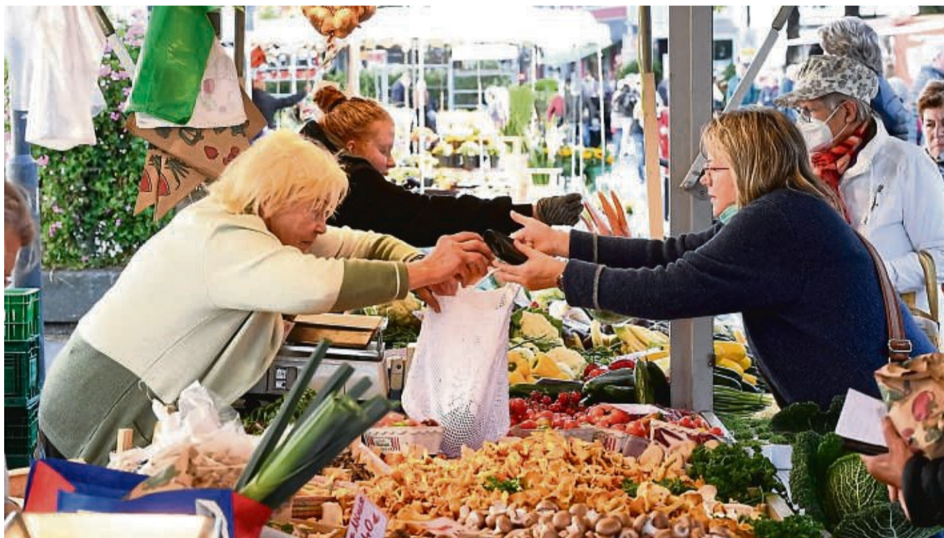
Frisches Gemüse im Angebot: Auch in Calden wünschen sich offenbar zahlreiche Menschen einen Wochenmarkt (hier ein Beispielbild aus Nordrhein-Westfalen).

„Es sollen regionale Landwirte sowie Handwerker und Freikünstler wie Floristen oder Glaskünstler Produkte anbieten können, während beispielsweise junge Nachwuchskünstler aus der Gemeinde für Unterhaltung sorgen und Besucher eine Kleinigkeit essen oder trinken.“ Neben Regionalität wurden von den Befragten Nachhaltigkeit und Einzigartigkeit als wichtige Aspekte genannt: Beispielsweise wurde der