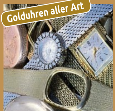
Golduhren aller Art