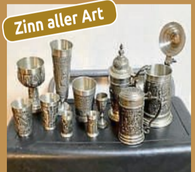
Zinn aller Art