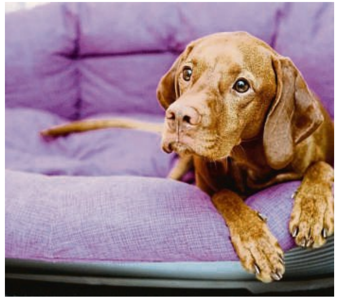
In der neuen Wohnung sollte der Hund schon beim Hereinkommen etwas Vertrautes finden, etwa eine Möbelkonstellation mit seinem Körbchen.

Und aus Sicherheitsgründen schade es nicht, vorher den nächsten Tierarzt zu googeln, „damit ich weiß, wo ich anrufen kann, wenn mal etwas passiert“, meint der Hundetrainer.