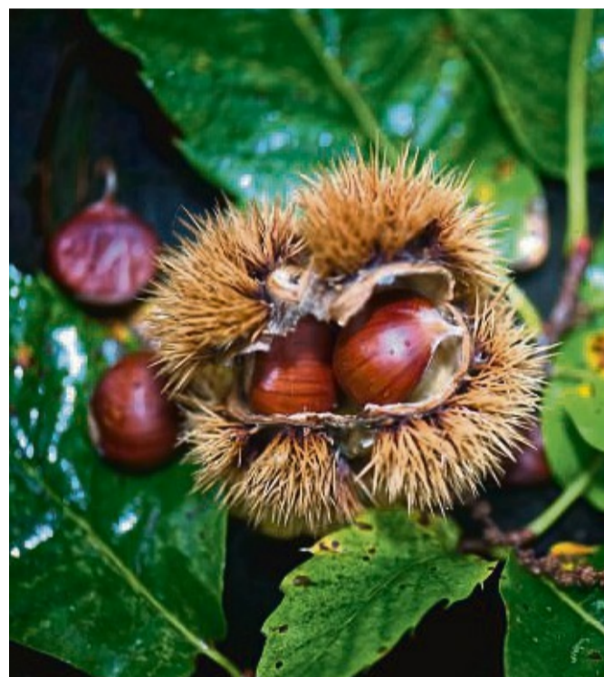
Für Sammler ist wichtig, dass nur die Esskastanie auf dem Teller landet. Gut erkennbar sind die Unterschiede an der äußeren Hülle: Während bei der Esskastanie die Stacheln dicht an dicht sitzen, sind die Abstände der Stacheln bei der Rosskastanie deutlich größer.

Ist die Konsistenz mehlig und schmeckt die Kastanie süß, können alle Kastanien geschält werden. Das geht am besten, wenn man die Kastanie auf der flachen Seite mit einem spitzen Küchenmesser quer zur Spitze kurz unterhalb des Pinselchens einsticht und die Schale herun-