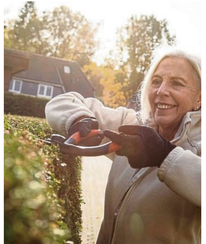
Nach dem Bundesnaturschutzgesetz ist es von Anfang Oktober bis Ende Februar erlaubt, Hecken, lebende Zäune und andere Gehölze stärker zu schneiden.

Und selbst bei Hecken und Strukturgehölzen wie japanischer Ahorn und Mahonie rät Haas dazu, die Sträucher nicht in eine bestimmte Optik zu zwingen, sondern dem natürlichen Habitus zu folgen. „So kann sich die Pflanze dicht verzweigen und fällt auch bei zu viel Schneedruck nicht auseinander“, so der Garteningenieur. tmn