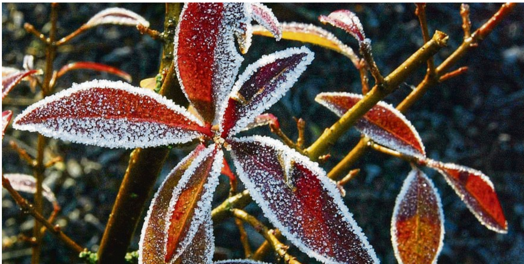
Das Erfrieren droht vielen immergrünen Gartenpflanzen im Winter nicht. Aber sie können bei Frost verdursten.

Die Pflanzen verdursten in der Folge. Vor allem Topfpflanzen sind betroffen. Ihr Boden friert im Gefäß schnell komplett durch. Aber auch Gartenpflanzen leiden Durst.