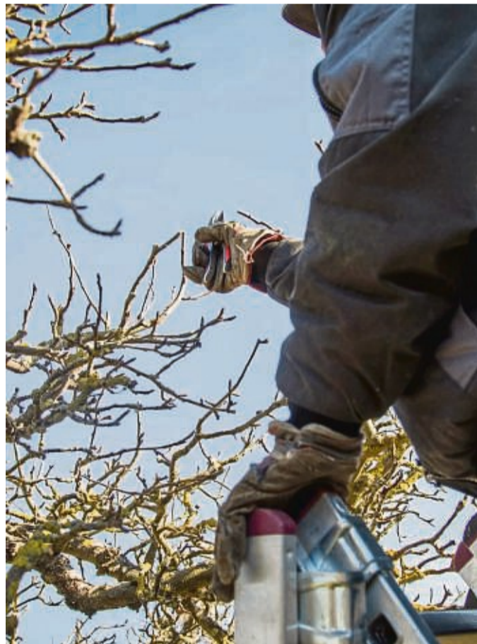
Die einen tun es noch im Herbst, die anderen im Winter. Mancher schwört auch auf das Frühjahr für den Gehölzschnitt.