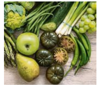
Gemüse und Obst sind immer Bestandteil einer ausgewogenen Ernährung.

Die Kosten für einen Stoffwechsel-Test liegen – je nach Anbieter – bei rund 150 bis 300 Euro. Wie der Preis ausfällt, hängt auch davon ab, ob ein persönliches Ernährung-coaching inbegriffen ist oder