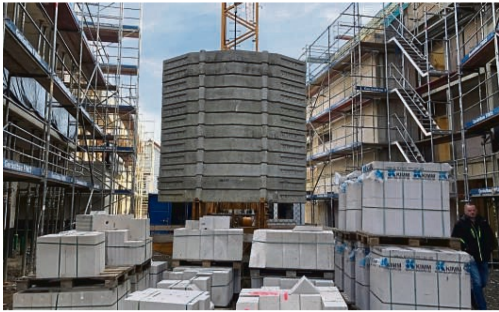
Fertigstellung der Wohnanlage verzögert sich: Statt Frühjahr wird es nun Sommer 2022. Neben Wohnungen bauen die Kommunalen Versorgungskassen in Ehlen für den ASB eine Tagespflege, Praxis- und Gewerberäume.

In Ehlen bauen die KVK 20 barrierefreie Wohnungen, die sich auf alle vier Häuser verteilen und die für neun