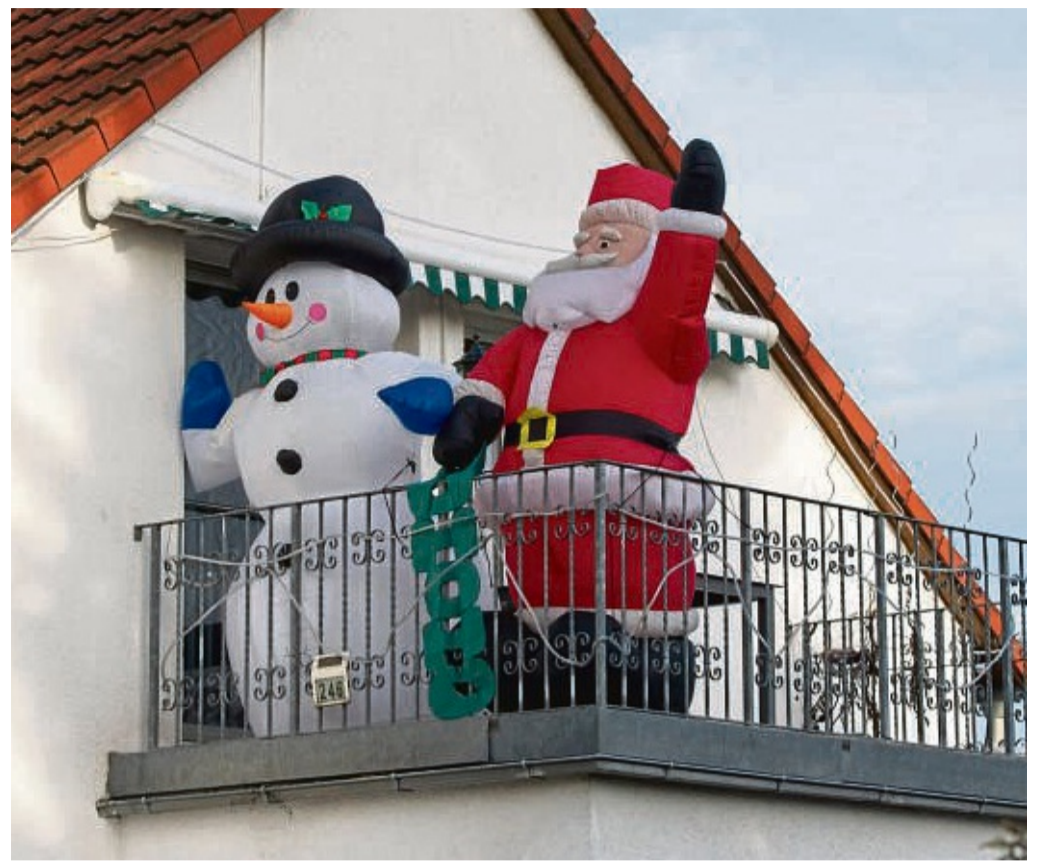
Wer riesige Deko auf dem Balkon aufstellt, muss dafür sorgen, dass sie gut gesichert ist.

Erst wenn die Beleuchtung zu starke Auswirkungen auf die Nachbarn hat, können