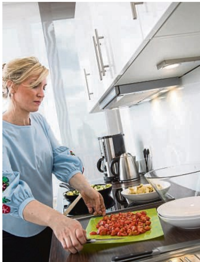
Was bekommt mir wann am besten? Ernährungspläne auf der Basis von DNA-Analysen sollen Antworten liefern.