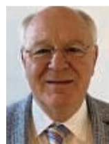
Geschäftsführer der Pflege am Markt GmbH