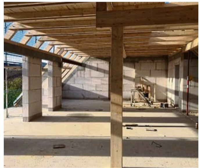
Im Rohbau: Eine der 20 Wohnungen, die zwischen 47 und 116 Quadratmetern groß sein werden.

Derzeit erfolgen in Ehlen die letzten Arbeiten am Rohbau. Im Januar beginnt der Innenausbau. Drei Monate vor Abschluss des Projekts schließt die KVK mit den Mietern die Verträge. Es werde eine Liste geführt, auf der schon einige Namen stünden, für die sich Interessenten aber auch noch melden könnten. „Die meisten Anfragen kommen tatsächlich aus Habichtswald“, so Bergmann. Aber das passe auch gut ins Konzept der KVK, die etwas dafür tun wollen, dass Menschen auch im Alter in ihren Heimatorten bleiben können.