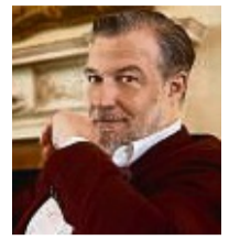
Schlagersänger Marc Marshall

Das Programm beim Weihnachtskonzert umfasst traditionelle Weihnachtslieder und weihnachtliche Texte. Auch Lieder, die Familie und Freundschaft ehren, werden erklingen. Wie bei der Weihnachtstournee des vergange-