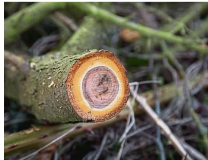
Wann eine Pflanze zurückgeschnitten wird, hat Einfluss auf ihre Entwicklung.

Briefmarken • Gold • Münzen Ansichtskarten, Schätzung, Beratung An- u. Verkauf • Dr. Rohde & Kornatz, Treppenstr. 13, Kassel, Tel.: 05 61 - 1 62 17