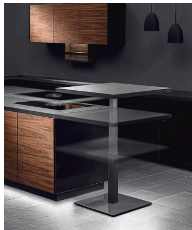
Viele Küchenmöbel-Hersteller haben zur Optik der Küche passende Wohnmöbel im Programm. Auch hier kommen nun zusätzliche Schreibtische unter.