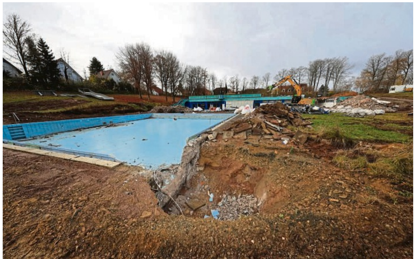
Das Nichtschwimmerbecken bleibt als Grundlage für das neue, größere Beckens erhalten. Es bekommt einen Folienboden, der weniger Probleme als Fliesen machen soll.

Der Zuschuss aus dem Programm Investitionspakt Sportstätten 2020 von Bund und Land Hessen bleibt un-