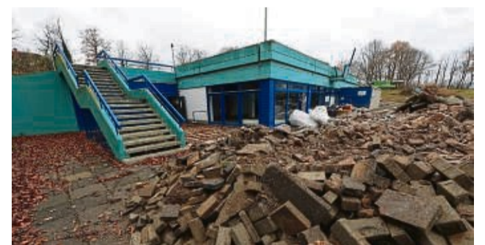
Das alte Gebäude unterm Schwimmerbecken wird weitgehend abgebrochen. Vorne liegt ausgebautes Pflaster.

verändert bei 4,05 Millionen Euro, der geförderte Anteil verringert sich dadurch laut