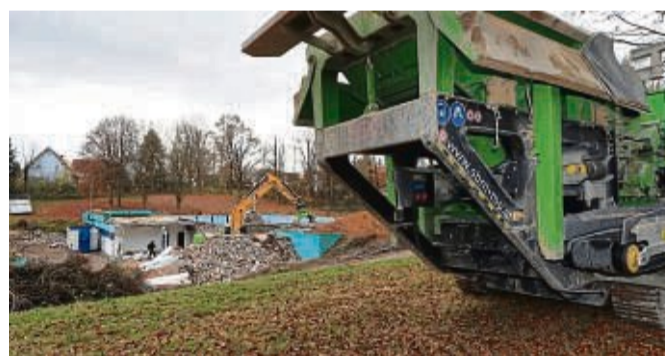
Eine Schreddermaschine steht schon bereit, um die Betonreste aus dem Schwimmbad zu zerkleinern.