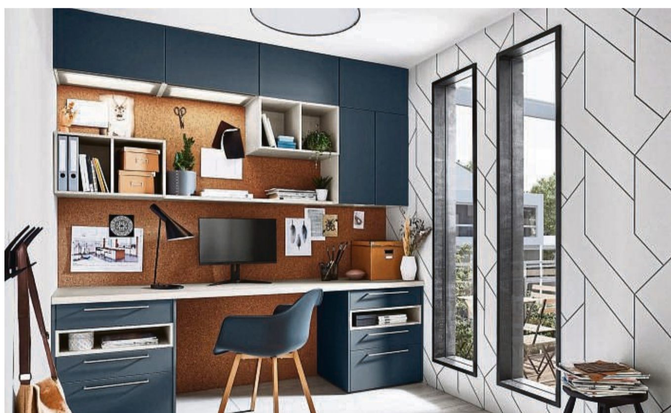
Mit Küchenmöbeln lässt sich auch eine Arbeitsnische mit viel Stauraum einrichten.

Diese Ideen der Branche sind recht neu, lassen sich aber meist mit den bestehenden Küchenelementen im Handel umsetzen. Ein paar Beispiele: Man kann die Arbeitsplatte einer Küchenzeile seitlich über die Unterschränke hinaus verlängern und schafft so eine integrierte Schreibtischplatte. Wer eine große Küche neu plant, kann auch in der Zeile selbst auf ein, zwei Unterschränke verzichten und erhält so Fußraum für einen Stuhl an der Zeile, lautet ein Tipp der AMK. Die Alternative: Man montiert auf einem Unterschrank einen sogenannten