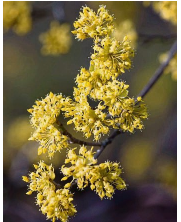
Ungewöhnliche und wunderschöne Blüten hat die Zaubernuss. Sie erblüht im Garten bereits zum Winterende – und im Haus schon zu Weihnachten.