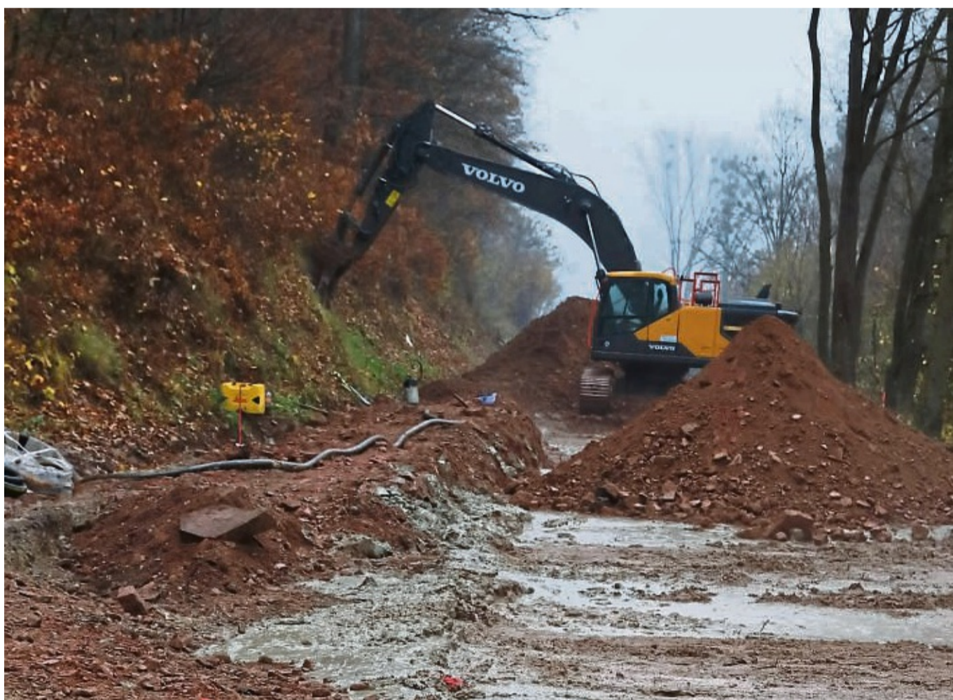
Die Arbeiten gehen weiter: Per Bagger wird der Untergrund gelockert, mit dem durch Hochdruckschläuche (Bild) gepumpten Flüssigbeton gründlich vermischt und wieder eingebaut.

Dabei werden bis zu fünf Meter tiefe Erdbetonblöcke erzeugt, mit denen der Fahrbahnuntergrund gestützt wird.