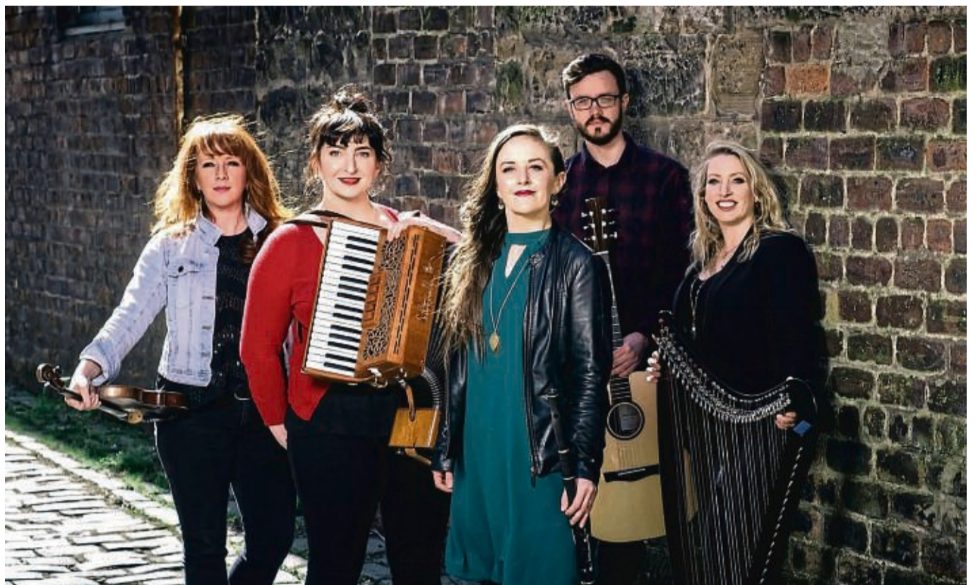
The Outside Track: Die Musiker bringen stimmungsvolle keltische Musik auf die Bühne.

AUFGEPASST !!! 20% Coronarabatt !!! Werbewochen bei Firma Stieb, Kassel: Flachdachsaniierung und Innenausbau, Dach- und Fassadensaniierung, auch Dachreparaturen und Dachbeschichtung. Wir freuen uns auf Ihren Anruf! Tel. 0172-5625766 - Büro 0561-51058961