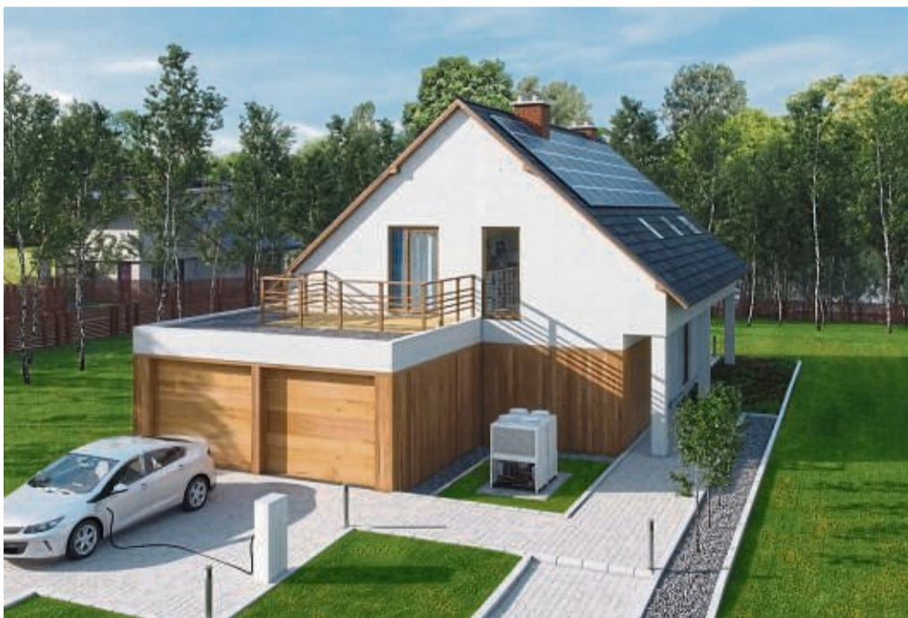
Beim Bau eines neuen Hauses spielt nicht nur der Energieverbrauch, sondern auch die Wahl der Baumaterialien eine wichtige Rolle für die Klimafreundlichkeit.

Kupfer ist in der Hausinstallation vielseitig zu verwenden. Es ist zuverlässig und langlebig im Trinkwassersystem einsetzbar und schützt die Qualität des Trinkwassers. In der Heizungsinstallation wird es ebenfalls häufig verbaut. Kupferrohre sind Standardprodukte, die Installateure seit Jahrzehnten verarbeiten. Wartungs- und Erweiterungsarbeiten werden auch in der