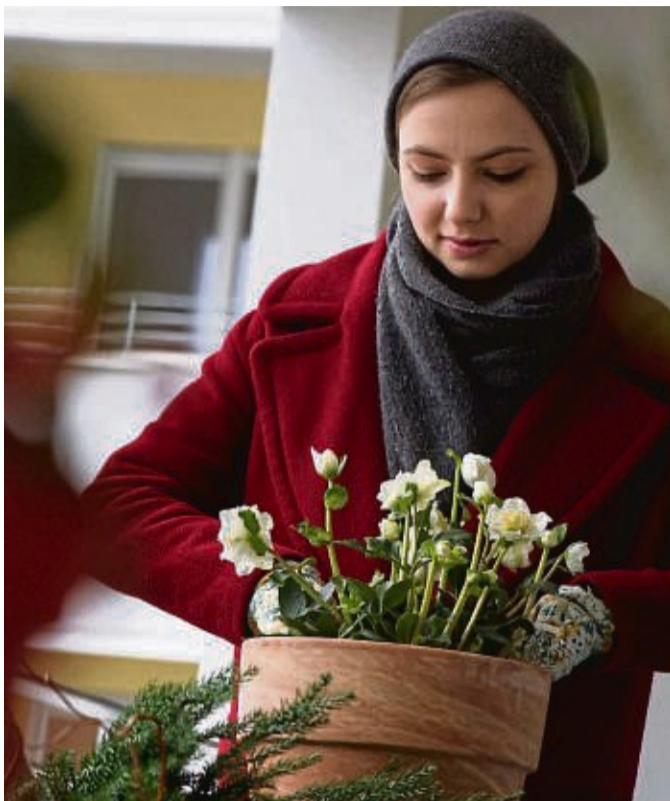
Die winterharten Christrosen können auch im Topf draußen gedeihen.

Christrosen können 30 Jahre und mehr im Garten wachsen. Man sollte ihnen aber bei der Pflanzung im Herbst und Winter etwas bieten: „An der Pflanzstelle sollte das Erdreich humos, leicht durchlässig und alkalisch sein“, rät die Staudengärtnerin Svenja Schwedtke. Josef Heuger