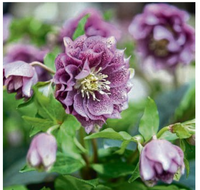
Nicht nur in Weiß: Die Pflanzen der Gattung Helleborus hat Blüten in vielen Farben.