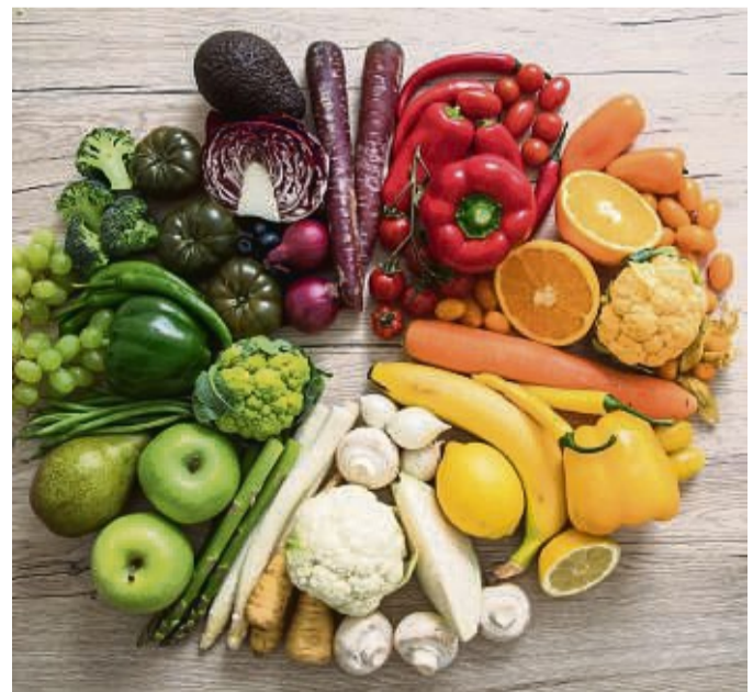
Der erhöhte Verzehr von rohem Obst und Gemüse gehört zu den Pluspunkten der Trennkost.