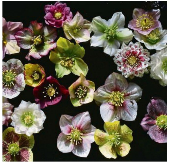
Ein Deko-Tipp: Die Blüten von Christ- und Lenzrosen im Wasser schwimmen lassen.

Für die Wohnung bieten sich die Pflanzen ja nicht an - dafür aber ihre einzelnen Blüten. „Die gestielten Blüten halten nicht gut in der Vase, aber ganz kurz abgeschnitten und in einer Schale zum Schwimmen ausgelegt sind sie wirklich bezaubernd“, sagt Svenja Schwedtke. tmn