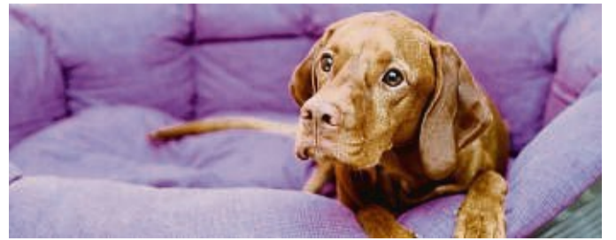
In der neuen Wohnung sollte der Hund schon beim Hereinkommen etwas Vertrautes finden.

Umzug bedeutet Stress. Nicht nur für Menschen, sondern auch für ihre Hunde. Experten erklären, wie man den Vierbeinern den Wechsel in die neuen vier Wände erleichtern kann.