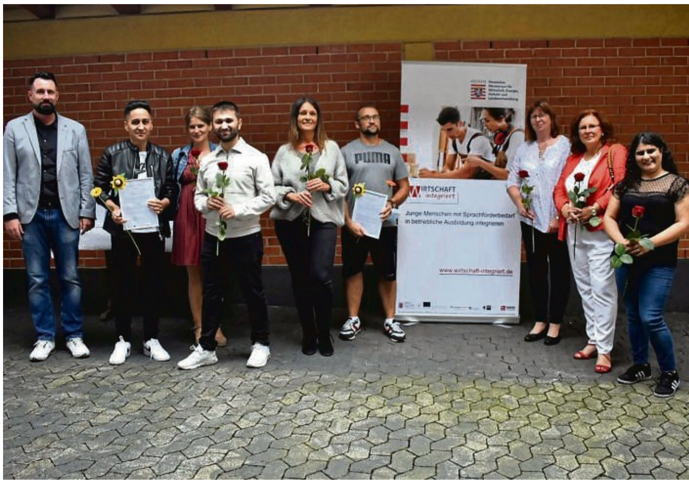
Das Projekt „Wirtschaft integriert“ besteht seit fünf Jahren. Nun wurden sieben erfolgreiche Absolventen geehrt.