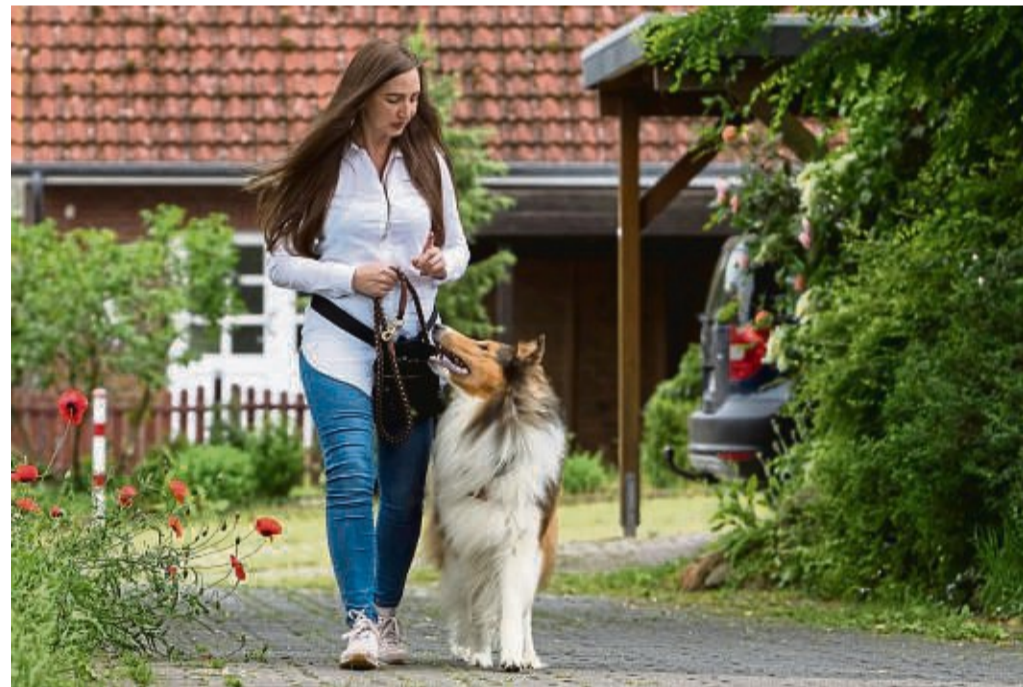
Empfindlichen oder ängstlichen Hunden kann es helfen, bereits vor dem Umzug einige Spaziergänge in der neuen Umgebung zu unternehmen, damit er nach dem Umzug etwas Vertrautes vor Ort findet.