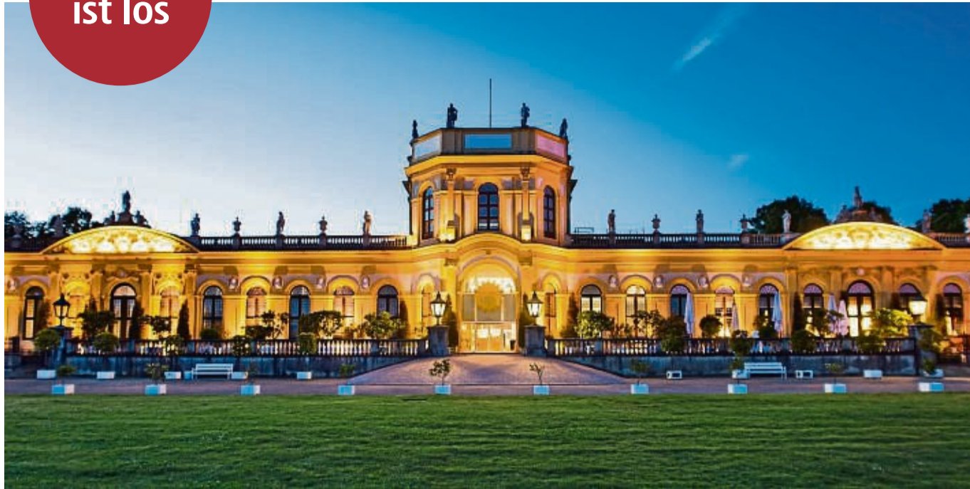
Premiere: Erstmals findet der Winterzauber an der Orangerie in Kassel statt.