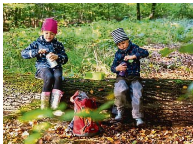
Bei sportlichen Aktivitäten oder beim Spielen vergessen Kinder schnell, etwas zu trinken. Eltern sollten deshalb auf eine regelmäßige Flüssigkeitszufuhr achten.