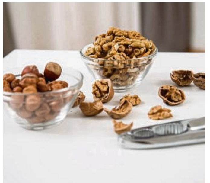
Nüsse können für kleine Kinder gefährlich werden.