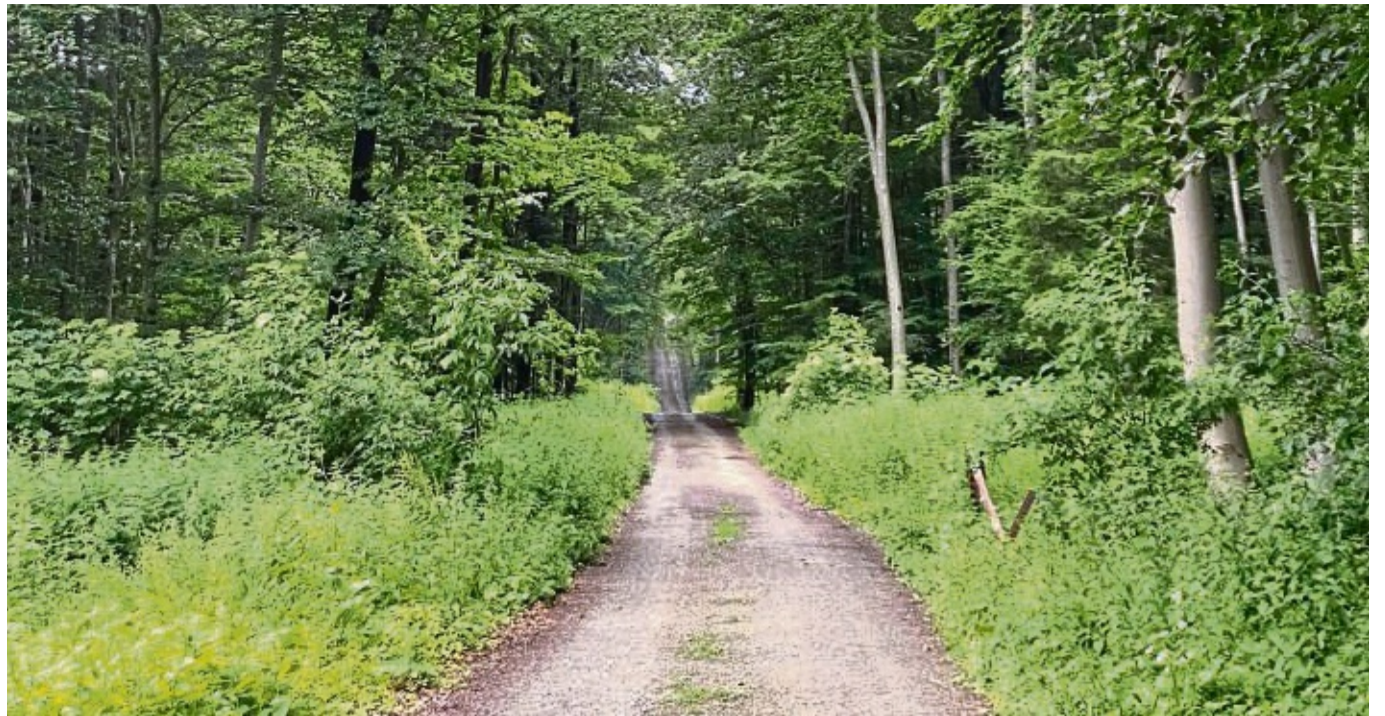
Breuna gehört jetzt zu den Klima-Kommunen: Eine zentrale Plattform soll die Kommunen zusammenbringen. Dort können sie sich beraten lassen und informieren. Das Bild zeigt ein Waldstück beim Sportplatz.