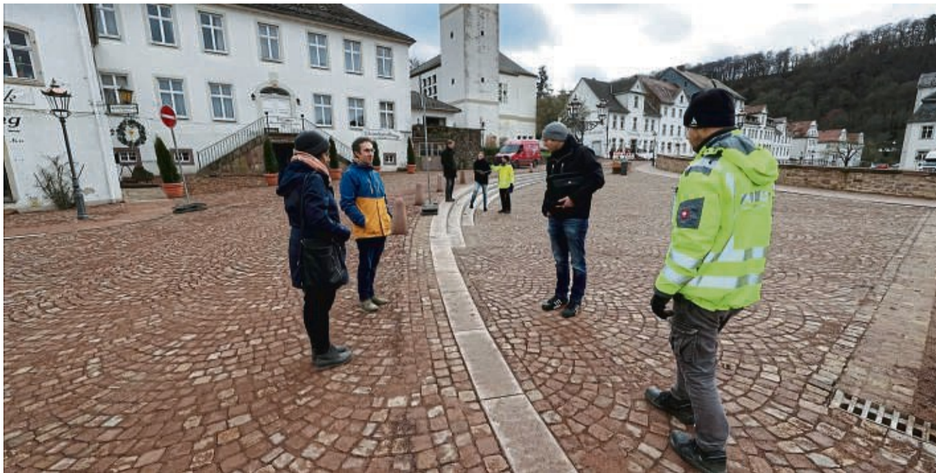
Umgestaltet: Im erneuerten Hafenumfeld in Bad Karlshafen hat sich einiges geändert, auch die Straßenführung. Die Straße am Hafenplatz (links) ist nur noch einspurig, rechts ist eine Veranstaltungsfläche durch Stufen abgetrennt.

Umbau Bad Karlshafens nach fast zehn Jahren beendet