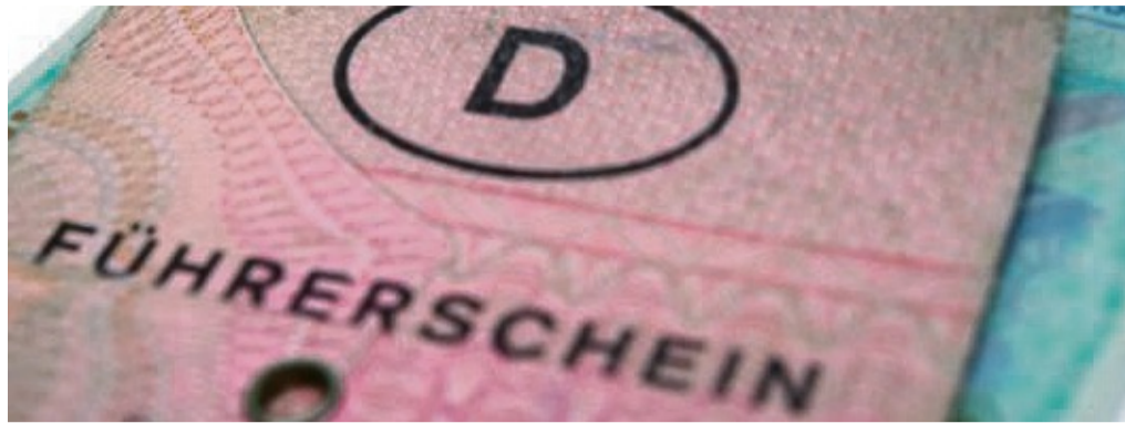
Tschüss alte Papiere , heißt es für viele Autofahrer. Die ersten Fristen laufen Anfang des kommenden Jahres ab.

Kreisteil Hofgeismar – Die Geburtsjahrgänge von 1953 bis 1958 müssen ihre alten Führerscheine bis spätestens zum 19. Januar 2022 gegen einen neuen eintauschen. Der Grund: eine Vereinheitlichung der Führerscheine. Diese soll bis 2033 erfolgen, sodass nur noch fälschungssichere Fahrerlaubnis-Dokumente im Umlauf sind. Um großen Andrang bei den Führerscheinstellen zu vermeiden, wird dies in Stufen durchgeführt. Konkret geht es um bis 1998 ausgestellte (Papier-)Führerscheine sowie um von 1999 bis 18. Januar 2013 ausgegebene Scheckkartenführerscheine, die umgetauscht werden müssen. Viele Führer-