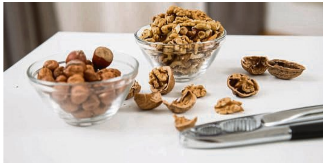
Nüsse können für kleine Kinder gefährlich werden.