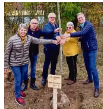
Ein Rotahorn wurde gepflanzt.

Vielleicht schließen sich ja noch weitere Abschlussklassen der Heinrich-Gruppe-Schule dieser nachhaltigen Aktion nach Rücksprache mit der Stadt Grebenstein an, hoffen die Ex-Schüler.