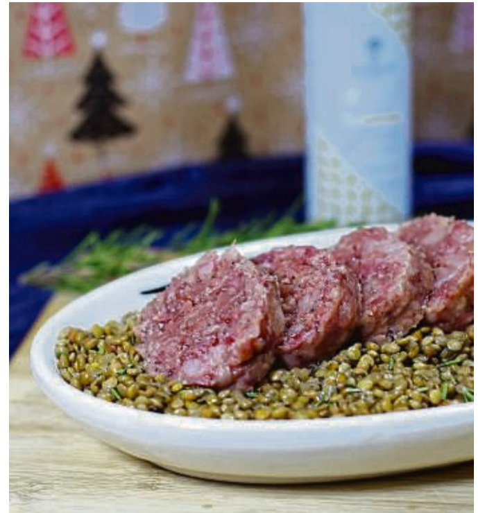
Cotechino mit Linsen: ein Weihnachts-Klassiker in Italien.