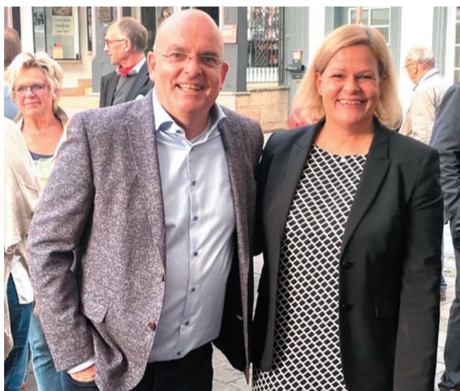
Die hessische SPD-Landesvorsitzende Nancy Faeser war auf Einladung des Bundestagsabgeordneten Dr. Edgar Franke zu Gast in Fritzlar auf dem Marktplatz.

Fritzlar. Ungezwungen bei kühlen Getränken mit interessierten Bürgerinnen und Bürgern ins Gespräch zu kommen, war das Ziel des Besuchs der hessischen Landesvorsitzenden Nancy Faeser in Fritzlar. Aufgrund der Witterung waren zwar die Schirme vor dem Café Hahn aufgespannt - der guten Laune tat das aber keinen Abbruch, ganz im Gegenteil: Die SPD mit Olaf Scholz ist wieder da, war das Credo von Faeser. Sie nutzte den Besuch auf dem Marktplatz auch, um SPD-Mitglieder, die zuletzt Mandatsträger in der Dom- und Kaiserstadt waren, zu ehren. Bundestagsabgeordneter Dr. Edgar Franke sei „nah bei den Menschen“, fand Faeser. Er suche stets den direkten Kontakt zu den Menschen im Wahlkreis. „Er ist der Anwalt der Menschen in der Region“, stellte Faeser fest, die auch die SPD-Fraktionsvorsitzende im Hessischen Landtag ist. Zudem habe sich Franke nicht nur als Gesundheitspolitiker, sondern auch als Opferbeauftragter der