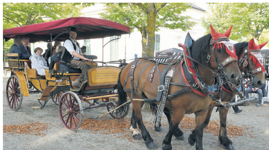
Stilecht mit Kutsche fahren einige Gäste zum Ballsaal vor.