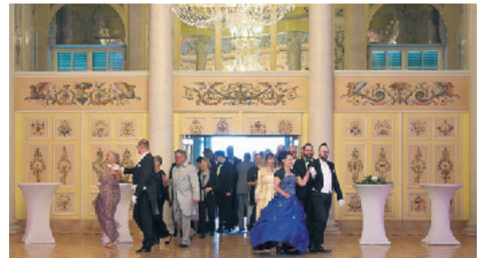
Aus ganz Deutschland kamen insgesamt über 100 Tänzerinnen und Tänzer nach Kassel zur Ballnacht.