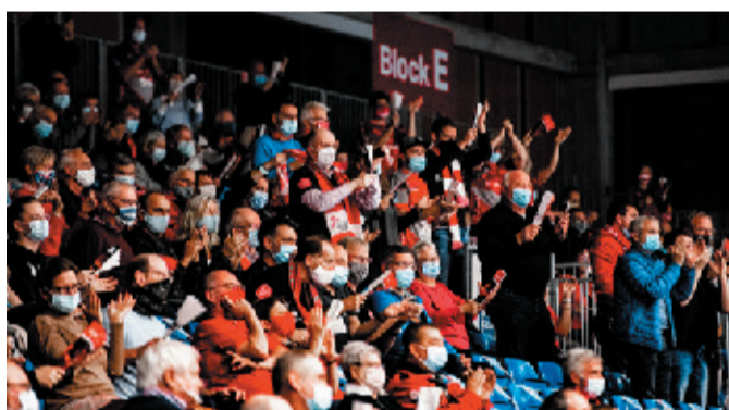
Kommen zum Saisonstart der MT Melsungen 4.300 Zuschauer in die Kasseler Rothenbach-Halle?

Kassel. Die Heimspielpremiere der MT Melsungen in der neuen Saison der Handball-Bundesliga steigt am 11. September. Dazu begrüßen die Rotweißen mit dem THW Kiel als Gegner gleich einen absoluten Hochkaräter. Die weitere gute Nachricht für alle Fans: Nach den geltenden Pandemievorgaben in Verbindung mit der von der MT vorgesehenen 2-G-Regelung (Geimpft oder Genesen) dürfen dann alle 4.300 Plätze in der Kasseler Rothenbach-Halle besetzt werden. Fakt ist, die Spiele dürfen wieder vor Hallenpublikum stattfinden. Auf Länderebene wurden kürzlich die Rahmenbestimmungen festgelegt. Danach darf in Arenen mit einer Kapazität von bis zu 5.000 Plätzen diese Anzahl gemäß der 3-G-Regelung ausgeschöpft werden, sofern sie den Hygiene und Sicherheitsbestimmungen des lokalen Gesundheitsamtes genügen.