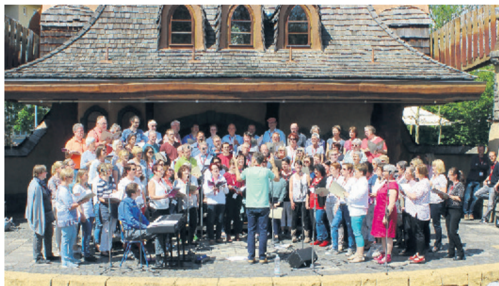
2019 war die Märchenbühne beim Chorworkshop prall gefüllt. Auch 2021 darf gesungen werden, aber mit Abstand und Hygieneregeln.