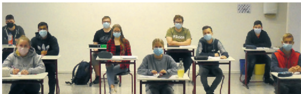
Die Schülerinnen und Schüler des Englischkurses an der RFES.