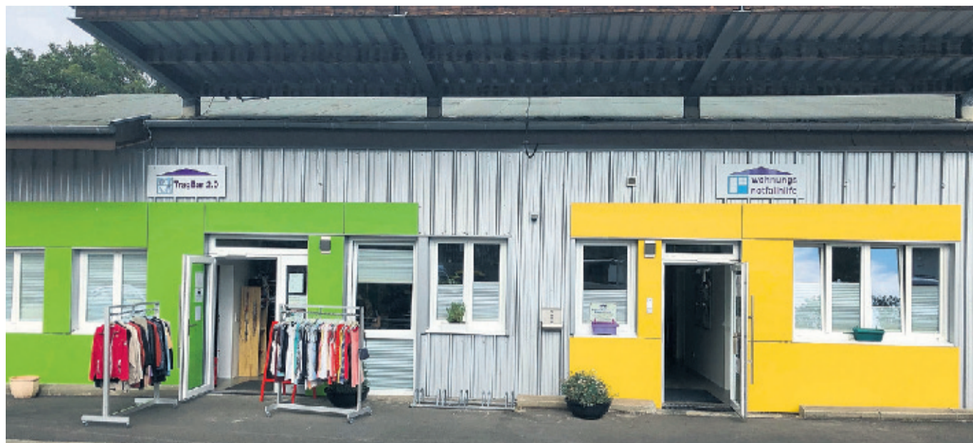
In der Wohnungsnotfallhilfe in der Steinmühle 1a in Fritzlar gibt es für interessierte Bürgerinnen und Bürgern am 10. September einen Tag der Offenen Tür.