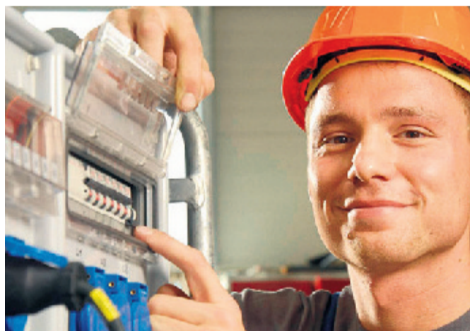
Lernen kann man sein ganzes Leben lang. Wer es bisher versäumt hat, eine Berufsausbildung zu absolvieren, muss den Kopf nicht in den Sand stecken. Es gibt viele Möglichkeiten, im Berufsleben dennoch anzukommen und sich weiterzuentwickeln. Und nicht vergessen: Die Agentur für Arbeit weiß Rat.

Sicher, mit den bestbezahlten Berufen für Hochqualifizierte können diese Jobs nicht mithal-