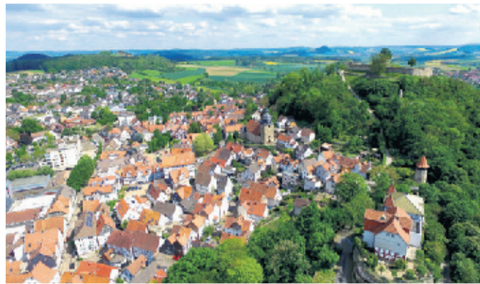
Vor 900 Jahren wurden Gudensberg zum ersten Mal in den Geschichtsbüchern erwähnt. Entlang des Lesepfades in der Altstadt sind Schlaglichter der Stadtgeschichte beleuchtet.