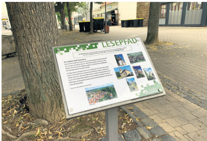
Der Lese- pfad in der Altstadt wurde mit neuen Texten vom Gudensberger Heimatverein bestückt.

Eine Führung mit fachkundiger Begleitung über den neu bestückten Lese- pfad findet am Samstag, 11. September, um 18 Uhr, Treffpunkt Rathaus (Schweinebrunnen, Untergasse) statt. Die Kosten pro Person betragen 2 Euro und werden vor Ort beglichen.