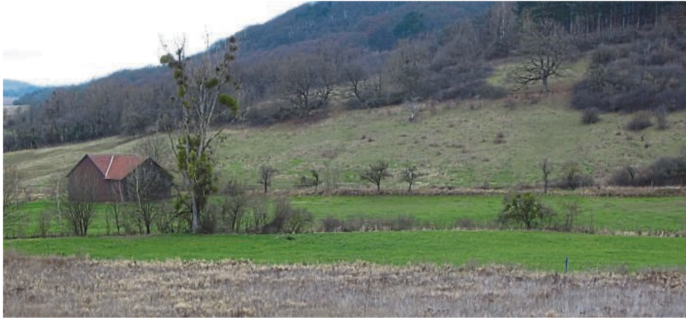
Wirtschaftlich kaum zu nutzen: Steile, trockene Wiesen wie hier in Scheden drohen zu verbuschen.

Ökologische Station soll Pflege der Biotope im Landkreis Göttingen sichern