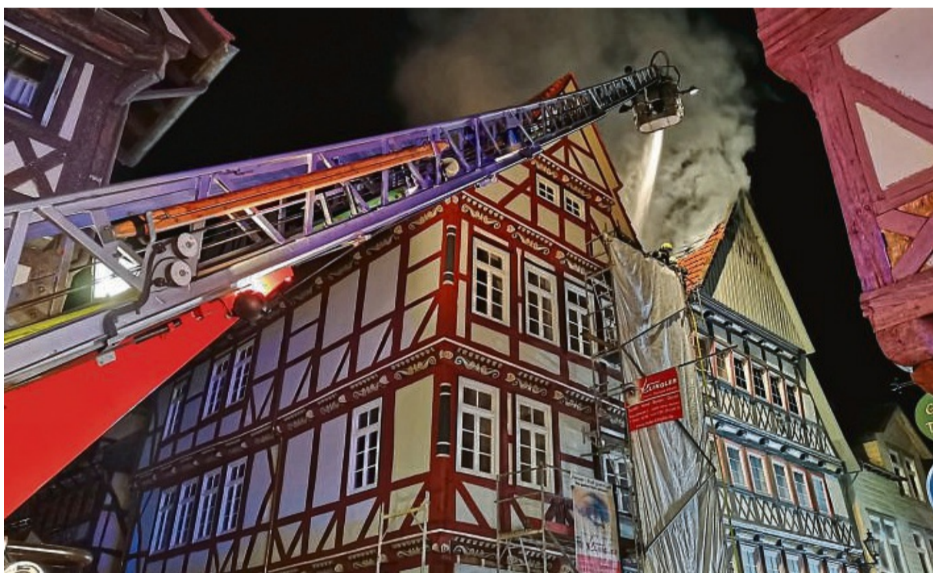
Im März 2020 brach das Feuer im Haus an der Tanzwerderstraße aus.