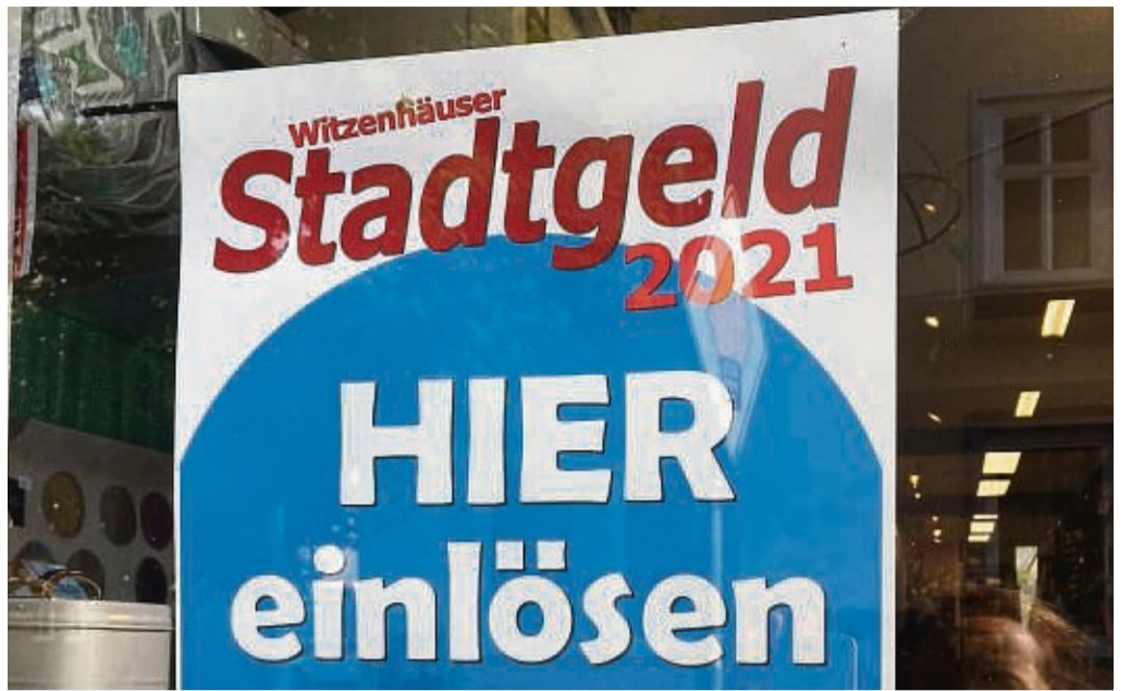
Kommt 2022 zurück: Das Stadtgeld Witzenhausen lockt dann auch mit Bonus-Systemen.

306 000 Euro in der Kirschenstadt umgesetzt