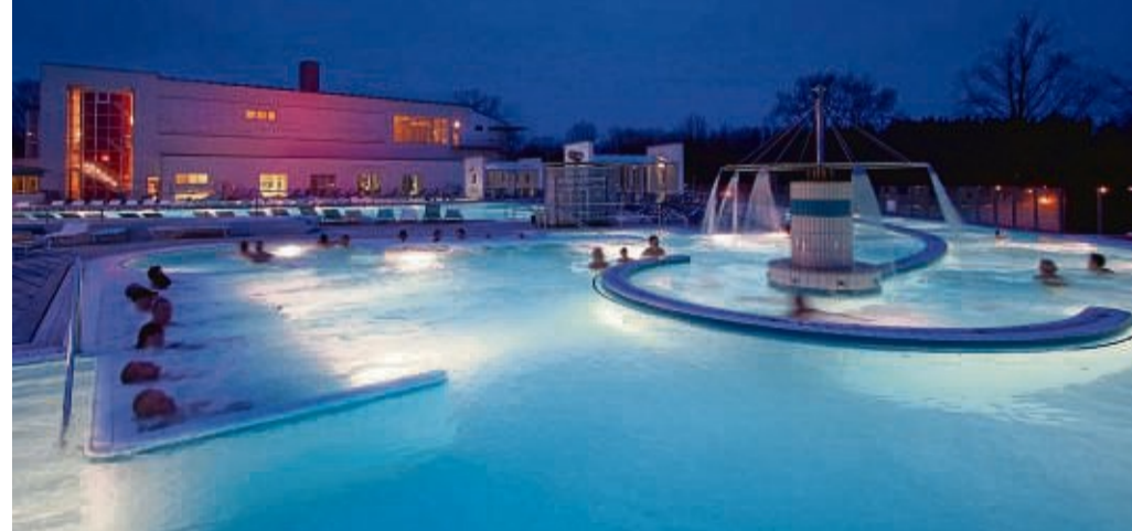
In den Heilbädern im Passauer Land können Erholungssuchende durchatmen und ihre Gesundheit stärken.

Immunsystem sorgen zudem Salzgrotten und Saunaland-schaften. Online finden Interessierte alle Informationen zur niederbayerischen Region, darunter Tipps für Frischluftaktivitäten in der tief verschneiten Natur. djd-k passauer-land.de