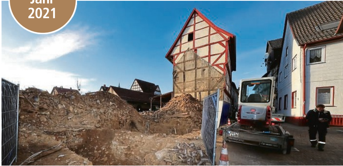
Die beiden abgebrochenen Häuser an der Apothekenstraße in Hofgeismar waren nur teilunterkellert. Der Baugrund ist in der gesamten Altstadt schwierig. Das denkmalgeschützte ehemalige Lagerhaus (Mitte) soll erhalten und zu Wohnungen umgebaut werden.