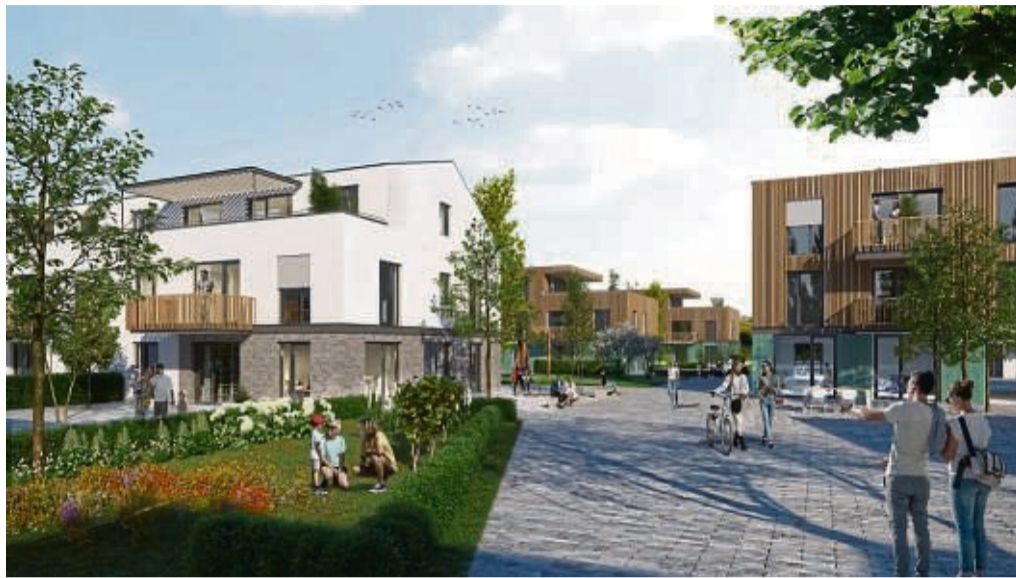
Investor ist gefunden: Laut Bürgermeister Maik Mackewitz soll der Wohnpark Wilhelmsthal 1 in Calden ein echtes Sahnestück des Ortes werden.

Ob ältere Eheleute oder junge Pärchen – der Wohn-