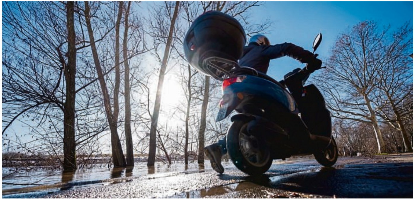
Rutschige Angelegenheit: Wer im Winter auf seinen Motorroller angewiesen ist, muss stets den aktuellen Zustand der Fahrbahn beobachten - und notfalls absteigen.

AUFGEPASST !!! 20% Coronarabatt !!! Werbewochen bei Firma Stieb, Kassel: Flachdachsanieerung und Innenausbau, Dach- und Fassadensanieerung, auch Dachreparaturen und Dachbeschichtung. Wir freuen uns auf Ihren Anruf! Tel. 0172-5625766 • Büro 0561-51058961