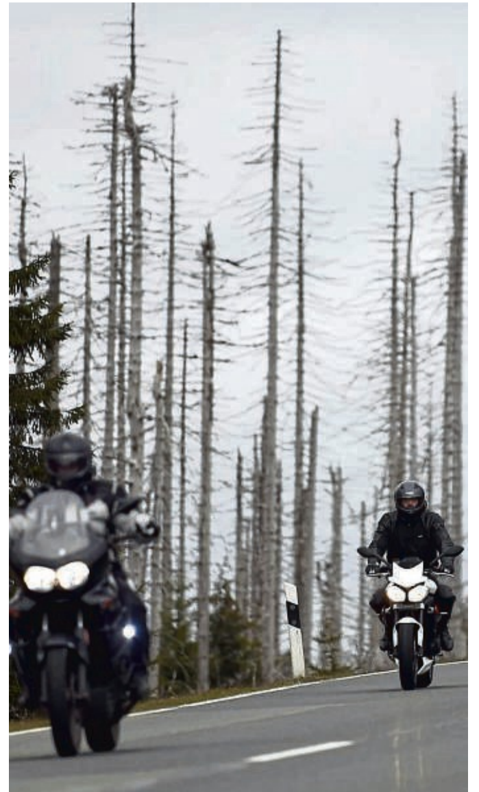
Kalt, aber trocken: Manche holen ihre Maschine noch mal raus, müssen aber einiges bedenken.