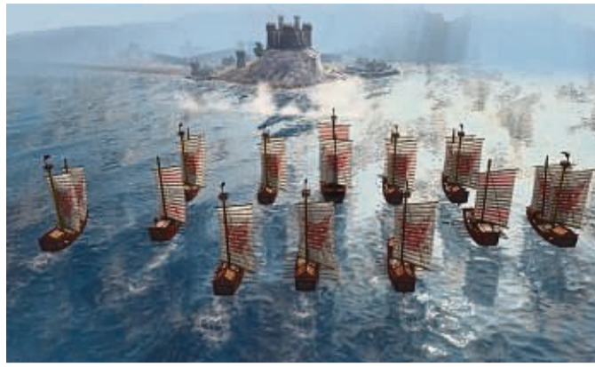
„Age of Empires 4“ kommt mit vier Einzelspieler-Kampagnen ist die neueste Fortsetzung der berühmten und beliebten Strategiespielreihe, die ihre Ursprünge in den 90er-Jahren hat.

Im Kern geht es dabei eigentlich ums Knobeln: Die Dorflandschaft besteht aus Kacheln, die nur nach bestimmten Regeln aneinandergelagt werden dürfen. Wer die Regeln beherrscht, kann so theoretisch endlos lange an Flüssen, Dörfern, Bergen und Feldern herumbasteln und sich vom gemütlichen Soundtrack einlullen lassen. Ein Geschenk für all jene, die eine Auszeit nötig haben – und wenn es auch nur ein paar Minuten Dorfromantik sind, im wahren Sinne des Wortes. tmn