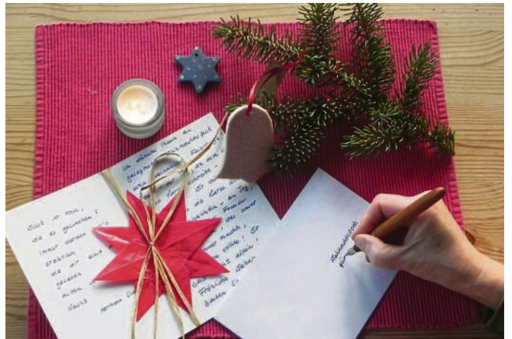
Liebe Worte in einem Brief verpackt hilft einsamen Menschen durch die dunkle Jahreszeit.

Die Weihnachtspost kann bis zum Freitag, 17. Dezember, an verschiedenen Stellen im Kreis abgegeben werden. Von dort wird sie weitergegeben