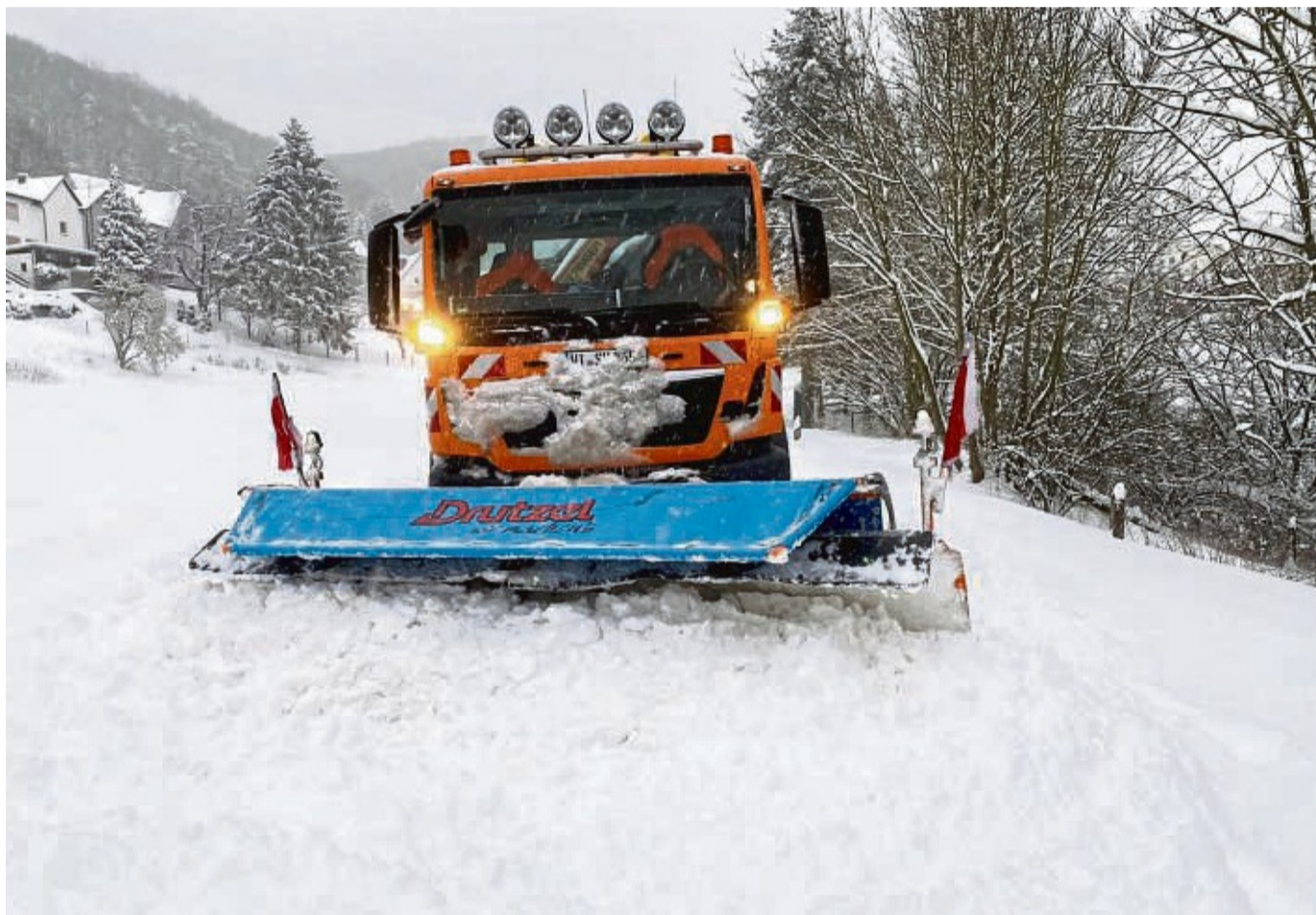
Im vergangenen Jahr kam es dicke: Auch dieser Winter verspricht schneereich zu werden, beim Winterdienst ist man jedenfalls vorbereitet.

„Das Personal reicht, um die Fahrzeuge der Meistereien zu besetzen“, so Beck. Zudem gebe es einen Einsatzleiter pro Schicht. „Täglich wird