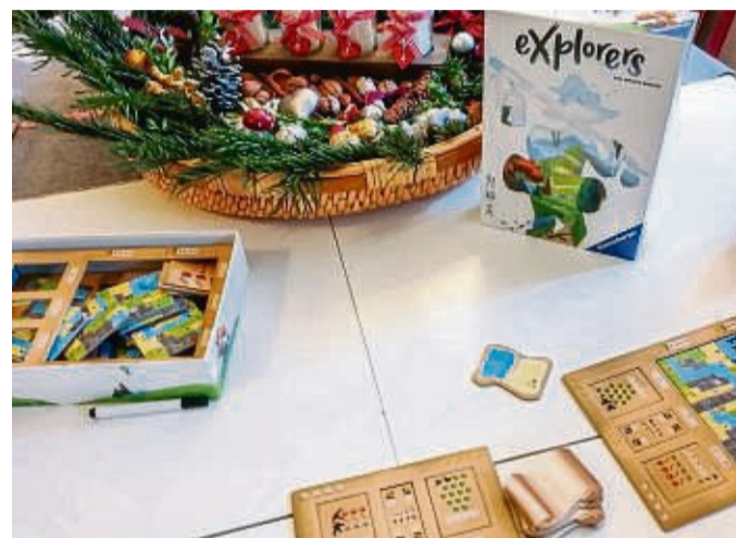
Für Taktiker: „Explorers“ spielt in einer fiktiven Welt, hat einen hohen Wiederpielwert und eignet sich für die gesamte Familie.