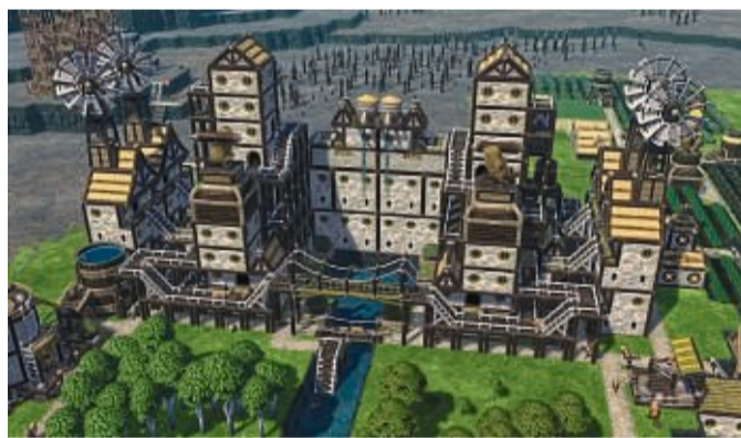
„Timberborn“ ist eine knallharte Aufbausimulation mit vielen kleinen flauschigen Bibern. Ein wunderbares Geschenk für all jene, die Spaß mit solchen Simulationen dieser Art haben. Denn: Es hält auch einige pfiffige Neuerungen bereit, die es so noch nicht gegeben hat.