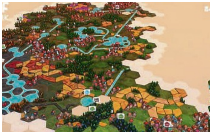
„Dorfromantik“ ist ein Geschenk für alle, die etwas Auszeit brauchen und bietet Aufbauspiel-Entspannung pur. Sechseck für Sechseck wird in dem Spiel eine neue Welt geplant und gebaut. Oder besser besagt: Eine idyllische Dorflandschaft.