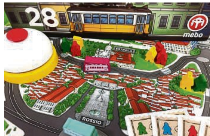
Für Familien: Im strategischen Brettspiel „28“ steuern die Spielenden mithilfe von Tickets eine Straßenbahn durch Lissabon, sammeln Fahrgäste ein und bringen sie zu Sehenswürdigkeiten.

Für Experten: „Arche Nova“: Beim Aufbau eines wissenschaftlich geführten Zoos geht es nicht nur darum, viele (Tier-)Attraktionen zu bieten, sondern auch möglichst viele Artenschutzprojekte zu unterstützen. Der Hype-Titel der diesjährigen Spielmesse in Essen ist ein echtes Schwergewicht. Zwar sind die Regeln für ein Expertenspiel nicht übermäßig kompliziert, doch strategisch verlangt es einiges ab. Die Aktionsauswahl wird dabei mit einem cleveren Kartenmechanismus getroffen. Das Erstlingswerk von Spieleautor Mathias Wigge kann durchaus länger dauern. tmn