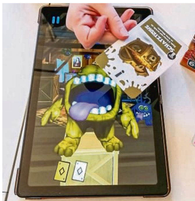
Die Monster im Spiel „Ungeheuer Hungrig“ brauchen Futter, aber bloß nicht zu gesund!