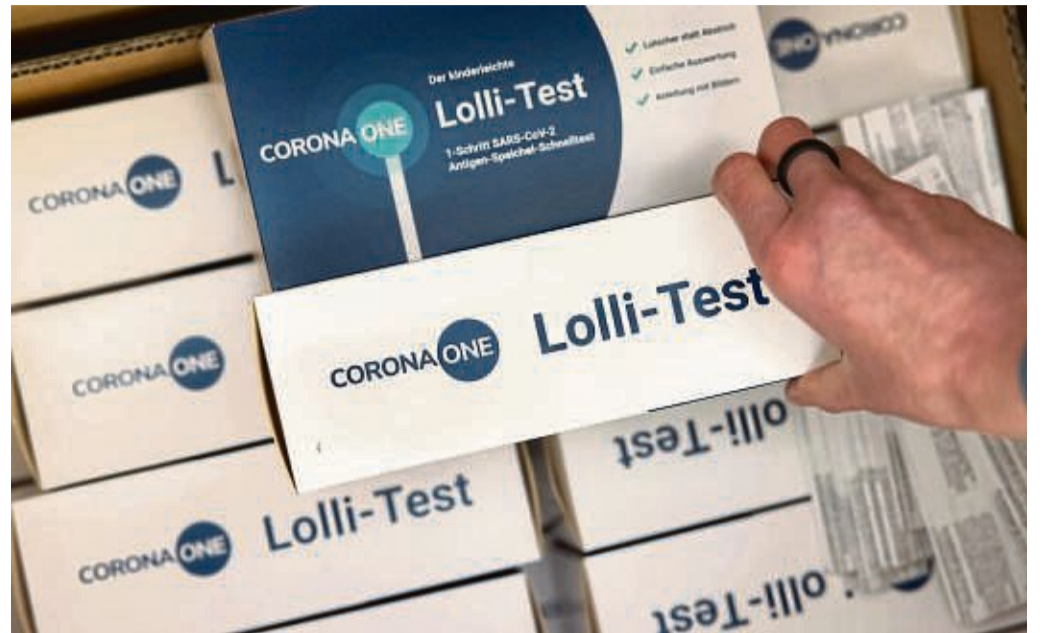
Kaufen zusammen ein: Die Kommunen im Kreis besorgen für alle Kitas Lollitests. Elternbeiräte hatten dies bei den Gemeinden und Trägern eingefordert.

Kreis stellt kostenlose Tests zur Verfügung