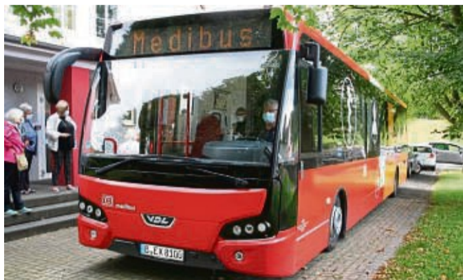
Hält jetzt wieder zu den gewohnten Sprechzeiten in Herleshausen: der Medibus.

Euro. Mit der Teilnahme der Diakonie Eschwege Land und des dazugehörigen Hospizdienstes am Projekt wird das Angebot erweitert. So werden auch Pflegeberatung, Seelsorge und Beratungsmöglichkeiten zu Patientenverfügung und Vorsorgevollmacht im Bus möglich sein. esp