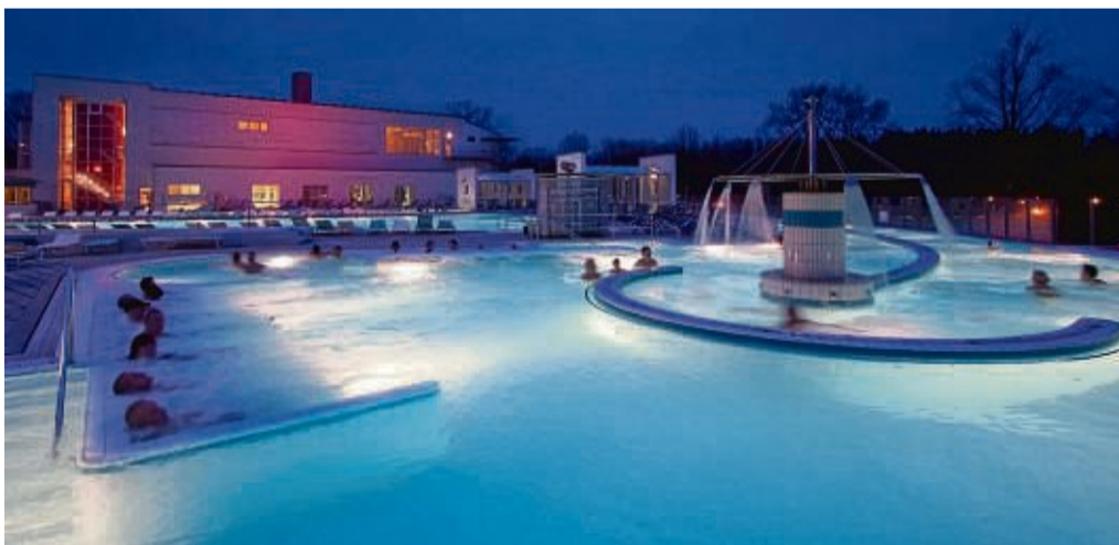
In den Heilbädern im Passauer Land können Erholungssuchende durchatmen und ihre Gesundheit stärken.