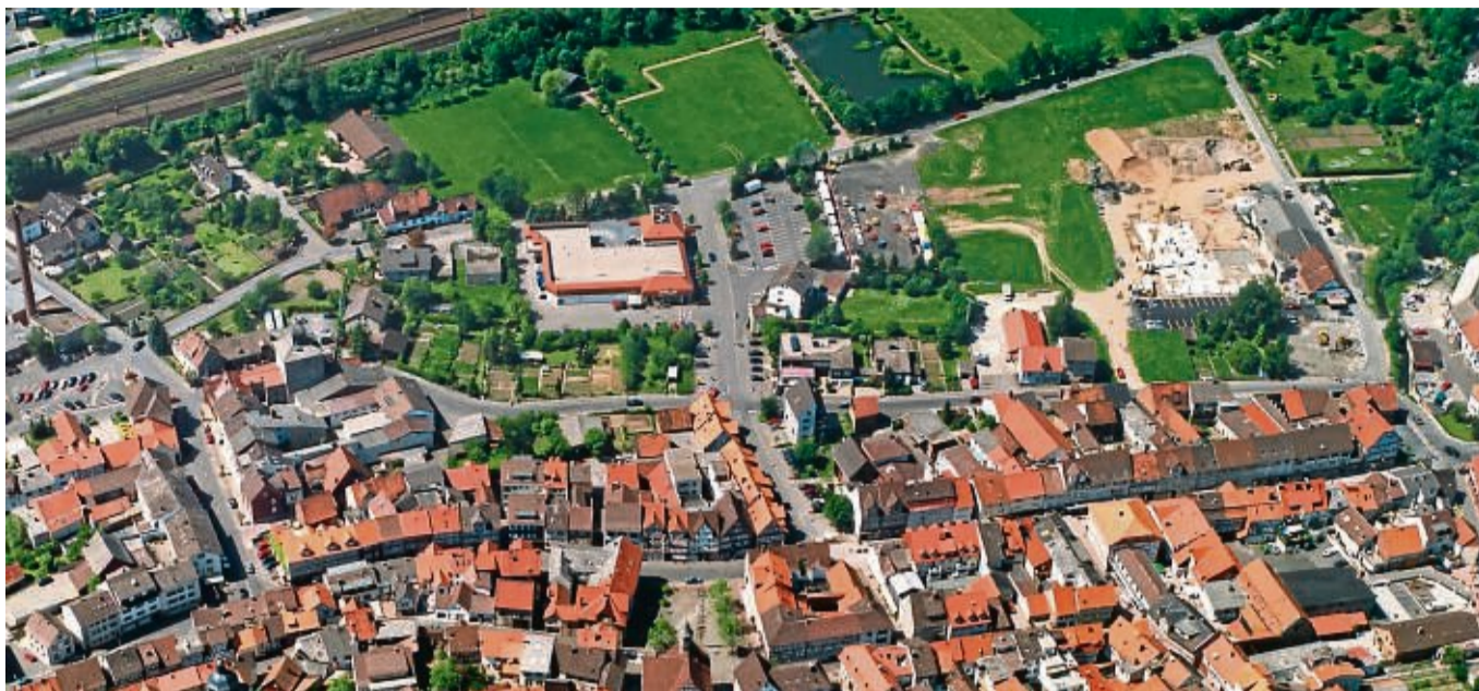
In Sontra, hier der Blick auf die Breitwiese schaut man zuversichtlich in die Zukunft: Viele neue Projekte, Herausforderungen und Vorhaben stehen an.

„Wege entstehen dadurch, dass man sie geht.“ Dass wir diese Wege in 2021 trotz der Einschränkungen wieder einmal gegangen sind und uns hierbei viele Unterstützerinnen und Unterstützer sowie Wegbegleiter zur Seite gestanden haben, dokumentieren