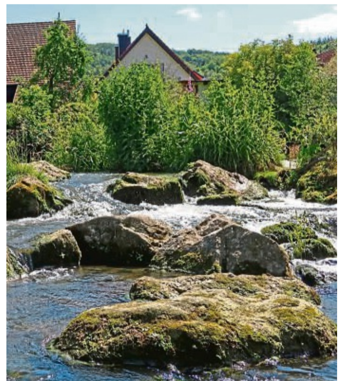
Die Auen der Fränkischen Saale um Bad Bocklet sind ein Dorado für Erholungsbedürftige und Naturliebhaber.

1A Buche ab 39,- € ☎ 0152-2800388 www.brennholzhandel-vey.de