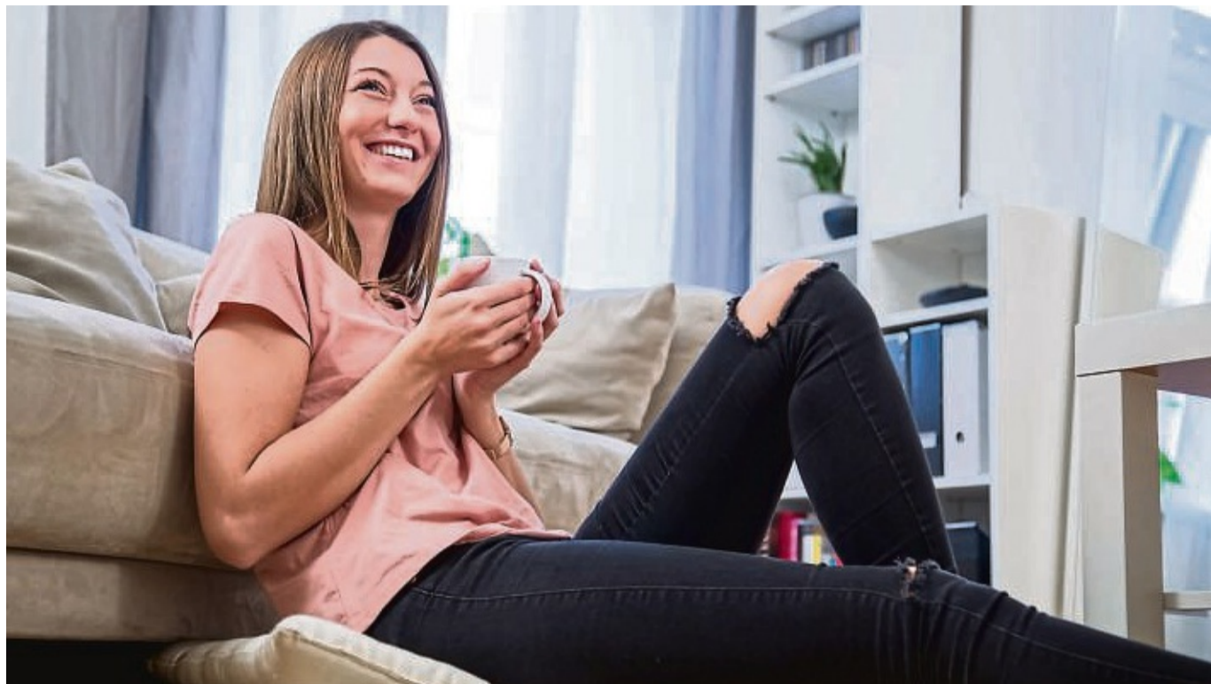
Sie hat gut Lachen. Denn aktueller Stand der Wissenschaft ist: Wer moderat Kaffee trinkt, lebt länger.

Da das Koffein verdauungsanregend wirke, werde entkoffeinierter Kaffee zum Teil auch besser vertragen als koffeinhaltiger. Er sei natürlich vor allem dann auch eine gute Alternative, wenn man auf die anregende und wachmachende Wirkung des Koffeins verzichten möchte.