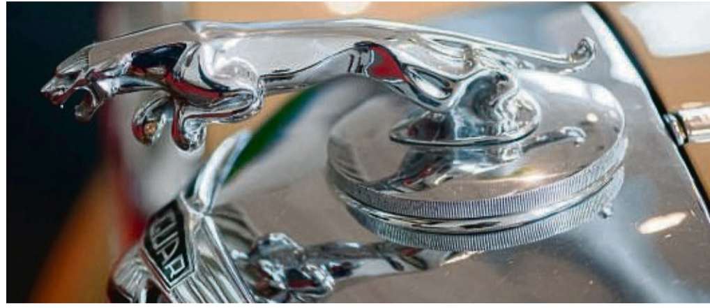
Katze auf Kühler: Richtige Figuren an der Fahrzeugfront sind heute selten, auf klassischen Autos wie diesem Jaguar aus den 1950er Jahren sieht man sie häufiger.