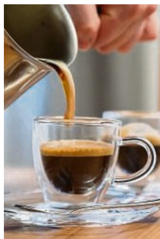
Brennt's im Magen? Dann hilft vielleicht ein Umstieg auf Espresso.

lang gesunde Menschen. „Hier haben vor allem die Pflegerinnen und Pfleger Großartiges geleistet, gerade in Zeiten des strikten Besuchsverbots standen sie den PatientInnen bei“, sind sich die Oberärzte einig. „Diese Ausnahme-situation hat uns erneut vor Augen geführt, dass die Tätigkeiten auf der Intensiv- und auch auf unserer Normalstation immer eine Teamarbeit aus Pflege, ärztlichem und anderem medizinischen Personal war und ist - darüber hinaus haben auch die Physiotherapeuten einen entsprechenden Anteil an der Patientenversorgung“, loben sie das gemeinsame Engagement. Beim Blick in die Zukunft setzen die Mediziner auf Prävention durch Impfung, „die steigende Impfquote hat sich definitiv auf das Patientenaufkommen ausgewirkt“, lautet ihr Fazit, „wir beide sind bereits das dritte Mal geimpft und fühlen uns in Anbetracht der anstehenden Jahreszeit sicher damit. Wir können nur jedem dazu raten, sich entsprechend den aktuellen Empfehlungen impfen zu lassen und gegebenenfalls im Verlauf sich einer Booster-Impfung zu unterziehen“.