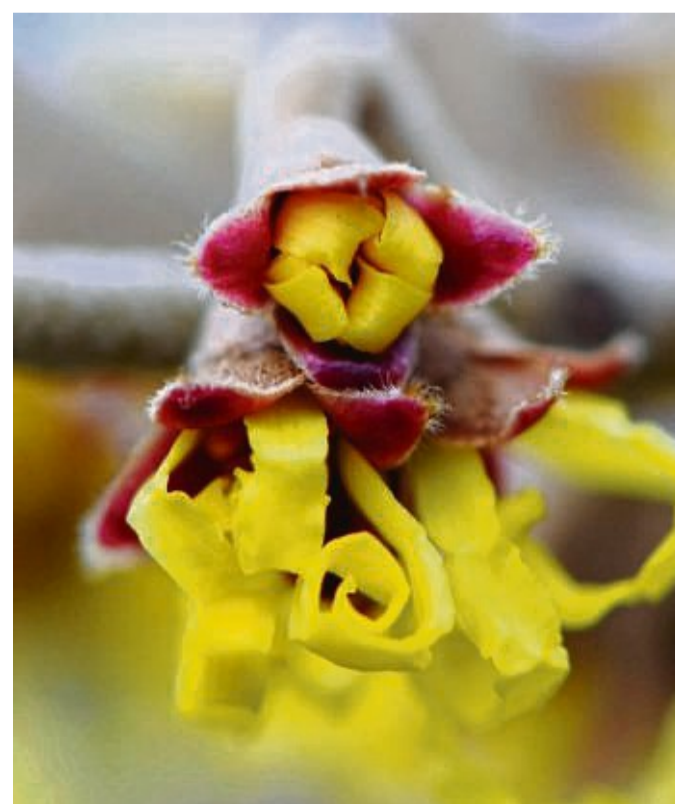
Ungewöhnliche Blüten hat die Zaubernuss.

In manchen Regionen gelten die Zweige sogar als Orakel: So soll man in Niederösterreich Zettelchen mit Namen darauf an Kirschzweige hängen. Der Name an dem Zweig, der zuerst erblüht, wird im kommenden Jahr besonders mit Glück rechnen können, so der Brauch. tmn