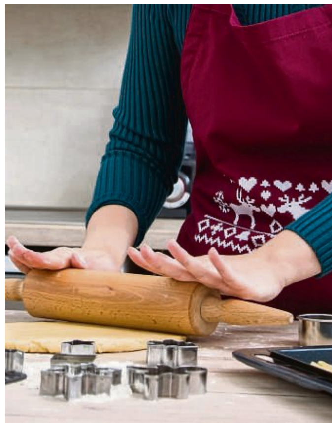
Kneten, Rollen, Ausstechen: Plätzchen backen in der Adventszeit ist für viele Menschen eine liebevoll gewonnene Tradition.

„So nutzt man weniger Glasur, spart sich Kalorien und verliert trotzdem keinen Geschmack.“