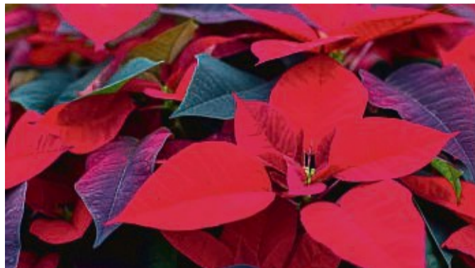
Weihnachtssterne erblühen im Winter – und sind damit perfekt für den Advent.

Störend ist der Milchfluss aber auch so: Wenn man zum Beispiel die Blüten und farbigen Hochblätter als Blumen für die Vase oder Gestecke abschneidet, kann er Flecken auf der Kleidung verursa-