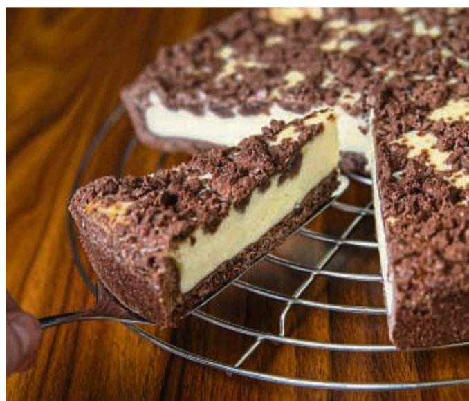
Für den Schoko-Mürbeteig eines runden Zupfkuchens (26 Zentimeter Durchmesser) sollten nicht mehr als 300 Gramm Mehl verwendet werden. Sonst wird der Teig trocken.