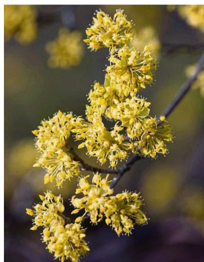
Die Kornelkirsche eignet sich für das Schneiden von Barbarazweigen.

Barbarazweige heißen so im Gedenken an die Heilige Barbara. Hinter dem Brauch steht eine Legende: Die Kaufmannstochter musste ins Gefängnis. Auf dem Weg dorthin verdingte sich ein Kirschzweig in ihrem Kleid, den Barbara in ihrer Zelle ins Wasser stellte. Am Tag ihrer Hinrichtung öffneten sich die