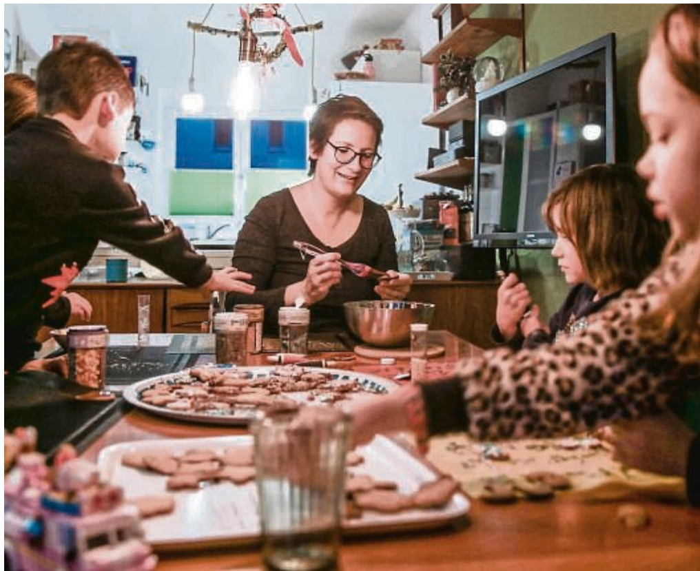
WEIHNACHTSPLÄTZCHEN BACKEN oder Karten basteln können eine schöne Ablenkung vom Corona-Frust in der Familie sein.