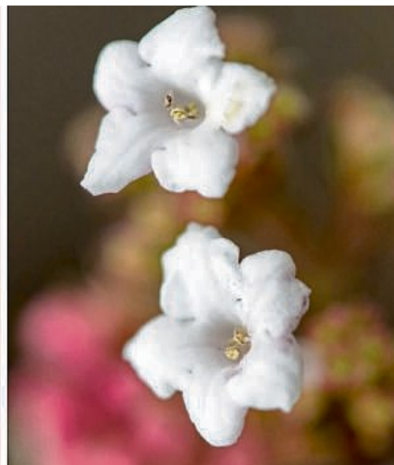
Winterjasmin (von links nach rechts), Zaubernuss und Winterschneeball erblühen im Garten bereits zum Winterende – und im Haus schon zu Weihnachten. Sie sorgen für ein nachhaltigeres Weihnachtsfest, denn auf den Baum kann dann verzichtet werden.