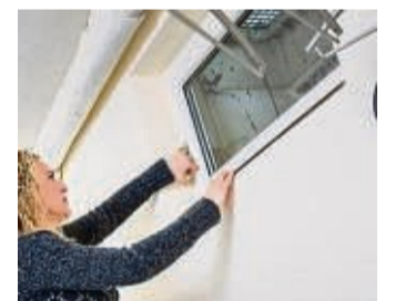
Der Keller sollte täglich gelüftet werden.