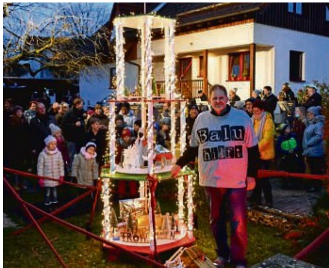
Balu hilft: Unter diesem Motto gab es die Beleuchtungspremiere für seine Weihnachtspyramide.