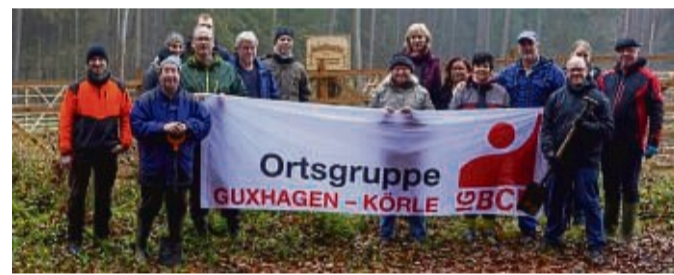
Mitglieder der IGBCE Guxhagen/Körle pflanzten jetzt 300 Eichen und 20 Esskastanien im Wald bei Guxhagen ein.

Den Abschluss bildete ein gemeinsames Mittagessen im Wald.