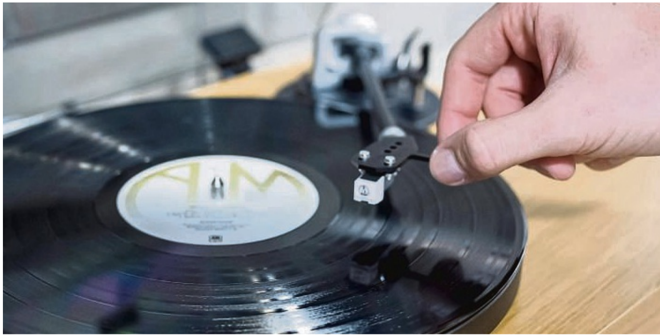
Schwarzes Gold: Vinyl steht wieder hoch im Kurs – welchen Plattenspieler aber braucht man, um neu einzusteigen oder alte Schallplattenschätzchen wieder erklingen zu lassen?

Auch wenn viele Zubehörprodukte heute schon recht günstig seien, bliebe es in der Summe trotzdem eine recht große Investition. Von Im-