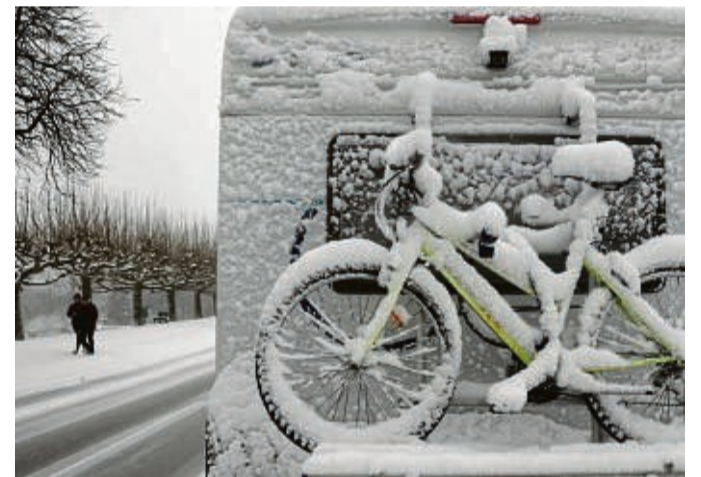
Camping im Winter? Mit einem richtig ausgerüsteten Wohnmobil ist das kein Problem.

In Elendsvierteln, Waisenhäusern und Behindertenheimen, wo die Stiftung seit Jahren immer wieder Weihnachtspäckchen verteilt, freuen sich die Kinder deshalb oft das ganze Jahr schon auf den Tag, an dem die Weihnachtsgeschenke aus Deutschland eintreffen.