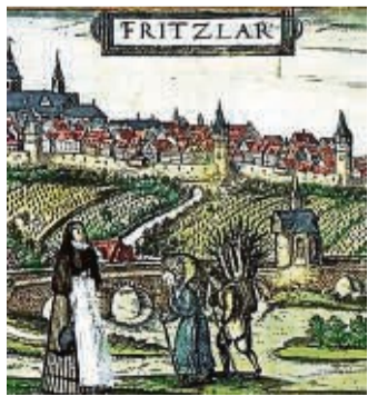
Ein Ausschnitt des Museumskalenders.

Fritzlar - Ein besonderer Hingucker: Der Museumsverein Fritzlar gibt einen Museumskalender 2022 heraus. Im Mittelpunkt steht die besondere Beziehung der 1300-jährigen Dom- und Kaiserstadt zur Religion. Der Kalender im A4-Querformat enthält Fotos und Abbildungen historischer Ereignisse und großer Gestalten sowie zu mächtigen sakralen Bauwerken in Fritzlar. Kurze, informative Texte erläutern die Darstellungen. Konzeption und Texte: Michael Auerbach und Dr. Richard Gronemeyer. Verkauf: Touristinformation Fritzlar, für 12 Euro.