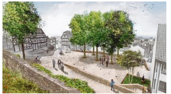
Der Entwurf des Wettbewerbssiegers Loma aus Kassel zur Neugestaltung des Alten Markts in der Gudensberger Altstadt.

Der Alte Markt soll in eine fast ebene Aufenthaltszone im Platanenhain und eine Freifläche gegliedert werden. Das soll mithilfe von zwei Stützmauern, die der großen Stützmauer des Kirchhofs ähneln, geschehen. Die Kirche soll einen barrierefreien Zugang erhalten. Der ruhende Verkehr wird im Entwurf geordnet. Die Vorfläche der St. Crucis-Kapelle wird vergrö-