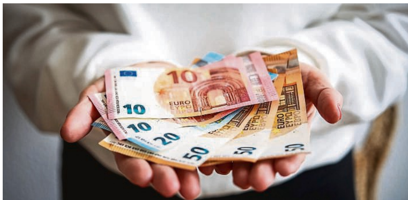
Geldspenden bewirken Gutes – und lassen sich steuerlich absetzen.