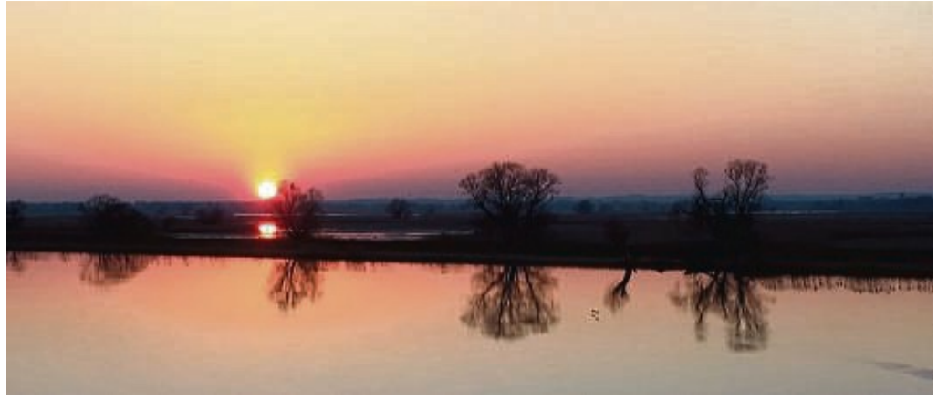
Seit 2012 ist die Uckermark eine zertifizierte nachhaltige Tourismusregion mit gemütlichen Unterkünften, leckerer regionaler Gastronomie und Aktivurlaub mitten in der Natur.