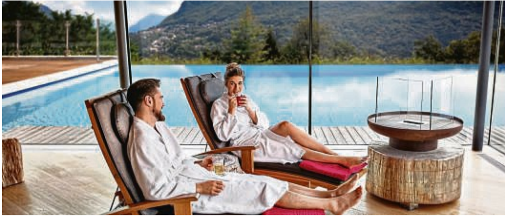
Ein Kurzurlaub in einem Wellnesshotel zeigt dem Beschenkten, dass man sich Gedanken gemacht hat und gerne gemeinsame Zeit verbringt.