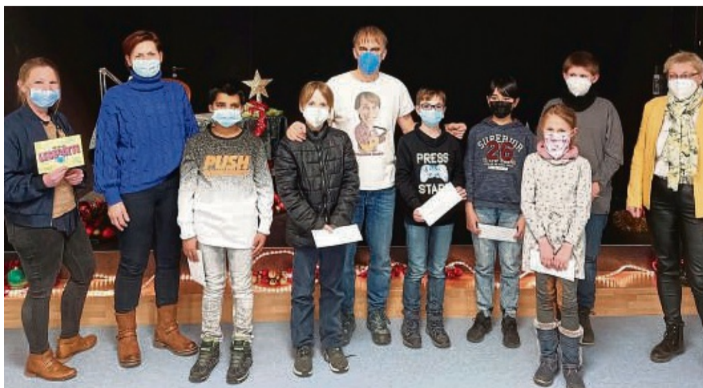
Die Gewinner des Lesewettbewerbs freuten sich über Buchgutscheine.