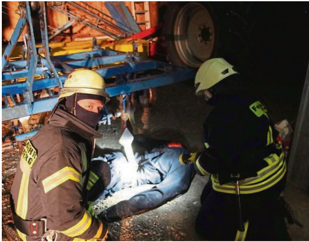
Bei der Feuerwehübung zeigten die Brandschützer vollen Einsatz.