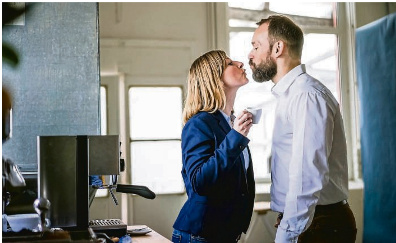
Küsschen am Arbeitsplatz: Beziehungen sind im Job nicht automatisch ein Problem.