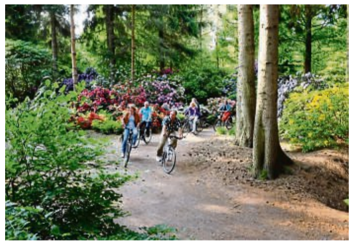
Für jeden Fitnessgrad geeignet: In der Parklandschaft des Ammerlandes sind kaum Steigungen zu bewältigen.

Deutschland freut sich auf die warme Jahreszeit, Parks und Gärten zeigen bald wieder ihre blühende Pracht. Besonders intensiv kann man das farbenfrohe Schauspiel in der Parklandschaft des Ammerlandes erleben.