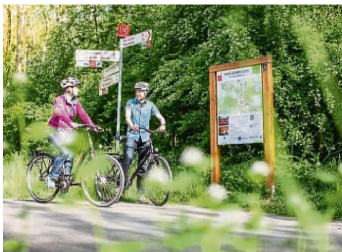
Rund um Soest macht das Knotenpunktsystem die Orientierung beim Radfahren leicht.

Auf Radtouren die Natur genießen, ohne zwischendurch nach dem Weg zu suchen? Das geht in Südwestfalen rund um Soest, wo ein ausgeklügeltes Knotenpunktsystem für Orientierung sorgt. Hier können Fahrradrouten den Ausblick auf die Berge des Sauerlands genießen, am Ufer des Möhnesees oder in Flussauen fahren.