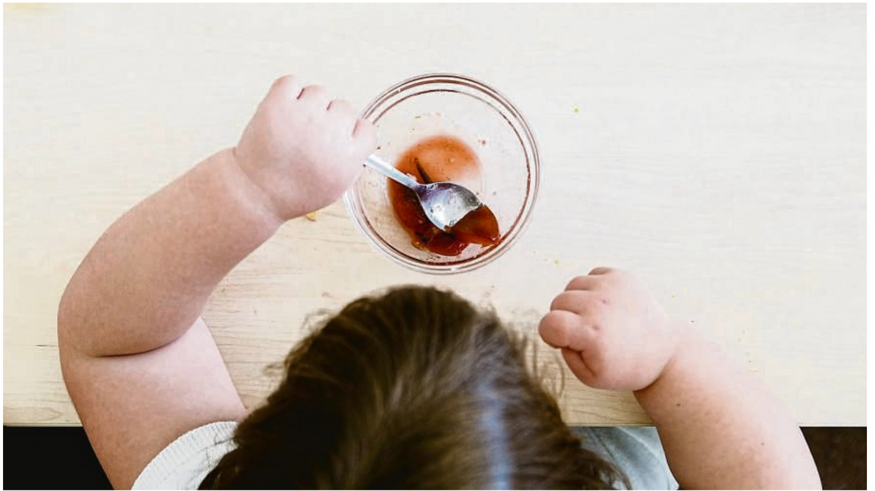
Kinder reagieren auf ihre Umwelt und können wenig gegen Übergewicht tun – umso mehr sind die Eltern gefordert.

Die Gründe für Übergewicht sind rasch erklärt: „Im Prinzip bekommt der Körper zu viel Energie von Lebensmitteln und verbraucht zu wenig in Form von Bewegung“, sagt der Experte. Da-