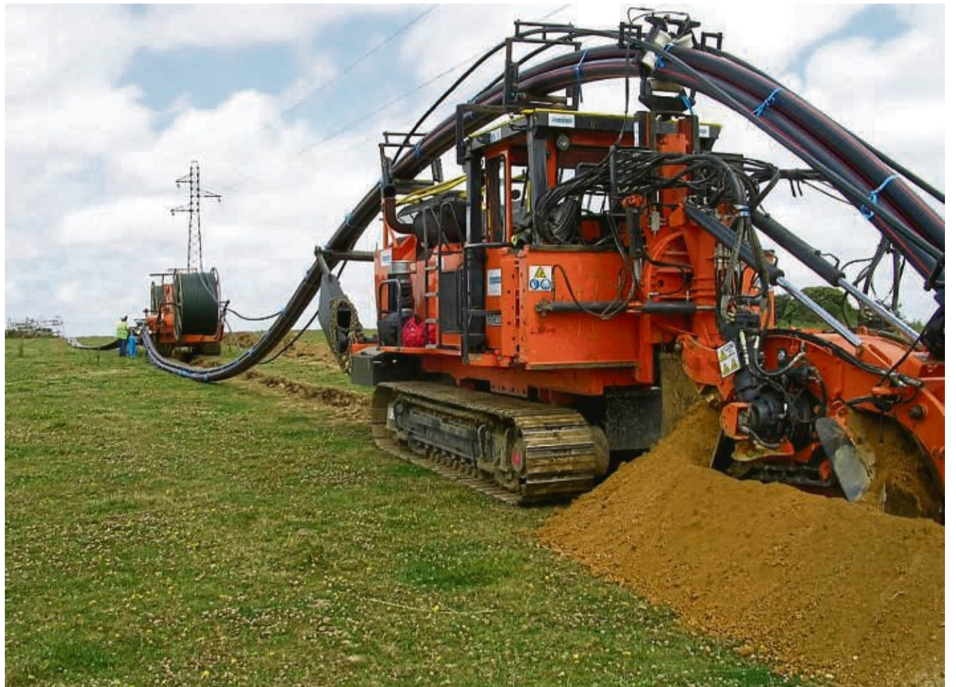
Suedlink-Trasse: Im nächsten Jahr soll es Kartierungen auch im Raum Hessisch Lichtenau geben. Unser Archivbild zeigt eine Grabemaschine zum Verlegen der Erdkabel. ARCHIVFOTO: PRIVAT

Diese erfolgt auch in mehreren verschiedenen Zeiträumen.