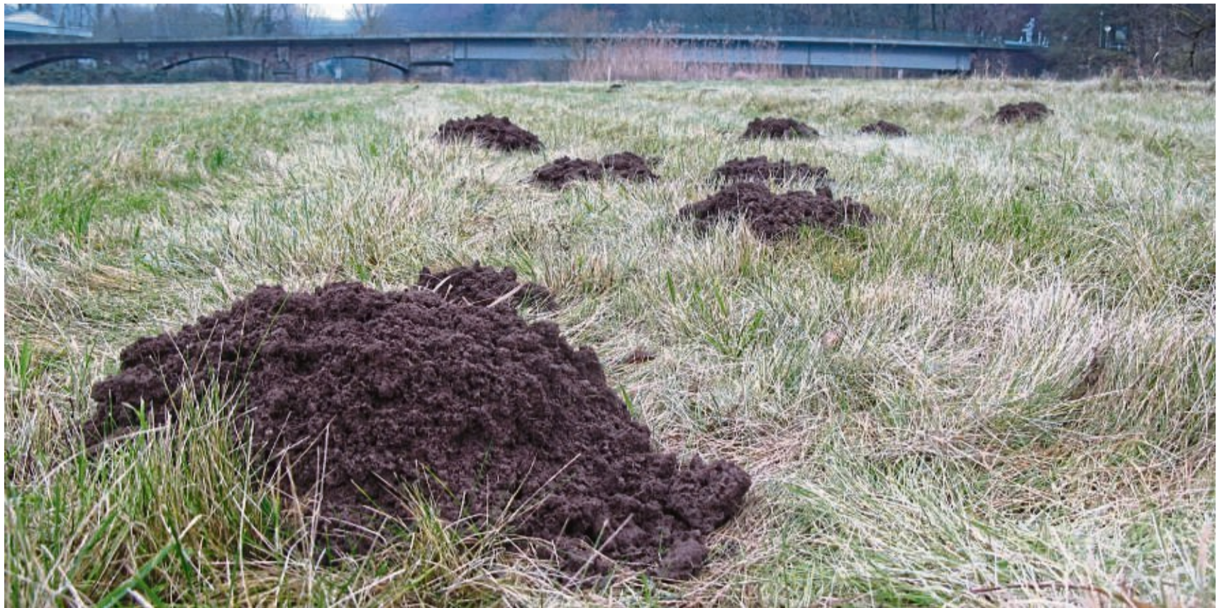
Maulwurfhügel: Am Werra-Ufer bei Hedemünden herrscht wetterbedingt rege Bautätigkeit.

„Auf Äckern gibt es viel seltener Maulwurfhügel, weil die Flächen in der Regel ein- bis zweimal im Jahr gepflügt werden“, ergänzt Landwirt Baumgärtel. Bei der Bodenbe-