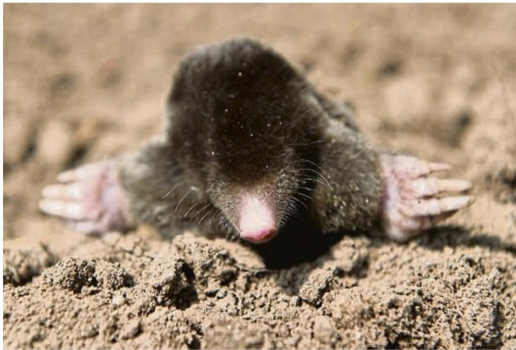
Ein Europäischer Maulwurf in einem Erdhügel. (Symbolbild).