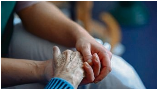
Kurse und Schulungen können für ein besseres Verständnis der Demenz sorgen und damit den Pflegealltag erleichtern.