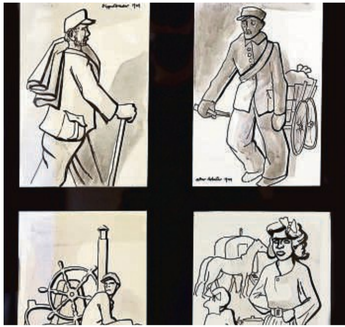
Einfach, aber gekonnt: Zeichnungen von Hugues von 1949.

Hugues ist dabei keineswegs „neutral“, man sieht genau, welchen Grad der Zuneigung oder der Ablehnung er seinen Modellen gegenüber empfindet. Aus den Bildern russischer Frauen meint man sogar so etwas wie Liebe oder Verehrung herauslesen zu können. In einem gewissen Sinn erinnert die Ausstel-