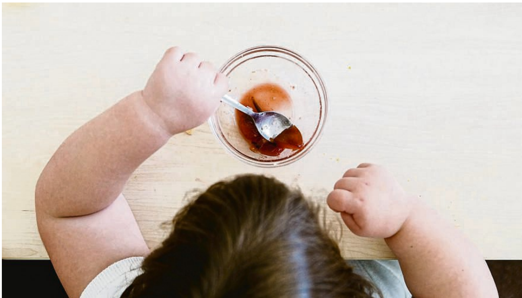
Kinder reagieren auf ihre Umwelt und können wenig gegen Übergewicht tun – umso mehr sind die Eltern gefordert.

Die Gründe für Übergewicht sind rasch erklärt: „Im Prinzip bekommt der Körper zu viel Energie von Lebensmitteln und verbraucht zu wenig in Form von Bewegung“, sagt der Experte. Da-