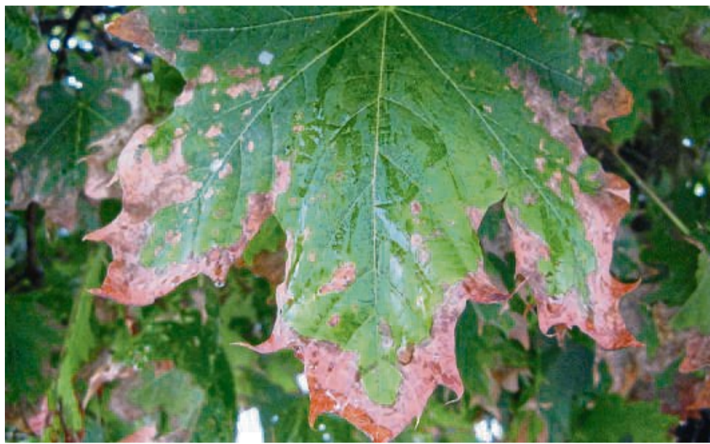
Schäden durch Streusalz am Kugelahorn.