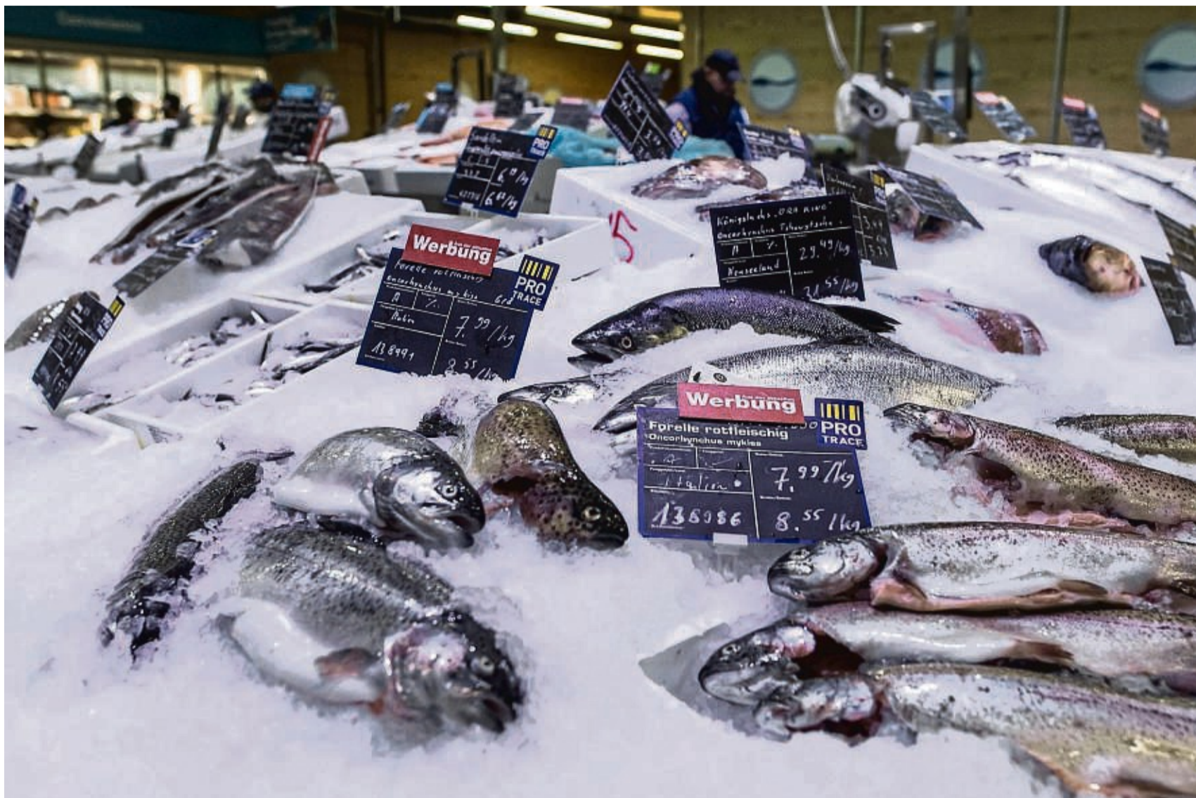
Forellen liegen auf Eis in der Fischtheke und zählen zu den lachsartigen Fischen. Umweltschützer sind für eine Reduzierung der kommerziellen Fänge und der Fangmengen in der Freizeitfischerei. Dort werden Lachse oft als Meerforellen falschgemeldet, was die Datenlage verzerrt.