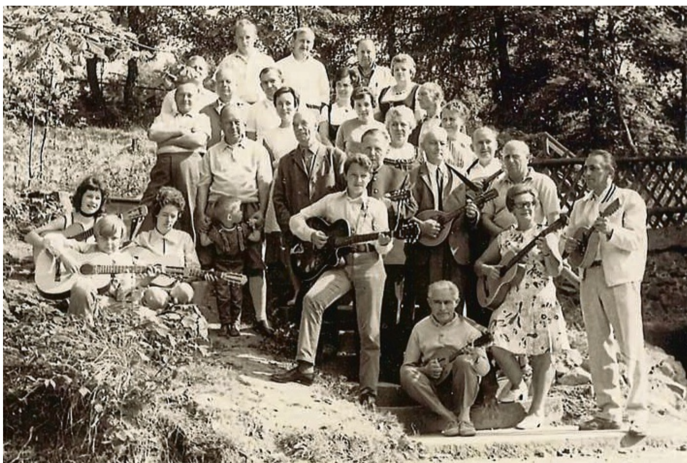
Musikalisch: Auch in den 1960er-Jahren begeisterten sich die Naturfreunde noch für das Mandolinen- und Gitarrenspiel.