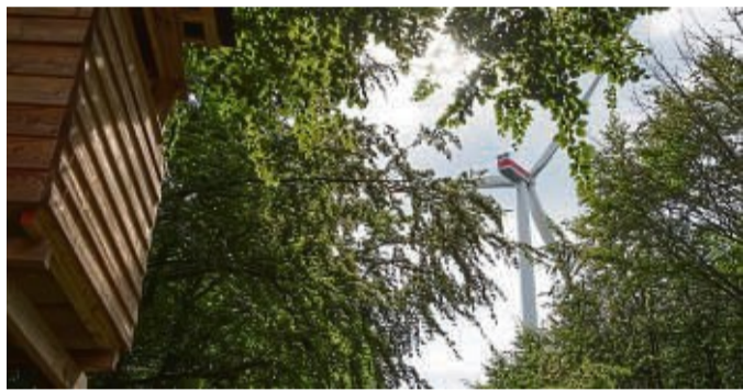
Eine Windkraftanlage im Windpark bei Trendelburg.