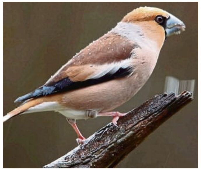
180 Kernbeißer wurden zwischen Viermünden und Ederbringhausen gezählt – so viele, wie nirgendwo sonst im Landkreis.

Die zweite Edervogelzählung wurde für Sonntag, 6. Februar, ab etwa 9 Uhr terminiert. Aus den bereits vorliegenden Beobachtungsdaten geht erneut hervor, dass die untere Eder unterhalb der Talsperre das Gebiet für zum