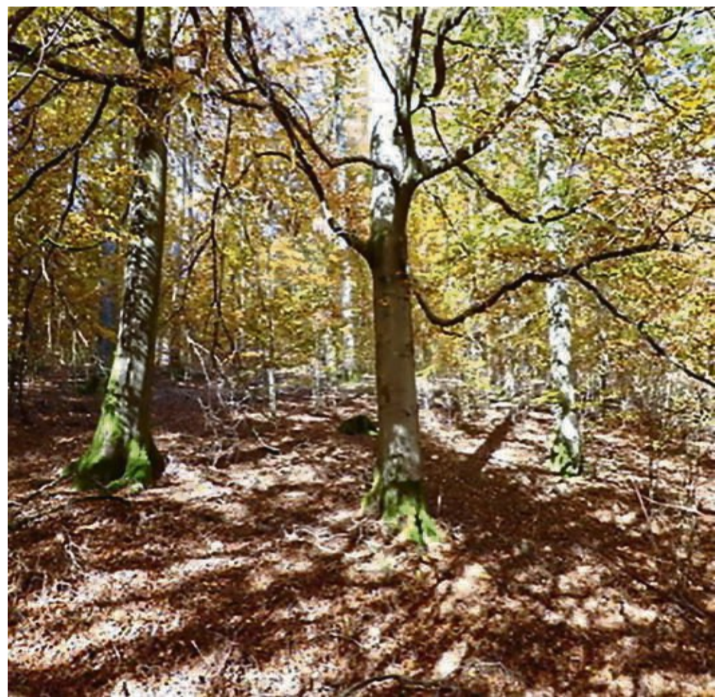
Herbst am „Ahornkopf“ im Nationalpark Kellerwald-Edersee, dem im neuen Jahrbuch der Nordhessischen Gesellschaft für Naturkunde und Naturwissenschaften sechs Beiträge gewidmet sind.

Ein Beispiel: Die Weibchen des Großen Mausohrs haben ihre Wochenstuben in drei Dachböden von Vöhl, Bad Wildungen und Züschen, zum Jagen fliegen sie nachts in den Nationalpark, wo sie vor allem Lauffrüher auf dem Waldboden erbeuten. Die Männchen bewohnen hingegen den ganzen Sommer über Baumhöhlen im Wald. So ist das Große Mausohr ein Beispiel für die vielfältigen Wechselbeziehungen zwischen dem Nationalpark und