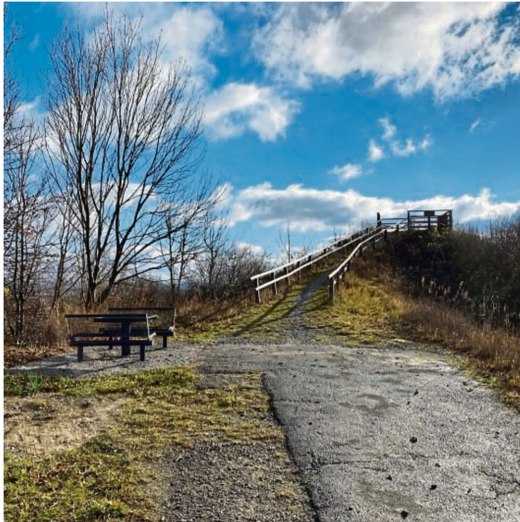
Am höchsten Punkt der Quastholle schütteten die Erbauer des Aussichtspunktes einen sechs Meter hohen Erdhügel auf.