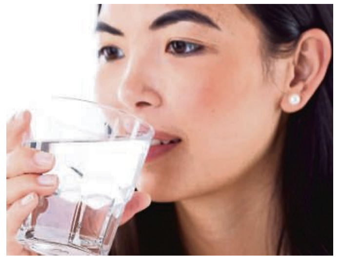
Feste Rituale am Arbeitsplatz helfen, auf die empfohlene tägliche Trinkmenge zu kommen.