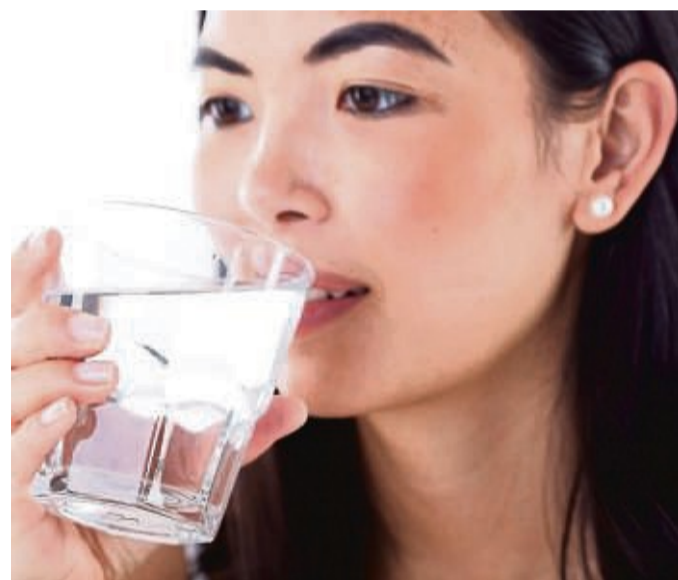
Feste Rituale am Arbeitsplatz helfen , auf die empfohlene tägliche Trinkmenge zu kommen.