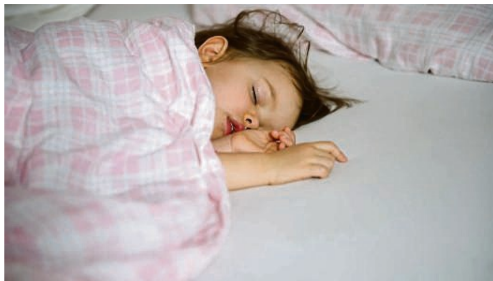
Viele Kinder schnarchen nachts. Kommt das häufig vor, sollte sich ein Kinderarzt oder eine Kinderärztin dies näher ansehen.

Auch Schadstoffe und Zigarettenrauch begünstigten die Aussetzer und das Schnar-