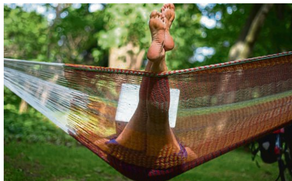
Ein Sabbatical kann sich durchaus gut im Lebenslauf machen.