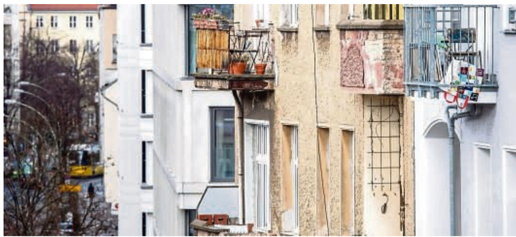
An Modernisierungen können Vermieter ihre Mieter beteiligen. Umgelegt werden dürfen die Kosten aber nur anteilig.

Zum anderen ist die Mietpreisbremse zu beachten. Demnach darf die Miete innerhalb von drei Jahren um nicht mehr als 20 Prozent an-