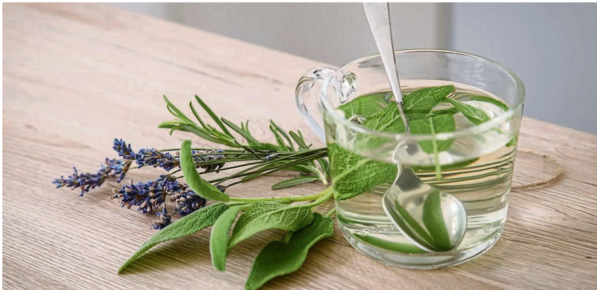
Rosmarin, Lavendel und Salbei lassen sich für frische Tees verwenden.