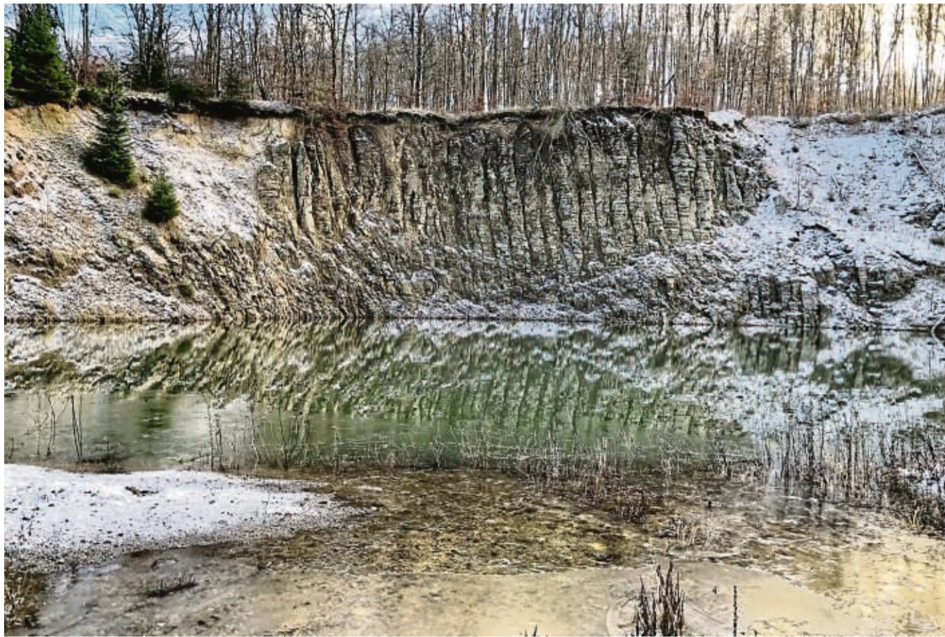
Attraktive Brutstätte für den Uhu: Die Basaltsteinwände oberhalb des Südteiches im stillgelegten Steinbruch Silbersee im Hohen Habichtswald. Würde das Gelände angefüllt, würde der Vogel das Quartier verlassen.

Der Südteich im Steinbruch Silbersee erhält sein Wasser aus den südlich in Richtung Herkules befindlichen Gesteinsschichten, die aus Basalt und Kasseler Meersand bestehen. Würde das Gelände samt Teich – so wie es die aktuell zugelassenen Pläne vorsehen – um etwa 25 Meter mit Aushub aufgefüllt und im Anschluss als ein Biotop für Amphibien gestaltet, würde das Gewässer seine