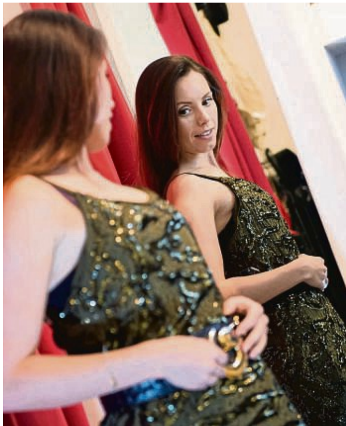
Die beste Wahl ist Kleidung, in der man sich wohl fühlt.

Dazu kommt, dass enge Kleidung die Bewegungsfreiheit einschränkt. Wer sich schonmal in ein enges Hemd oder Kleid gezwängt hat, weiß: Den Atem tief in den Bauch zu schicken, ist in so einem Outfit kaum möglich. „Die Atmung kann abflachen, wenn sich der Brust-