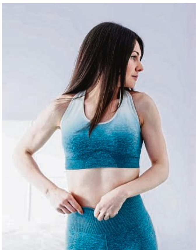
Enge Sportkleidung kann tückisch sein: Beim Schwitzen kann darin der Schweiß nur schwer über die Haut verdunsten und damit den Körper kühlen.