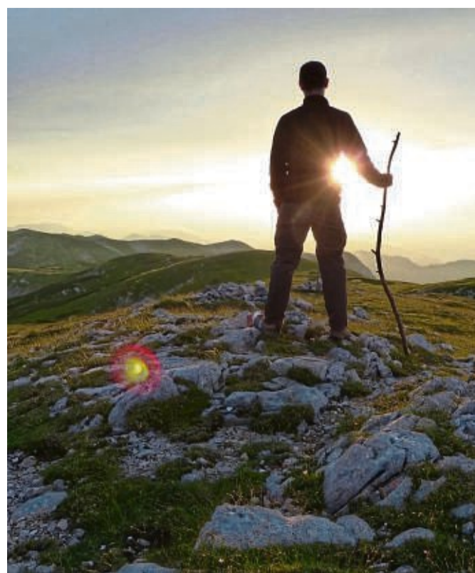
Mal was anderes sehen und sich neu orientieren: Ein Sabbatical macht's möglich.

Macht sich ein Sabbatical gut im Lebenslauf? Ja, wer ein Sabbatical gemacht hat, signalisiert: ich nehme meine Karriereplanung selbst in die Hand. „Vor allem, wenn die Gründe für das Sabbatical plausibel sind, macht sich das gut im Lebenslauf“, betont Bölke.