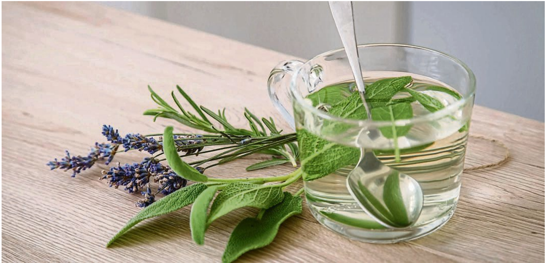
Rosmarin, Lavendel und Salbei lassen sich für frische Tees verwenden.