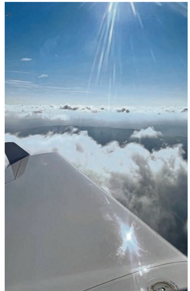
Über den Wolken von Sontra: