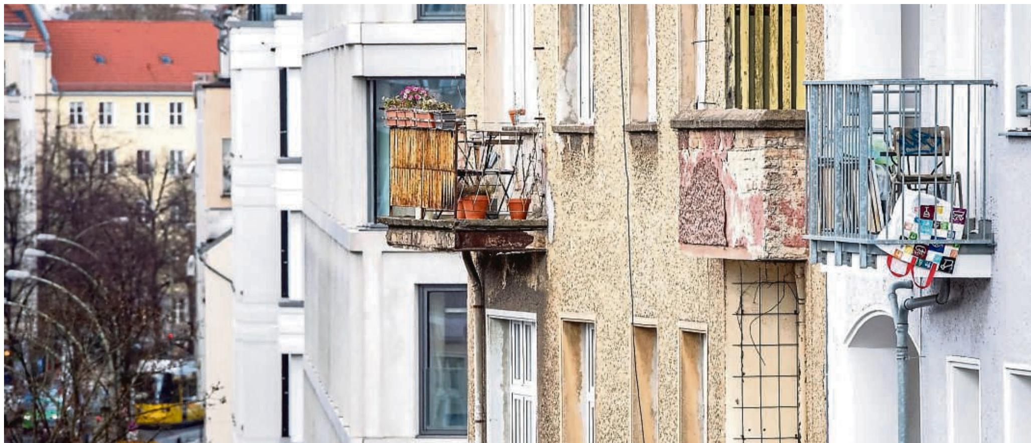
An Modernisierungen können Vermieter ihre Mieter beteiligen. Umgelegt werden dürfen die Kosten aber nur anteilig.