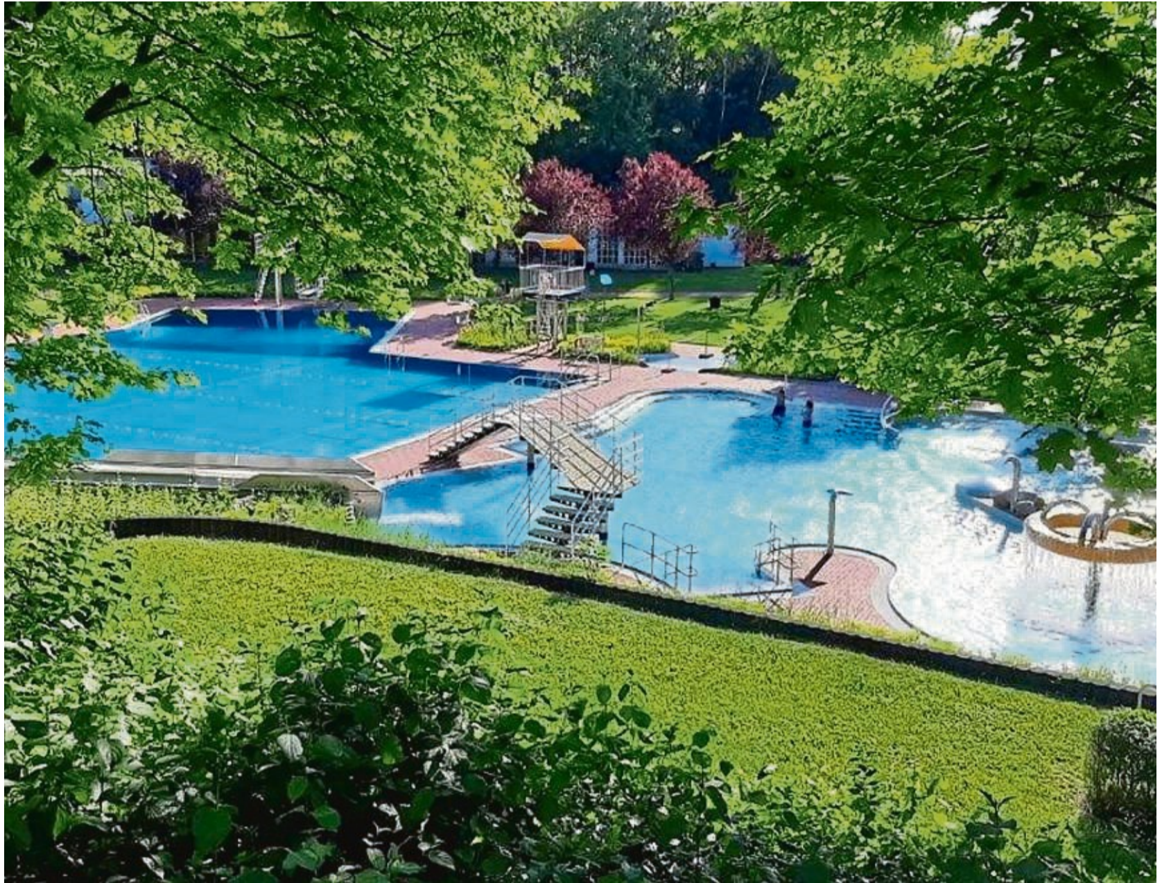
Weckt Vorfreude auf den kommenden Sommer: das Schwimmbad in Sontra.