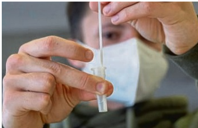
Alltag für Schüler: Regelmäßiges Testen ist mittlerweile normal.