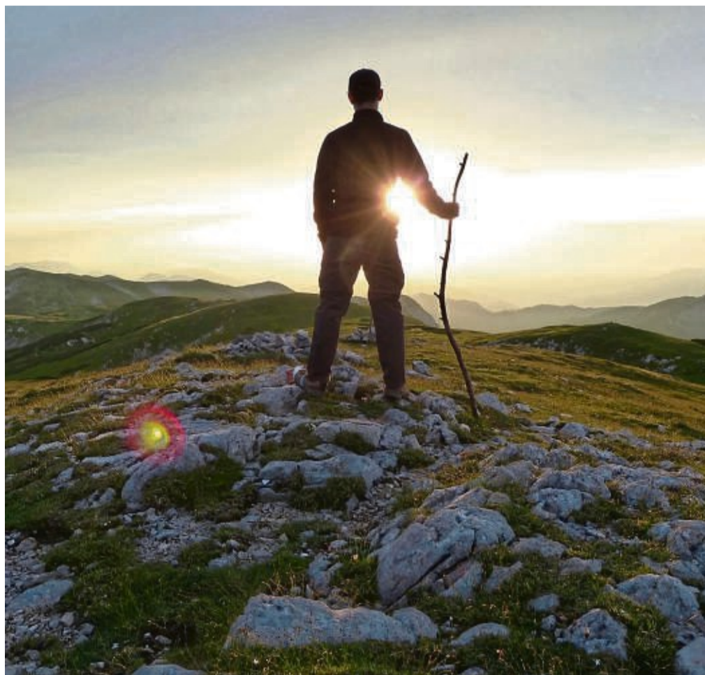
Mal was anderes als das Büro sehen und sich neu orientieren: Ein Sabbatjahr macht's möglich.

„Beschäftigte können zum Beispiel unbezahlten Sonderurlaub nehmen“, so Bölke. Allerdings sind freigestellte Arbeitnehmerinnen und Arbeitnehmer verpflichtet, selbst für die Kranken- und Pflegeversicherung aufzu-