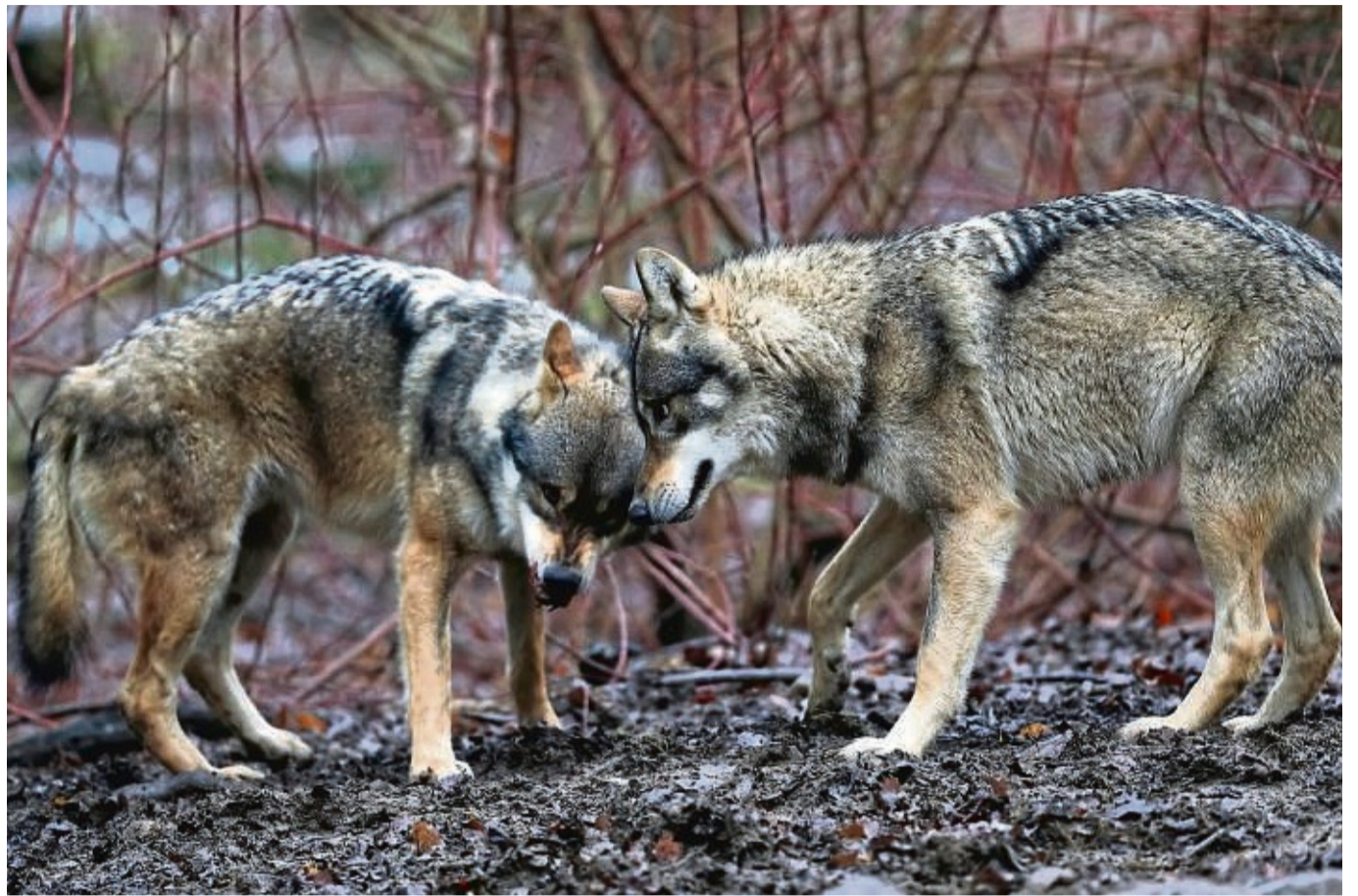
Gesellig: Wölfe wie diese aus dem Tierpark Sababurg leben im Rudel.

Weitere Sichtungen in diesem Raum würden derzeit recherchiert. In ganz Nordhes-