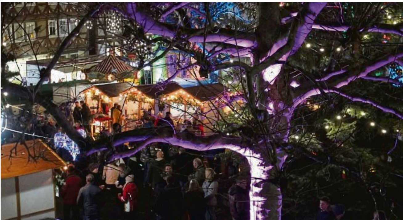
So schön kann es aussehen: Der Weihnachtsmarkt in Sontra musste auch in 2021 leider abgesagt werden.