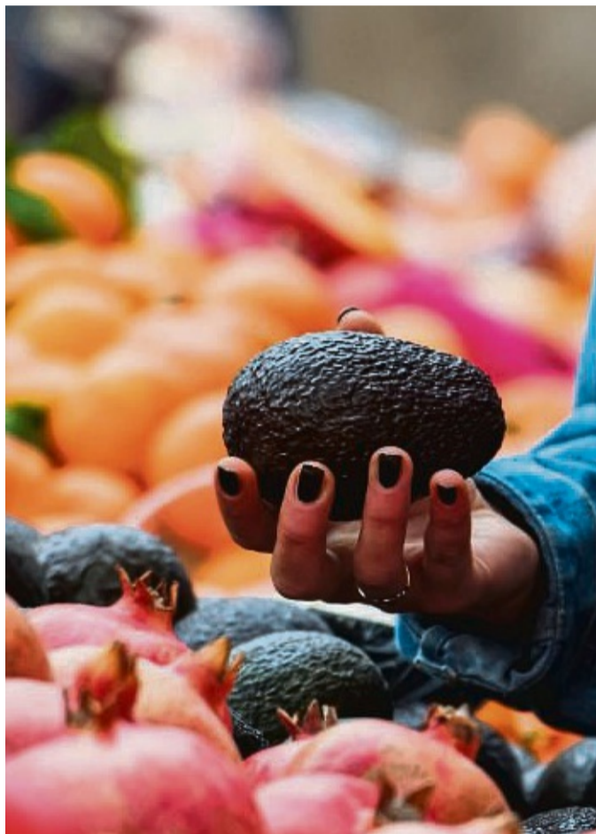
Frisches Obst und Gemüse gibt es jeden Mittwoch auf dem Sontraer Wochenmarkt.

Donnerstag, 27.1. Stadt- und Schulbibliothek 16 bis 19 Uhr, Jahnstraße 16, Sontra, Adam-v.-Trott-Schule