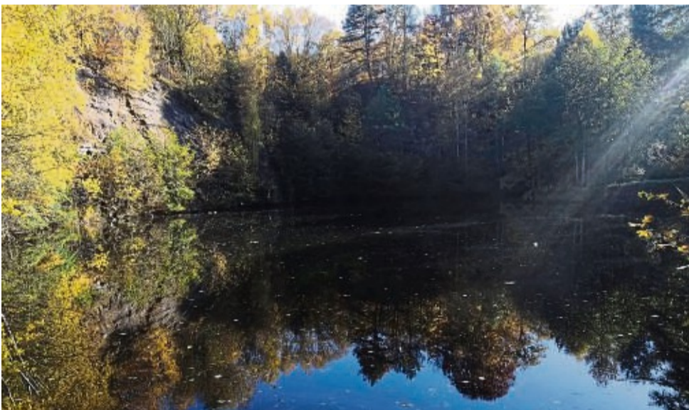
Im Sonnenschein: der See am Steinbruch in Cornberg.