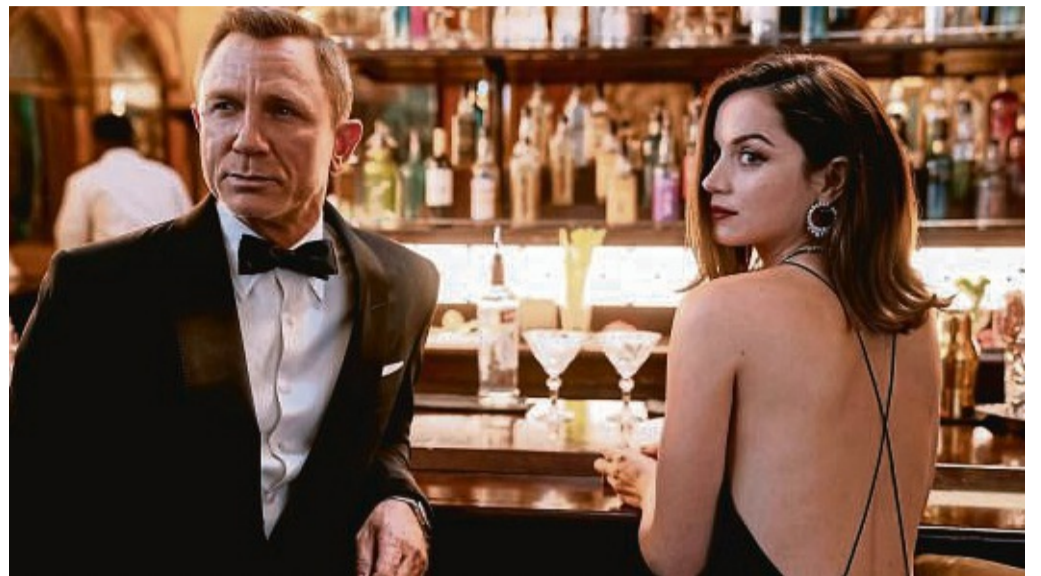
Sein letzter Fall: Daniel Craig verkörpert in „Keine Zeit zum Sterben“ ein letztes Mal den britischen Geheimagenten James Bond.

James Bond hat seine Lizenz zum Töten im Auftrag des britischen Geheimdienstes abgegeben und genießt seinen Ruhestand in Jamaika. Die friedliche Zeit nimmt ein un-erwartetes Ende, als sein alter CIA-Kollege Felix Leiter auftaucht und ihn um Hilfe bittet. Ein bedeutender Wissen-schaftler ist entführt wor- den und muss so schnell wie mög-lich gefunden werden. Was als simple Rettungsmission beginnt, erreicht bald einen bedrohlichen Wendepunkt, denn Bond kommt ei-