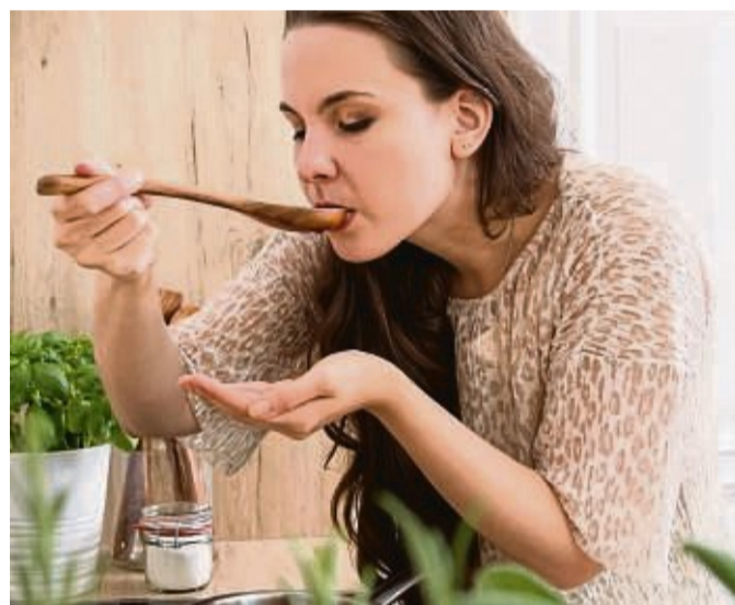
Kräuter sollten Komponenten einer gesundheitsfördernden Ernährung sein – etwa in einer Tomatensoße.

Salbei: Die darin enthaltenen Gerbstoffe sind verdauungsfördernd und blähungslindernd. Sie können zudem schweißhemmend sein. Sal-