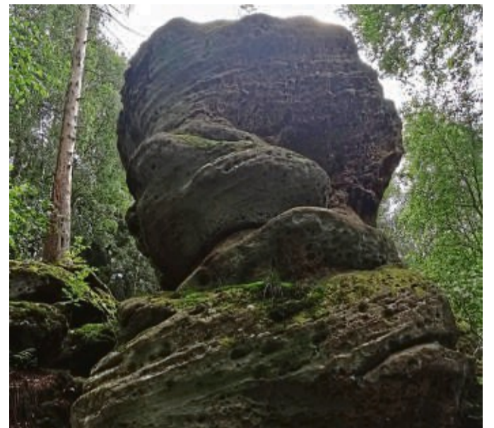
Der Riesenstein bei Heimarshausen war Geotop des Jahres 2021.

So gehören beispielsweise Aufschlüsse von Gesteinen