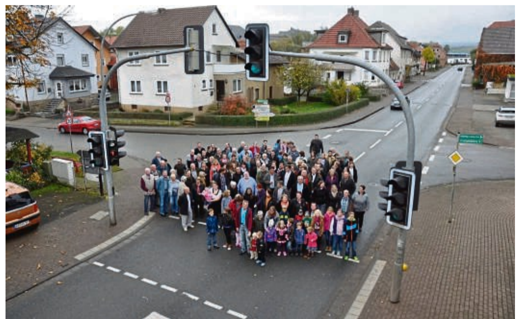
Mit Protestaktionen wie dieser im März 2018 fordern Anlieger der Bundesstraße 252 in Twiste schon seit Jahren den Bau einer Umgehungsstraße.

Die JU Bad Arolsen-Volkmarsen hofft, dass sich im Jahr 2022 mehr Gelegenheiten ergeben, um gemeinschaftliche Aktivitäten durchführen zu können. red