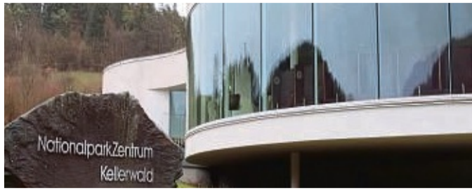
Öffnet wieder am 29. Januar: Das Nationalpark-Zentrum Kellerwald bei Herzhausen.

Vöhl/Edertal – Im Nationalpark-Zentrum bei Herzhausen werden an den Ausstellungsmodulen Wartungsarbeiten durchgeführt, daher ist es derzeit geschlossen. Im Wildtier-Park Edersee bei Hemfurth werden Bäume gefällt, der Park bleibt für Besucher jedoch offen. Wegen der