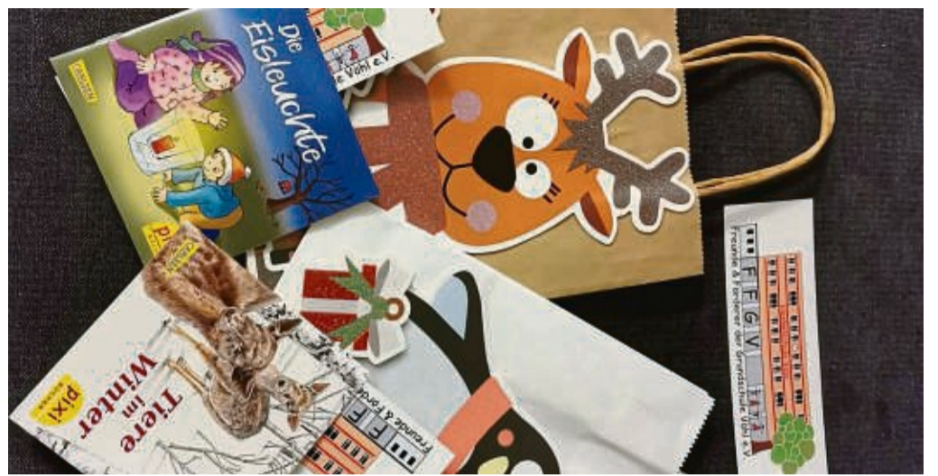
Der Förderverein machte den Vöhler Schüler mit Büchern eine Freude.

Förderverein überrascht Schüler mit Pixi-Büchern