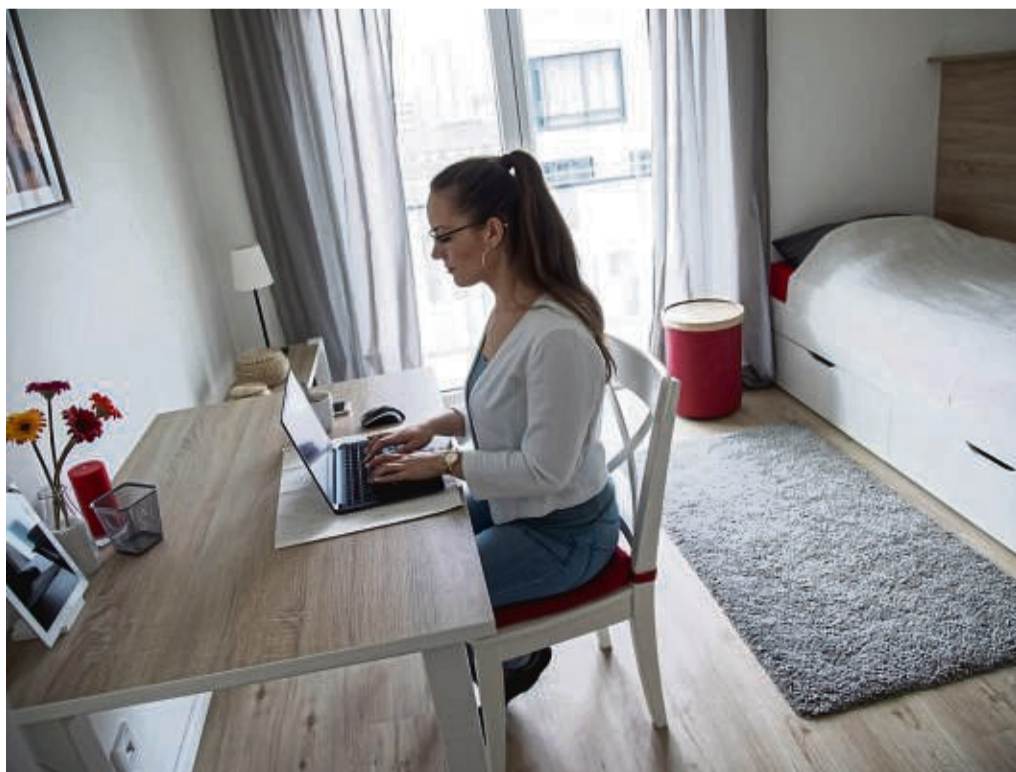
Wer üblicherweise im Homeoffice tätig ist, muss auch während einer Quarantäne von zu Hause aus arbeiten.