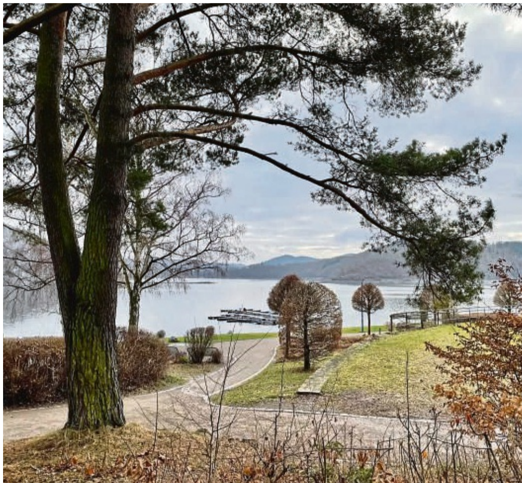
Regelmäßige Pflege und Kontrolle sind Pflicht: Detaillierte Daten der Bäume auf städtischen Flächen in allen zehn Waldecker Stadtteilen sollen erfasst werden; im Bild die bei Spaziergängern beliebte Uferpromenade am Strandbad am Edersee.

Wird eine Gefahr erkannt, kann der Baumkontrolleur Pflegemaßnahmen empfehlen. Dazu gehören häufig: Entfernen von Totholz, Anbringen von Kronensicherungssystemen, unter Umständen auch Kroneneinkürzung oder das Fällen des Baumes. Die Stadt sei in der Haf-