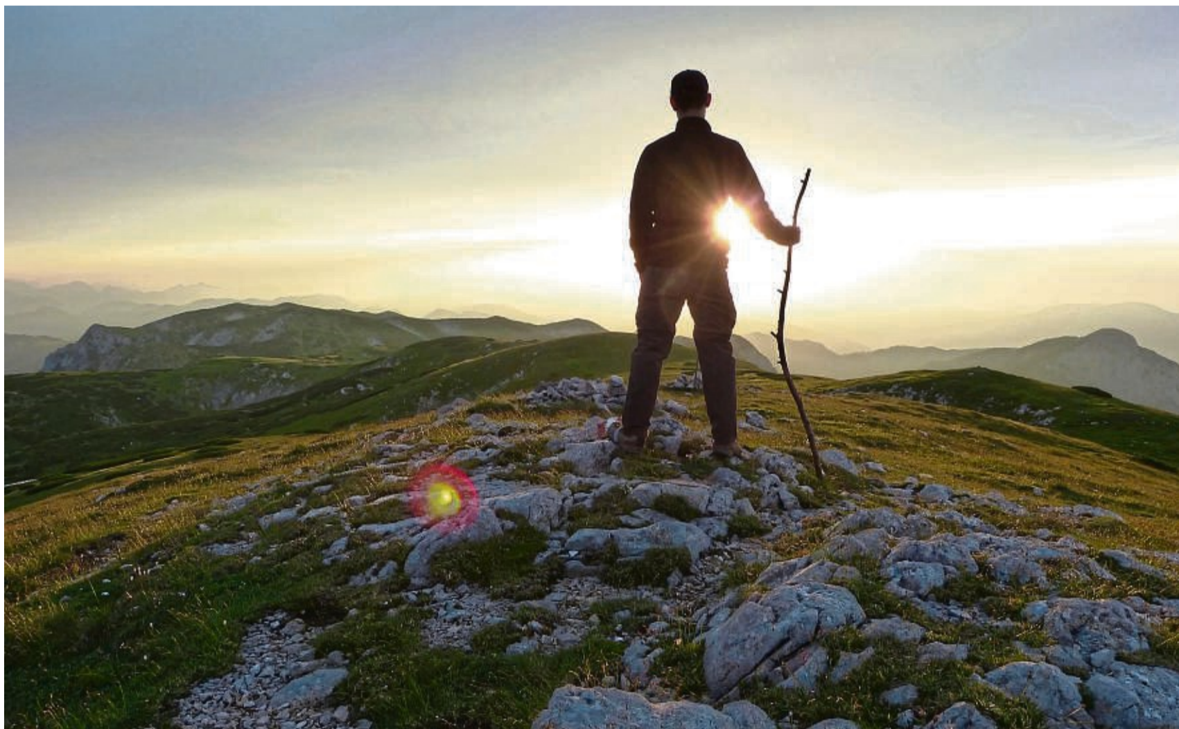
Mal was anderes als das Büro sehen und sich neu orientieren: Ein Sabbatjahr macht's möglich.

Wie lange dauert in der Regel ein Sabbatical? Auch das ist verschieden. Es kann ein