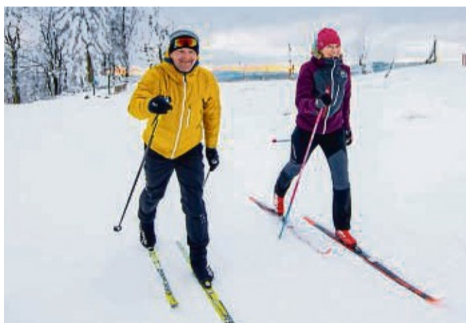
Langlauf im winterlichen Upland zu ermöglichen, erfordert einiges an Mühe. Skifahrer können diese unterstützen.

Zu den Arbeiten gehört nicht nur das Spuren der Loipen, sondern auch das Aufstellen der Schilder und Instandhalten der Maschinen