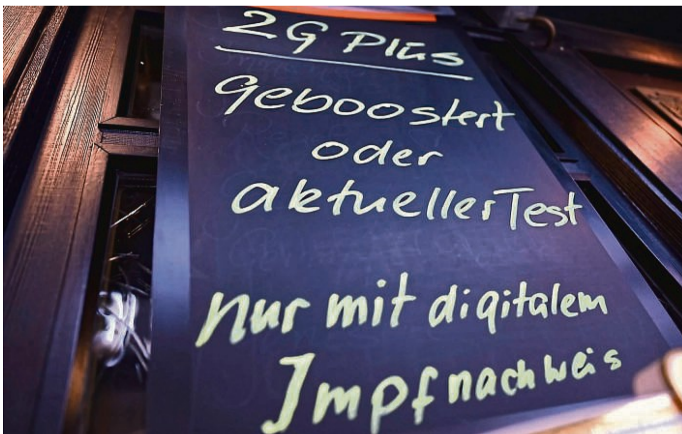
In Waldeck-Frankenberg gelten jetzt strengere Corona-Regeln – unter anderem 2G-Plus in der Innengastronomie.

„Die 2G-Plus-Regel bedeutet, dass Genesene und Geimpfte, die noch keine Auffrischimpfung bekommen haben, zusätzlich zu ihrem Impf- oder Genesenen-Status einen negativen Testnachweis vorzeigen müssen, wenn sie die genannten Bereiche besuchen möchten“, erläutert der Landkreis. Dies gelte nicht für frisch doppelt Geimpfte, deren zweite Impfung weniger als drei Monate zurückliegt.