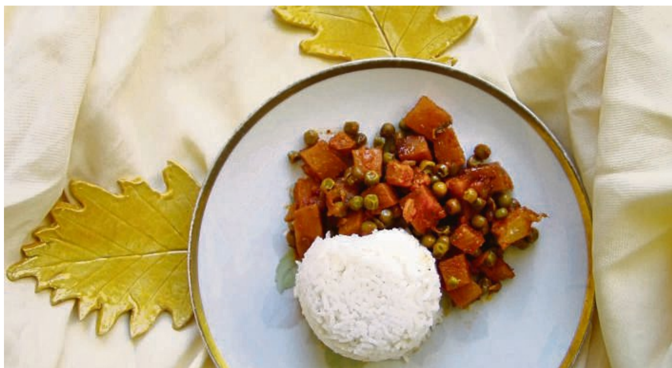
Beim Steckrübe Sweet'n spicy-Topf gewinnt die Steckrübe im Backofen ein aufkonzentriertes, leicht herbes Aroma, das mit dem Süße-Säurespiel der Ananas harmoniert.

Der Aufwand lässt sich auch beim Abwasch geringhalten, denn es wollen nicht zig Töpfe und Pfannen gespült werden. Ob mit oder ohne Fleisch, das immer zuerst mit Zwiebeln angebraten wird: Es brodelt meist gemeinschaftlich Wurzelgemüse wie Rote Bete, Pastinake, Topinambur, Schwarzwurzel oder diverse Kohllarten zusammen in einer Gemüse-