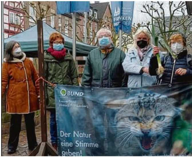
Mit Plakat: Vertreter des BUND Waldeck-Frankenberg haben auf dem Frankfurter Obermarkt dieses Foto für die Online-Aktion aufgenommen

Buchhandlung Hykel verteilt Lesetüten an Grundschüler