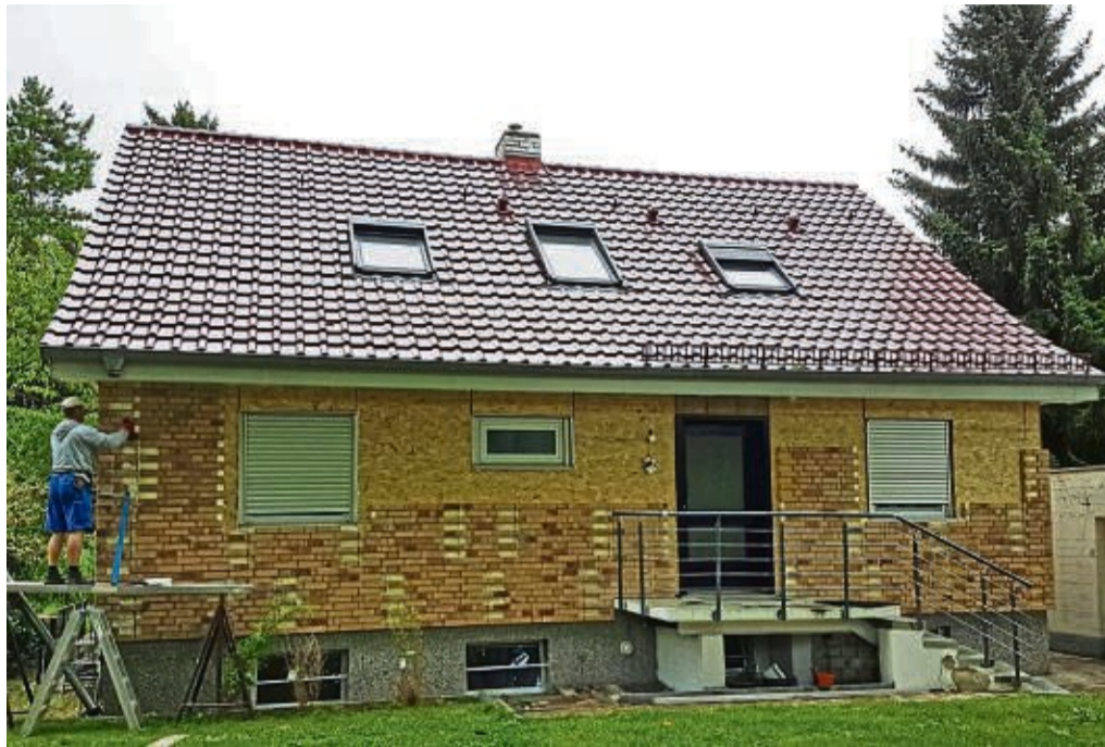
Mit Systemklinkern bekommt die Wärmedämmung ein Upgrade.

Worauf Heimwerker achten müssen: Die Schwierigkeiten bei einer energetischen Fassadenmodernisierung liegen jedoch gerade für Selberma-