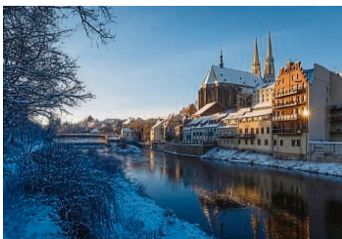
Die Gölitzer Altstadt mit der Peterskirche hat auch im Winter ihren Reiz.

Bamberg: Auf den Spuren von Krippen und Rauchbier. Bamberg begeistert nicht nur beim Gang durch die mittelalterliche Altstadt seine Besu-