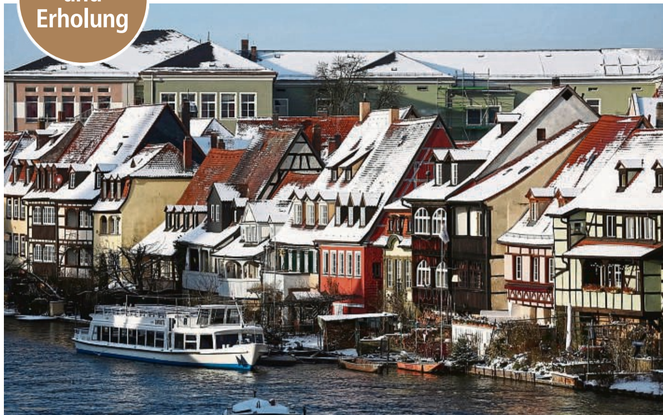
Wie Puderzucker: Die Häuschen der ehemaligen Fischersiedlung „Klein Venedig“ in Bamberg liegen unter einer dünnen Schneedecke.