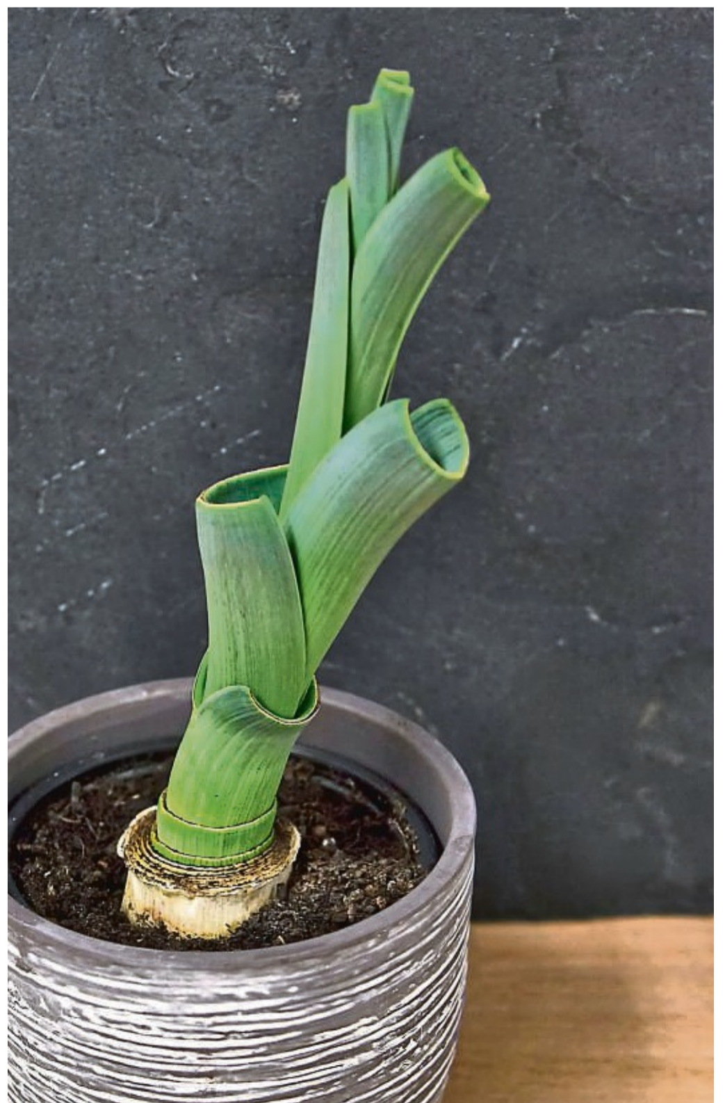
Sieht auch im Topf schön aus: Lauchreste aus der Küche lassen sich wieder antreiben.

Regrowing funktioniert bei Pflanzen, die sich vegetativ, also ungeschlechtlich ver-