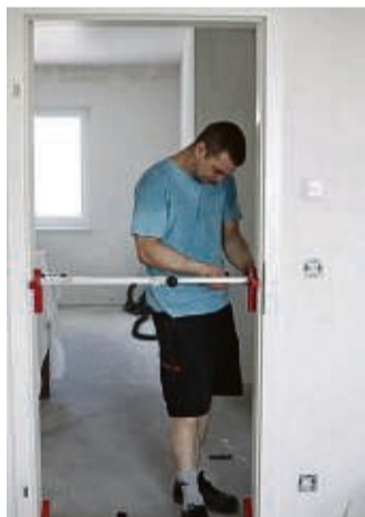
Zum altersgerechten, barrierefreien Wohnen gehören auch schwellenlose Türen mit breitem Durchgang.

Bei neueren Immobilien ab Baujahr 2011 sieht es etwas besser aus. Hier erfüllen immerhin rund 18 Prozent die Kriterien. Den Bedarf an seniorengerechtem Wohnraum haben auch Immobilienanbieter und Bauunternehmen erkannt. Doch nicht immer setzen sie auf echte Barrierefreiheit, sondern werben lediglich mit Begriffen wie „seniorengerecht“ oder „altersgerecht“. Diese Formulierungen haben aber keine rechtliche Verbindlichkeit, warnt Erik Stange, Pressesprecher des Verbraucher-