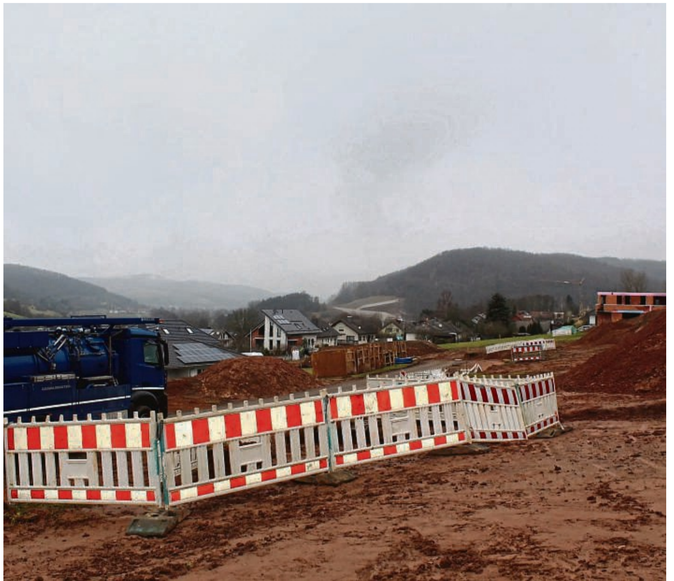
Hier wird aktuell die Straße „Auf der Spitze“ gebaut. In diesem Bereich hatte die Stadt 20 Grundstücke im vergangenen Jahr an „Town & Country-Haus“ verkauft.

Die vier Grundstücke, die aktuell in der Kernstadt zur Verfügung stehen, würden teilweise wegen der Lage oder dem Zuschnitt nicht nachgefragt werden.