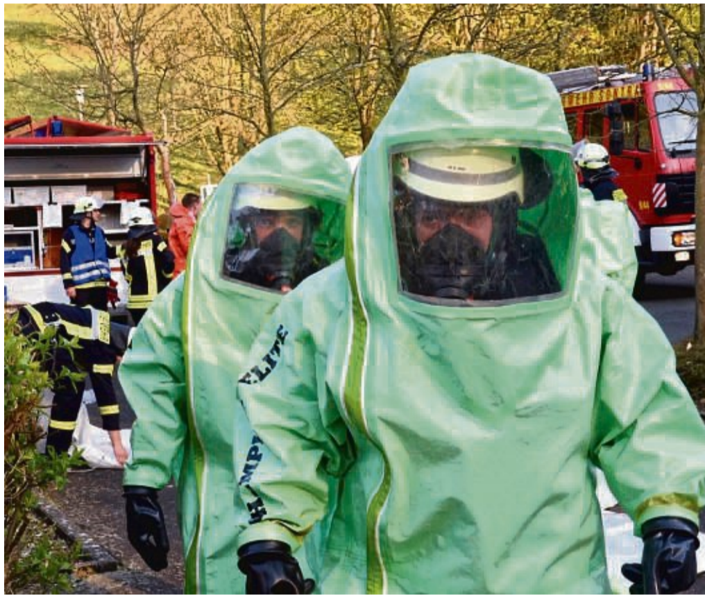
Vorerst ruhen die praktischen Dienste: Vorerst finden im Kreis keine Dienste, wie etwa hier bei einer Gefahrenstoff-Übung in Sontra in Sontra, statt.

Im Landkreis folgen der Empfehlung zum Beispiel die Wehren in Wanfried, Eschwege, Sontra, Waldkappel und Berkatal. „Wir als Feuerwehr sind Teil der