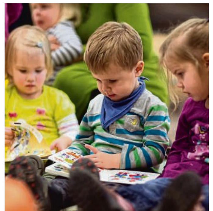
Lasst die Kinder zu mir kommen: Unter diesem Motto wird zum Kindergottesdienst geladen.

NOTRUF Feuerwehr/ Rettungsdienste: 112 Rettungsdienste Arbeiter-Samariter-Bund.