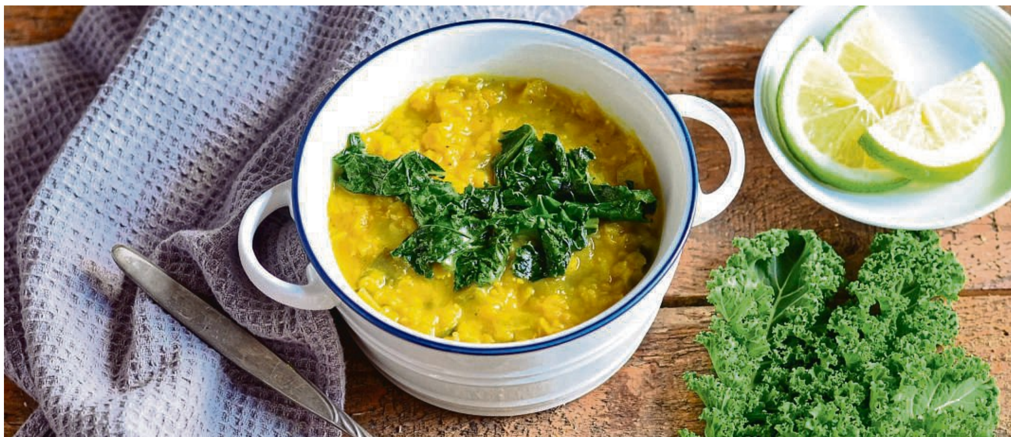
Die zitronige Linsensuppe kommt ohne Ingwer oder Knoblauch aus. Dafür sorgen Porree, Kurkuma, Kreuzkümmel und frisch gepresster Zitronensaft für Aroma. Gebratener Grünkohl setzt als Topping Akzente.