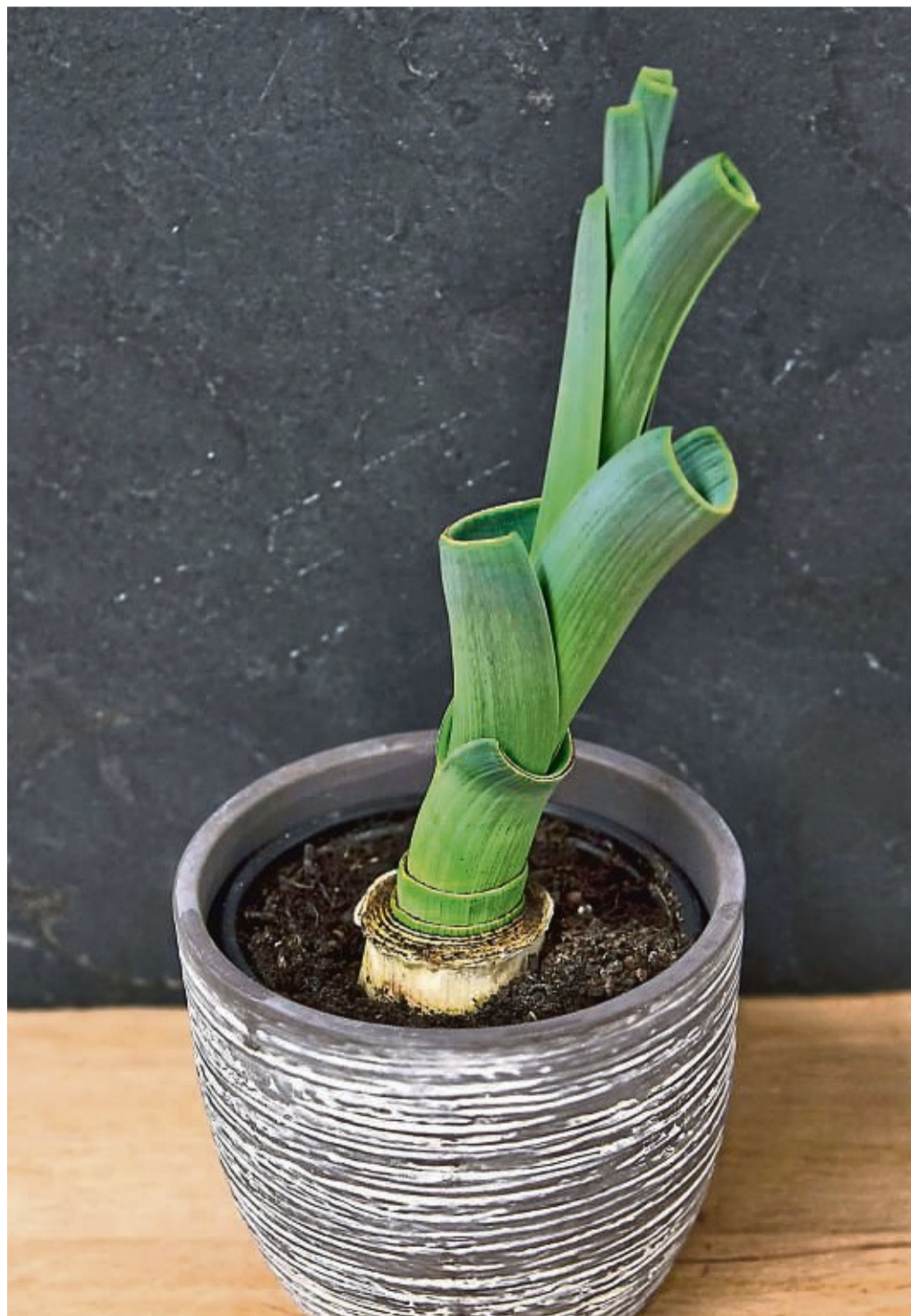
Sieht auch im Topf schön aus: Lauchreste aus der Küche lassen sich wieder antreiben.

Wer es dennoch mit dem Regrowing zum Winterende noch versuchen will: ab Ende Januar loslegen. Denn wenn der Anteil mit Tageslicht wieder spürbar zunimmt, gehe es mit Qualität und Geschmack der Pflanzen wieder aufwärts, sagt der Fachbuchautor Engelbert Kötter. tmn