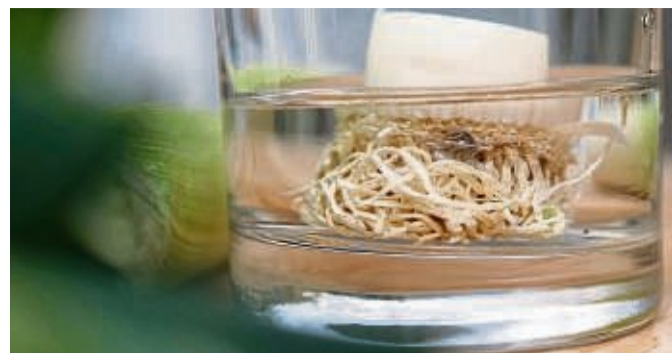
Bereits nach vier Tagen sollte der Strunk stark zu wachsen beginnen und nach etwa einer Woche kann man die Pflanze in einen Topf mit Erde setzen.