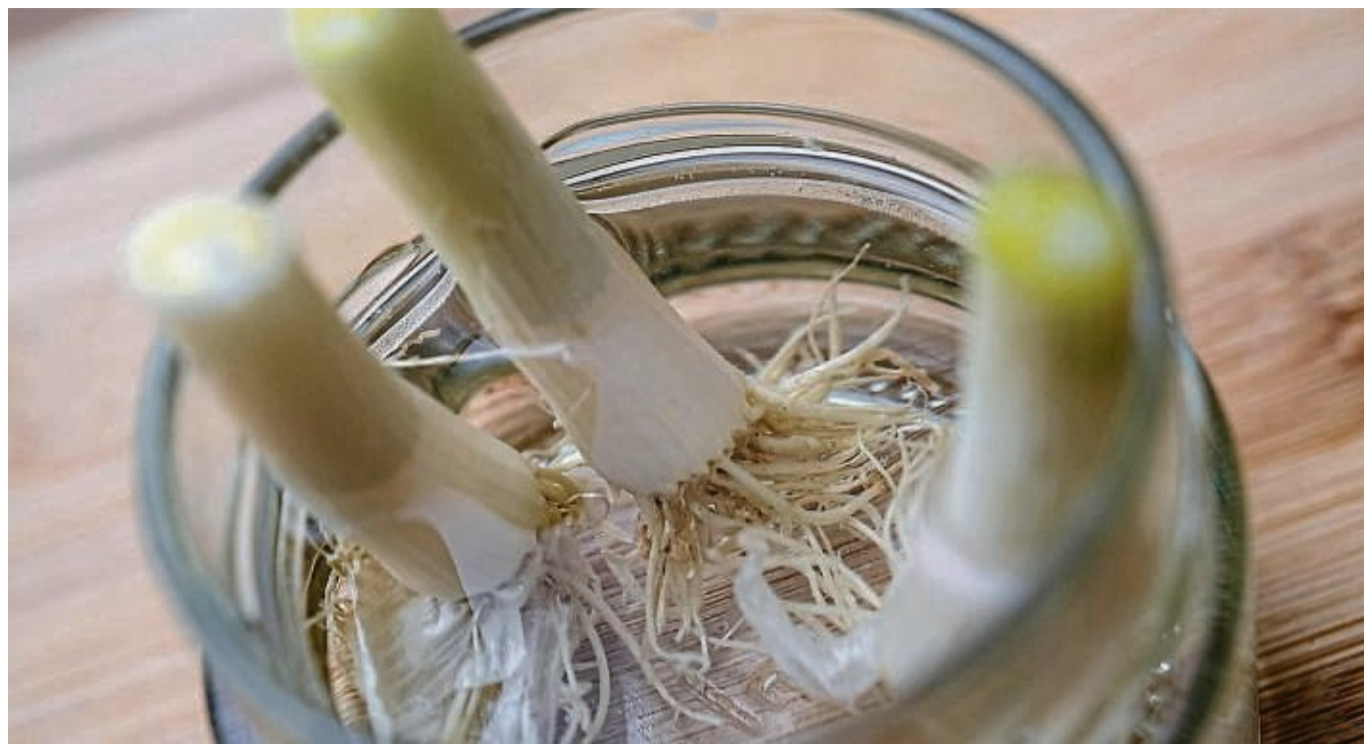
Von Frühlingszwiebeln kommt ein mindestens fünf Zentimeter langes Endstück mit Wurzeln ins Wasser.