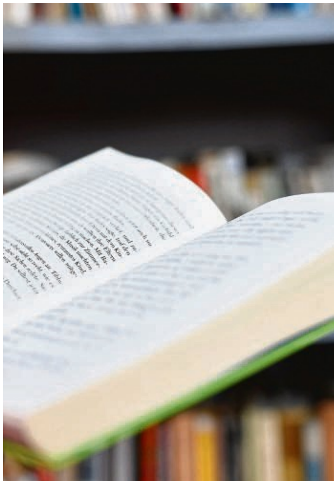
Krimis, Liebesromane oder Sachbuch: In der Stadtbibliothek kommt jeder auf den Geschmack.