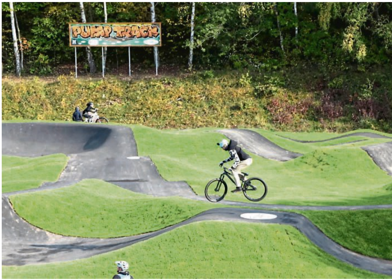
Teil der Zukunftswerkstatt in Sontra ist auch der Pumptrack, der bereits zu einem beliebten Ausflugsziel gehört.

Zukunftswerkstatt will Sontra als Erlebnisstadt etablieren