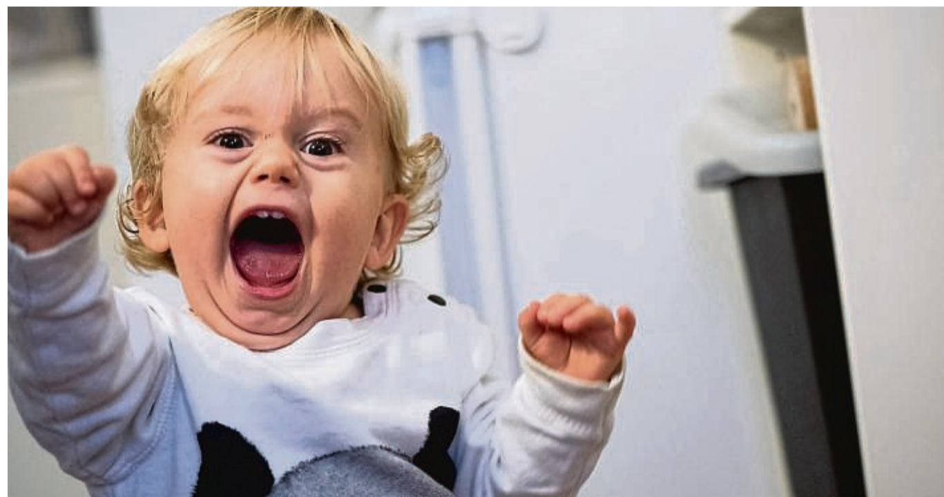
Wenn das Kind abends völlig aufgedreht und kreischend durch die Wohnung flitzt, braucht es vor dem Schlafengehen erst noch eine Ruhephase zum Runterkommen.