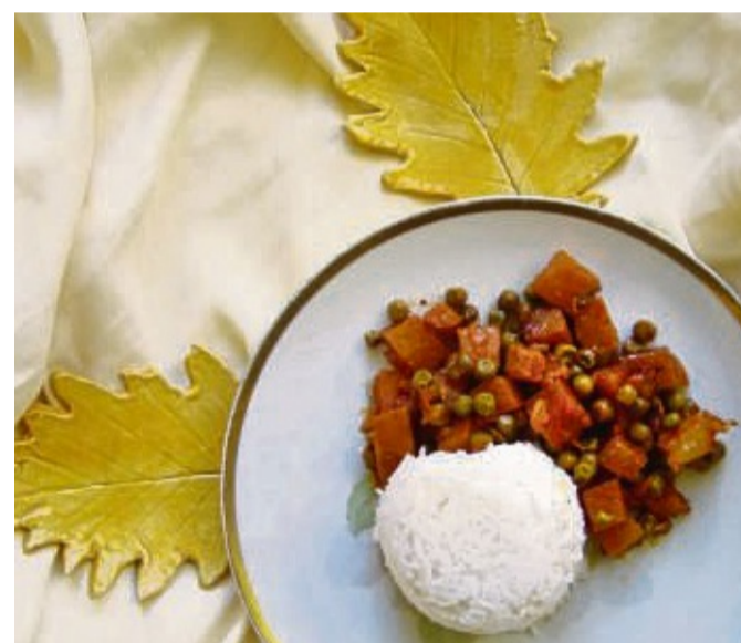
Beim Steckrübe Sweet’n spicy-Topf gewinnt die Steckrübe im Backofen ein aufkonzentriertes, leicht herbes Aroma, das mit dem Süße-Säurespiel der Ananas harmoniert.

Peggy Schatz mag das Zusammenspiel von herben und fruchtigen Aromen, etwa beim veganen „Steckrübe Sweet’n spicy“-Topf: „Die Steckrübe gewinnt im Backofen ein aufkonzentriertes,