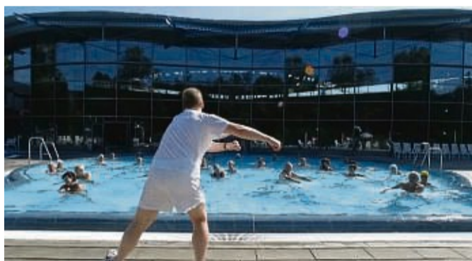
Bewegung im Wasser hält Menschen bis ins hohe Alter fit.

Im Freizeitbad Arobella in Bad Arolsen kann man sich