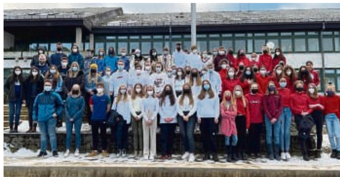
Blau-Weiß-Rot: Uplandschüler haben die Flagge des Nachbarland Frankreich nachgestellt.