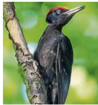
Auge in Auge mit einem Schwarzspecht.

„Viel Geduld, Kenntnis und eine gute Tarnung machen es