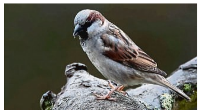
Der Sperling hatte im Kreis die höchste Anzahl an Beobachtungen.

Mehr als 324 000 Vogelsichtungen sind beim NABU Hessen eingegangen. Am häufigsten wurde der Haussperling gezählt. Allein in Waldeck-Frankenberg wurden 3062 Haussperlinge gezählt – und zwar von 472 Vogelfreunden in 329 Gärten und Parks. Platz zwei belegte die Kohlmeise mit 1814 Sichtungen, gefolgt von der Blaumeise mit 1521 Vögeln. Beide Arten verzeichneten gegenüber dem Vorjahr einen deutli-