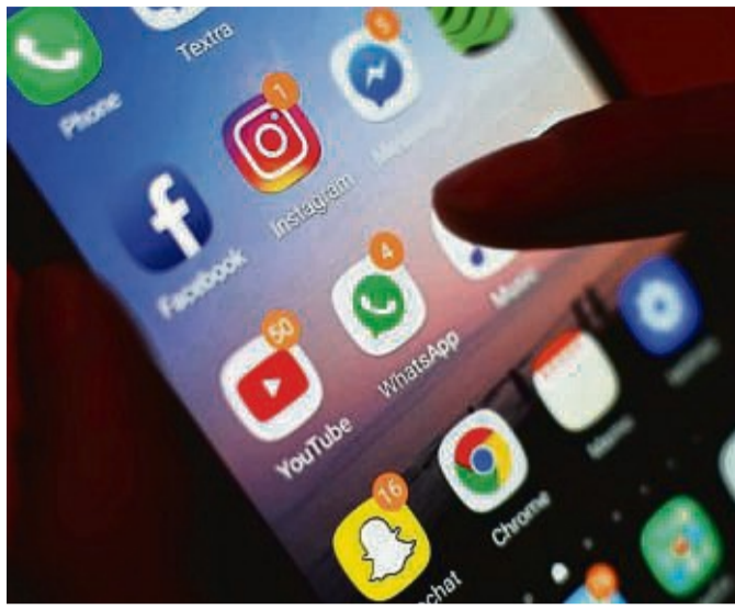
Betrugsfälle über den Messenger-Dienst „Whatsapp“ nehmen zu, weiß die Polizei.

In allen Fällen hätten die geschädigten Personen eine Whatsapp-Nachricht einer unbekanntenen Nummer erhalten. In der Nachricht habe sich der Täter als Mitglied der Familie ausgegeben und um die Überweisung von Geld gebeten. „Die Täter übermitteln per Nachricht im Messenger-Dienst in der Regel eine Kontonummer, auf die das Geld überwiesen werden soll.“ Bei diesem Delikt handele es sich um eine Form des Computerbetrugs. „Die Opfer weisen keine besonderen Eigenschaften auf. Jeder Mensch, der Messenger-Dienste unabhängig vom Anbieter benutzt, kann Opfer werden“, berichtet der Polizei-Sprecher. Angesichts dieser Entwicklung haben Whatsapp und die Polizeiliche Kriminalprävention die Kampagne „Kontrolle ist besser – Check Deinen Check“ ins Leben gerufen. „Bei Nachrichten von unbekanntenen Nummern sollte man skeptisch sein. Auf jeden Fall sollte das entsprechende Familienmitglied über die bekannte Nummer kontaktiert werden“, rät er.