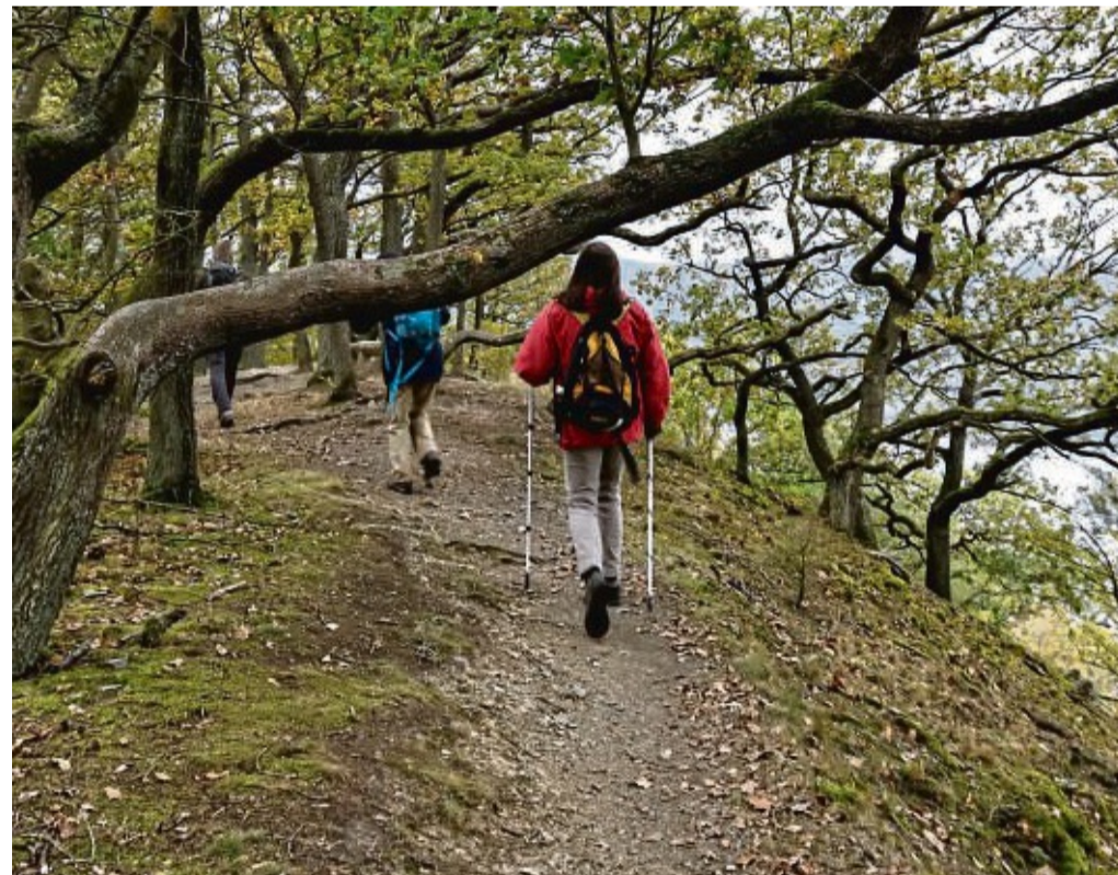
Wandern auf dem Urwaldsteig Edersee: Ein Ausflug an den Hängen im Nationalpark Kellerwald-Edersee oberhalb des Edersees lohnt sich zu jeder Jahreszeit.