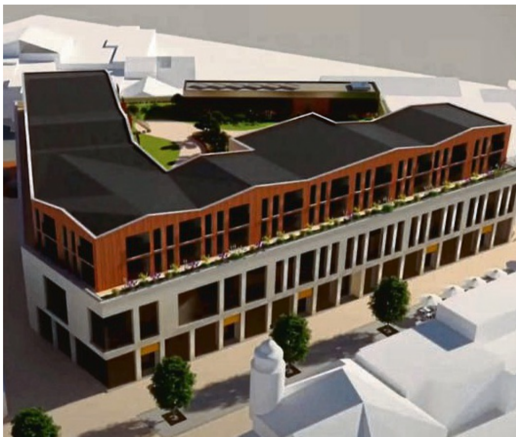
Ansicht von der Fußgängerzone aus: Der geplante Neubau in der Bahnhofstraße wird niedriger als der frühere Gebäudekomplex sein.

Die Wohnungen mit Zuschnitten von 40 bis 100 Quadratmetern haben zur Fuß-