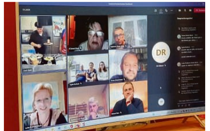
Kulinarisch verbunden: Edertaler und ihre Freunde in Horní Cermná tauschen sich online aus und sammeln Rezepte aus dem Waldecker Land und aus Ostböhmen.