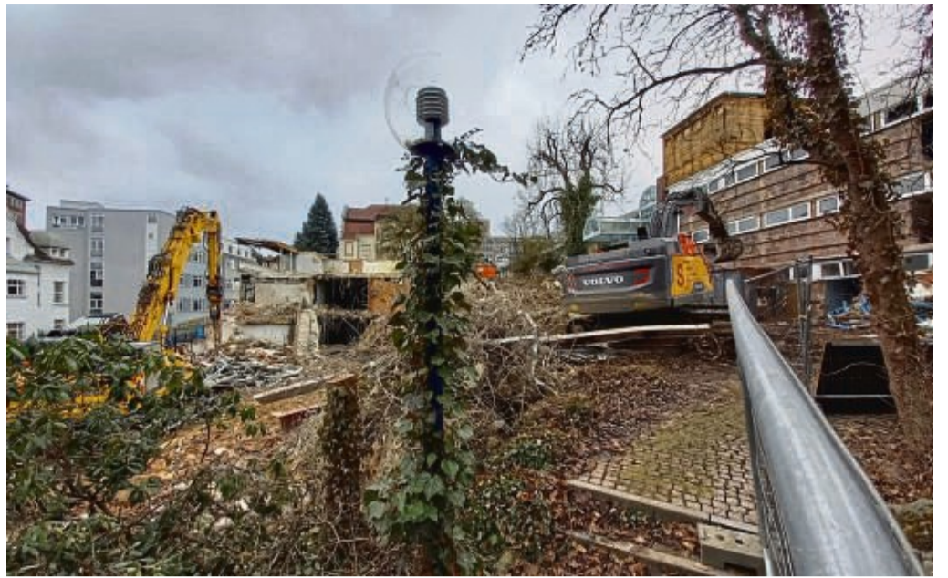
Im Begriff zu verschwinden: Das Therapeutikum (links), während das Badehaus als Brandruine rechts noch auf den Bagger wartet. Oberhalb des Baggers rechts ist der verschlossene Arkadenausgang zu erkennen.