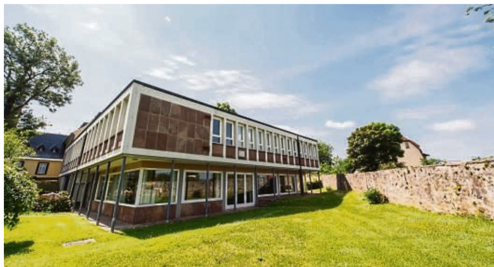
Der Campus der THM in Frankenberg.