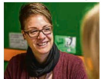
Die Bildungsberaterin hilft beispielsweise bei der Ausarbeitung eines persönlichen Weiterbildungsplans.

Ratsuchende werden dort an passgenaue Fachberatungsstellen vermittelt, und es besteht die Möglichkeit eine individuelle Kompetenzbilanz zu erstellen (ProfilPASS). Der HESSENCAMPUS Waldeck-Frankenberg ist außerdem Anbieter zahlreicher kostenloser Fachveranstaltungen, Vorträge und Workshops zu Themen, die von regionaler Bedeutung sind. Zur Zielgruppe dieser Veranstaltungen gehören alle Fachkräfte, Ehrenamtler, politischen Vertreter und Interessierte der Region, die sich vom