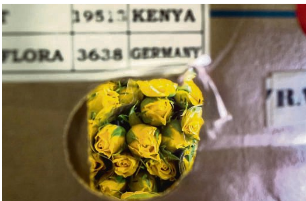
Im Winter wachsen Rosen nicht in Deutschland. Sie müssen daher für den Valentinstag aus Ländern wie Kenia importiert werden.