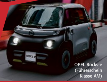
OPEL Rocks-e (Führerschein Klasse AM)