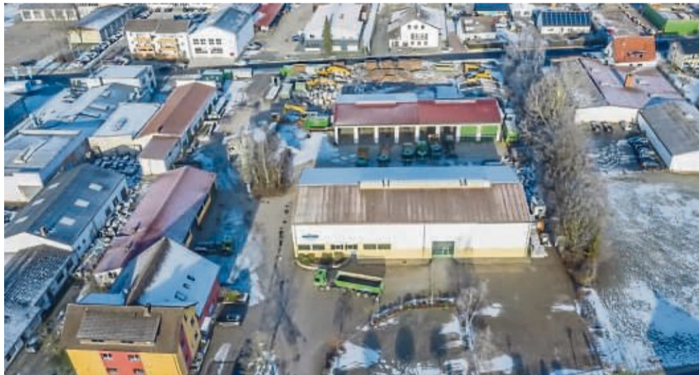
Bei Heinrich Mütze stehen jungen Menschen unterschiedlichste Ausbildungsmöglichkeiten offen.

Hohe Qualitätsansprüche stellt das Unternehmen auch an seine Mitarbeiter, weshalb es selbstverständlich ist, junge Menschen im Straßen- und Tiefbau sowie auch im kaufmännischen Bereich selbst auszubilden. Denn qualifizierte und motivierte Mitarbeiter und Mitarbeiterinnen sind ein wichtiger Faktor des Unternehmenserfolges, weiß man bei Heinrich Mütze. Dort wird jungen Menschen eine abwechslungsreiche Ausbildung geboten. So