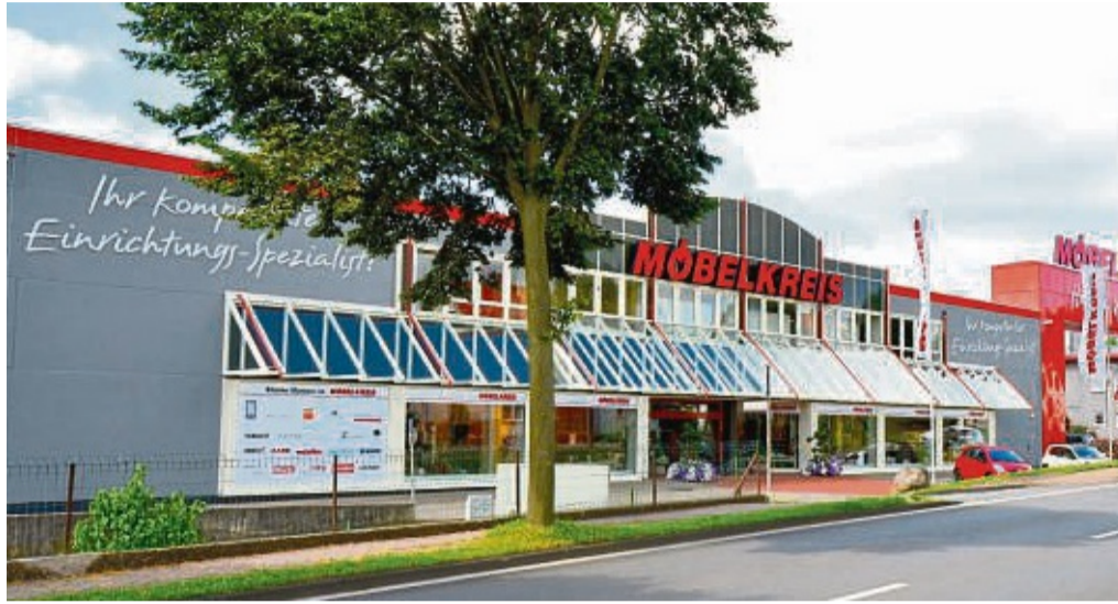
Der Möbelkreis Waldeck in Korbach-Meininghausen bietet innovative und individuelle Einrichtungslösungen. Dabei legt das Unternehmen ein besonderes Augenmerk auf die eigene Ausbildung professioneller Mitarbeiter.

Auf das richtige Personal kommt es dabei an. Deshalb hat es sich der Möbelkreis vor langer Zeit bereits zur Aufgabe gemacht, motivierte Nachwuchskräfte selbst auszubilden. Besonderes Augenmerk wird dabei auf die individuelle Förderung und intensive Ausbildungsbegleitung gelegt. Mit abwechslungsreichen Aufgaben, überdurchschnittlichen Vergütungen, vielen Sozialleistungen und einem besonders guten Betriebsklima überzeugt der Möbelkreis sein Personal seit jeher. Auch die acht momentan beschäftigten Azubis füh-