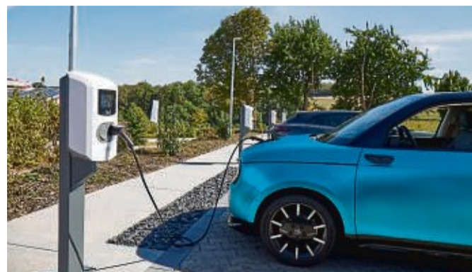
Glittenberg-Ladepark: Der im Herbst 2020 eingeweihte Ladepark steht der Belegschaft kostenfrei zur Verfügung.

Glittenberg ist technologischer Weltmarktführer