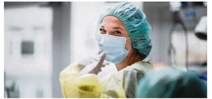
Die Krankenpflege ist eine besonders verantwortungsvolle und erfüllende Aufgabe.

kempfleger, zum Altenpfleger und zum Gesundheits- und Kinderkrankenpfleger bündelt. Die Ausbildung zum Pflegefachmann oder zur Pflegefachfrau ist generalistisch aufgebaut. Die Auszubildenden lernen alle Pflegebereiche kennen, so können Pflegefachkräfte später in verschiedensten Pflegeberufen und medizinischen sowie sozialen Einrichtungen arbeiten. Zudem werden gut ausgebildete Fachkräfte für die Pflege überall händelnd benötigt, so hat man nach der Ausbildung einen wirklich sicheren Arbeitsplatz. Die Neurologische Klinik Westend in Bad Wildungen ist eine Reha-Klinik für Patienten, deren körperliche Beeinträchtigungen durch eine Schädigung des Hirns, sei es durch einen Schlaganfall, durch eine Operation oder durch einen Unfall, entstanden sind. In der Neurologischen Klinik Westend verbinden sich die Anforderungen einer neurologischen Reha mit den spannenden Aufgaben der intensivmedizinischen Betreuung. Nachdem das Unternehmen bereits seit vielen Jahren Partner für die Ausbildungsjahrgänge in Bad Wildungen war, bietet es bereits