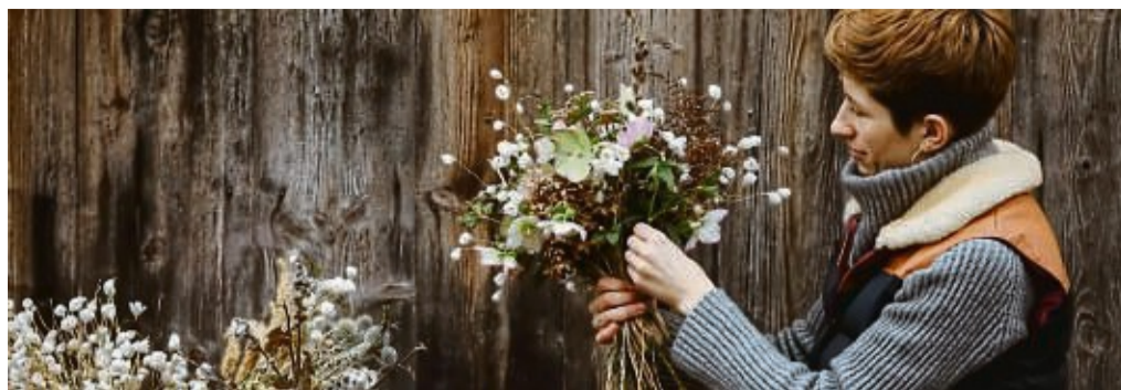
Auch wenn ein Strauß mit regionalen Blumen im Winter eine Herausforderung ist, es gibt ihn – etwa mit Christrosen und Weidenkätzchen.